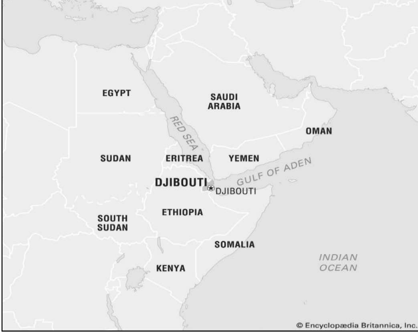
Şekil 1: Cibuti Cumhuriyeti'nin Dünya'daki Konumunu Gösteren Harita