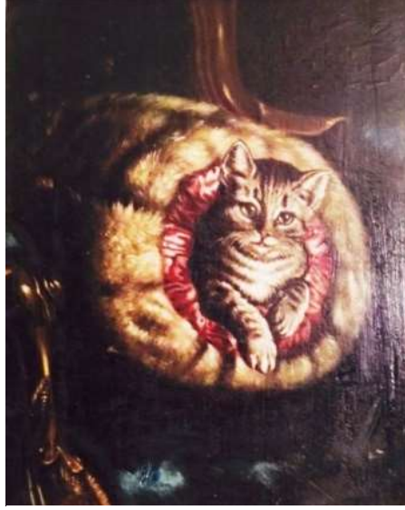
Kedi (yağlı boya)