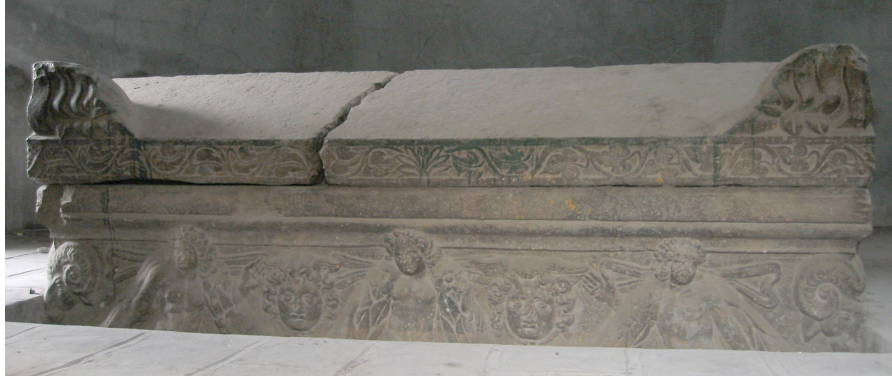
Resim 16. Amasya Halifet Gazi Türbesi, alt kat, lahit (V. M. Tekinalp arşivi).

biçimleri nedeniyle yapıların veya mimari öğelerin kaidelerinde taşıyıcı / yükseltici ve bezeyici niteliği ile tercih edilen devşirme parçalardır. Örnekler arasında Konya Anonim Türbe'nin (13. yüzyılın ilk çeyreği) kaidesinin kuzey cephesinde, Konya Hoca Fakih Mescidi'nin (13. yüzyılın ilk yarısı) kuzey cephesinde, Konya Sahip Ata Camii'nin (1258) taç kapı kaidesinde, Beyşehir Eşrefoğlu Camii'nin (1296-1299) taç kapı kaidesinde, Zıvank Han'ın (13. yüzyıl) taç kapısının iki yanındaki lahitler sayılabilir (Aktaş, 1988, s. 81, 89; Erdemir, 1999, Resim 18; Erdmann, 1961, Levha 313; Karamağaralı, 1982b, s. 25, Resim 1-2;). Roma dönemine ait olan bu lahitler anıtsal ve süslü olan taç kapı kütesini taşıması amacı ile kullanılmışlardır. Lahitlerin bezemeli olan yüzeyleri dışa gelecek şekilde yerleştirilerek taç kapı süslemeleri ile bütünlük oluşturmalarına özen gösteril-