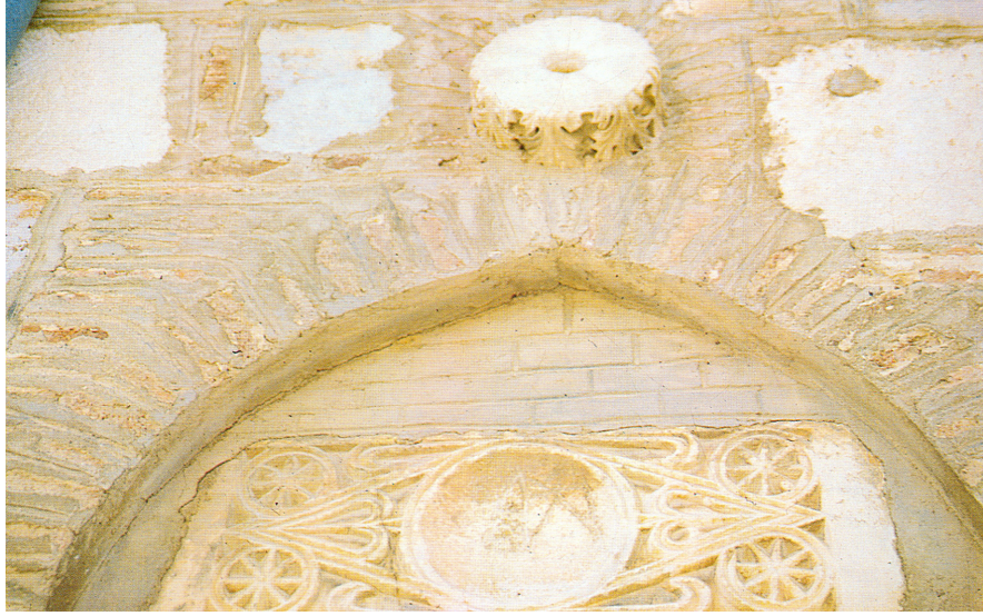
Resim 7. Yalvaç Devlethan Camii, doğu cephe, güneyden ilk pencere alınlığı, templon arşitravı.

Devşirme malzemeler içinde kullanım sırasında işlevine dikkat edilen diğer önemli bir grubu arşitrav / templon arşitravı ve parçaları oluşturmaktadır. Arşitravların genellikle lento ve söve olarak kullanıldıkları saptanmaktadır. Atabey Ertokuş Medresesi'nde avlu ve eyvana açılan kapıların lento ve söveleri ile avludaki havuzun su oluşunun iki yanında Bizans dönemine ait arşitrav parçaları kullanılmıştır (Demiriz, 1970-1971, s.