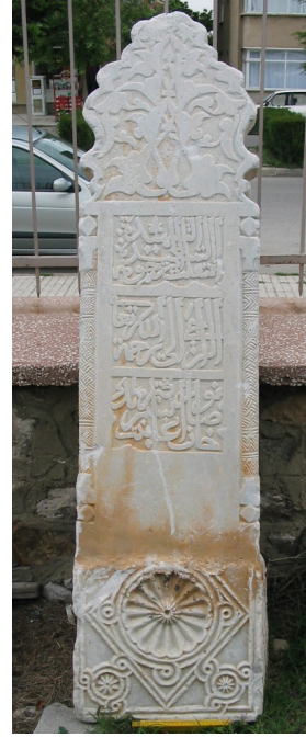
Resim 11. a- Mezar taşı, templon arşitravı (Akşehir Arkeoloji Müzesi, Envanter no. 80) b- Mezar taşı, templon arşitravı (Yıldırım 2006)

Örnekte alt kısım templon arşitravı görüntüsü sunarken, üst kısım mezar taşının şahidesini oluşturacak biçimde kıvrık dal, rumi ve palmet motifleriyle sonlanmıştır. Görüldüğü gibi bu uygulamalarda templon arşitravlarının boyutu, biçimi ve malzemesi