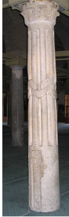
Resim 2. Konya Alâeddin Camii, harim, düğümlü sütun.

Camilerin dışında devşirme mermer sütunların açık ve kapalı avlulu medreselerde revak ve kubbeli bölümlerde kullanımı yaygındır. Örnekler arasında Atabey Ertokuş (1224), Akşehir Taş (1250), Sivas Buruciye (1271), Eğirdir Dündar Bey (1301-1302), Korkuteli Emir Sinaneddin (1319), Karaman Hatuniye (1381-82) (Resim 3) ve Kayseri Hatuniye (1431-32) medreseleri verilebilir (Bilget, 1991; Demiralp, 1996, s. 59, Resim 74; Demiriz, 1970-71, s. 87-100; Sözen, 1970, s. 27, 140-