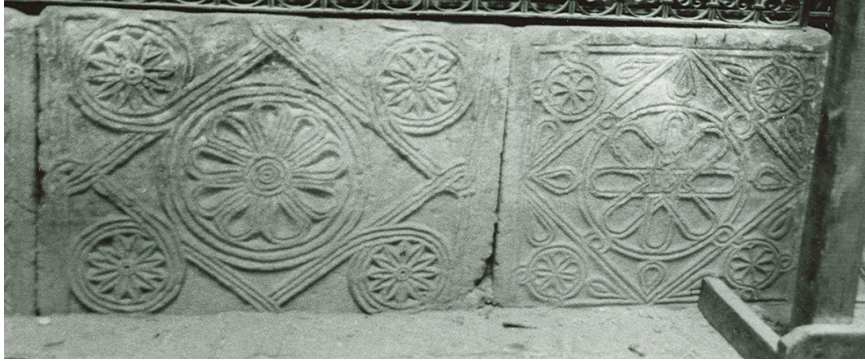
Resim 14. Atabey Ertokuş Medresesi, ana eyvan sekisi önü, korkuluk levhası 3 ve 4

korkuluk levhası tahrip edilerek kapıya sivri kemer biçimi verilmiştir (Resim 15). Alt kısmı tahrip olan dikdörtgen çerçeveli korkuluk levhasının yüzeyinde bir eşkenar dörtgen ile kenar ortaylarında dörtgene ve çerçeveye düğümlenen daireler ile ortasında malta haçı yer alır. Haçın kolları arasında kuş figürü ile bitkisel motifler bulunur. Dediği Dede Tekkesi'ndeki dikdörtgen biçimli levhada ise birbirlerine yönelerek bir kaptan su içen iki tavus kuşu betimlenmiştir.