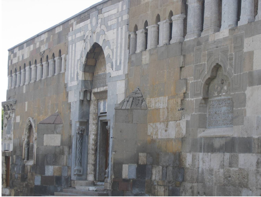
Resim 5. Konya Alâeddin Camii, kuzey cephe, galeri, çift sütunlar.

Özellikle çift sütunda denilen yassı oval payelerin özgününde olduğu gibi bodur oldukları pencere sövesi olarak ya da duvara bitişik taşıyıcı öge olarak değerlendirildikleri görülmektedir. Konya Seyfeddin Karasungur Türbesi (1270) (Önkal, 1996, s. 126-129, Resim 181) ile Zazadin Han'ın (1235-1237) (Erdmann, 1961, s. 186-187) pencerelerindeki çift sütunlar söve olarak değerlendirilen örneklerdir (Resim 6). Çift sütunlar Kuruçeşme (1207-10) ve Obruk (1210-19) hanlarının kapalı bölümleri ile Dokuzun Derbent ve Obruk hanlarında taç kapılarda kullanılmıştır (Erdmann, 1961, Levha 13-14, 18, 236, 242). Bunların farklı bir kullanım biçimi de Konya Alâeddin Camii'nin kuzey cephesinde görülür (Resim 5). Caminin kuzey cephesindeki galeriler farklı boyutlardaki mermer yassı payelere atılan sivri kemerlerle oluşturulmuştur. Çift sütunların boylarının farklı olması ikinci kullanıcı açısından bir sorun teşkil etmemiş, cephe bu malzemelere göre tasarlanmıştır.