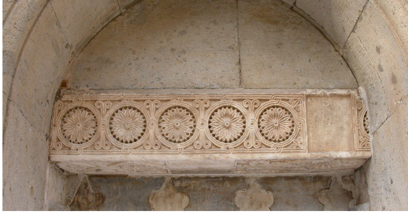
Resim 9. Konya Anonim Türbe, taçkapı lentosu, içten görünüm, templon arşitravı.

sivri) çiçek motifleri yer alır. Konya Anonim Türbe'nin taçkapısının iç yüzünde lentonun üzerinde bulunan templon arşitravı yüzeyindeki bezemeleriyle dikkat çeker (Resim 9). Arşitravın ön yüzünde çerçeveye ve birbirlerine düğümlenen beş daire ile yüzey-