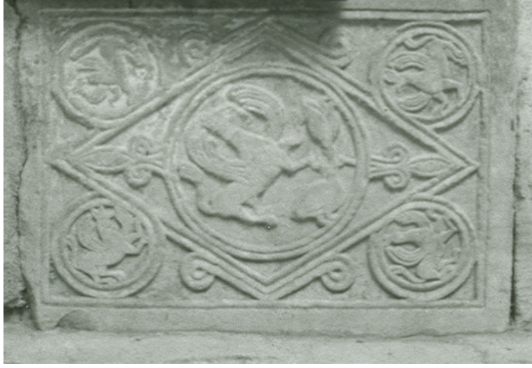
Resim 13. Atabey Ertokuş Medresesi, ana eyvan sekisi önü, korkuluk levhası 1