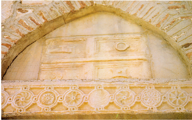
Resim 8. Yalvaç Devlethan Camii, doğu cephe, güneyden ikinci pencere alınlığı, mezar steli ve templon arşitravı.

Bu yapı dışında aynı çevrede bulunan Yalvaç Devlethan Camii'nin cephelerinde yer alan pencerelerin lentolarında ve bazı pencerelerin alınlıklarında da Bizans dönemine ait alt ve yan yüzleri bezemeli özellikle templon arşitravlarının kullanımı yoğundur (Şaman Doğan, 1997, Resim 7). Diyarbakır Ulu Camii'nde avluya açılan batıdaki kapının lentosunda, Konya'daki Anonim (1219-1220) (Resim 12), Tacü'l Vezir (1239-1240), Evhadeddin-i Kirmani (13. yüzyılın ortaları) türbelerinin lentolarında da bezemeli arşitravlar kullanılarak giriş kapılarının vurgulanması sağlanmıştır (Akok, 1969, s. 113-139; Aktaş, 1988, s. 89, 110, 205-206; Sözen, 1971, s. 29-35). Örneklerden Yalvaç Devlet Han Camii'nin doğu cephesindeki güneyden ilk pencerenin alınlığında da yüzeyi geometrik ve bitkisel bezemeli templon arşitravı dikkati çeker (Resim 7). Arşitravın yüzeyinde bir eşkenar dörtgen ile ortasında bir büyük daire, köşelerinde ortadaki dörtgene düğümlenen birer küçük daire motifi yer alır. Küçük dairelerin yüzeyi sekiz dilimlidir. Ayrıca ortadaki daireye yatay eksende yürek motifleri eklenir. Caminin doğu cephesindeki güneyden ikinci pencerenin lentosundaki templon arşitravının ön yüzünde çerçeveye ve birbirlerine düğümlenen daireler yer alır (Resim 8). Dairelerin ortasında çarkifelek ile içbükey ve dışbükey olarak dizilen çok yapraklı (bazıları yuvarlak, bazıları