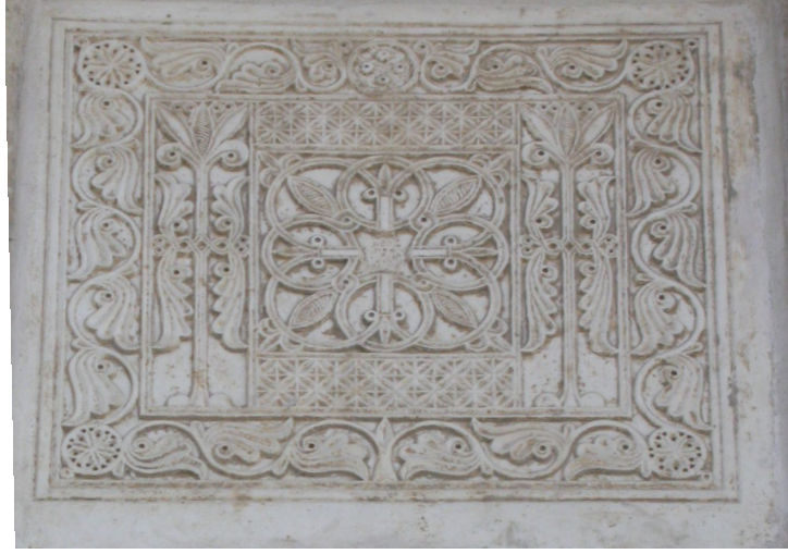
Resim 12. Konya II. Kılıç Arslan Türbesi, kuzey cephe, templon levhası.