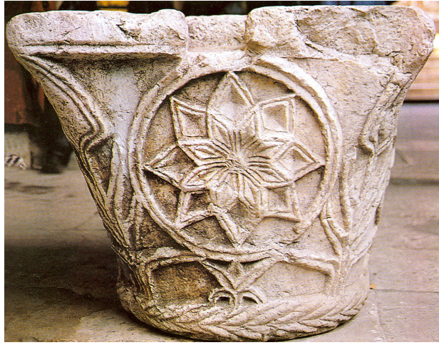
Resim 4. Eğirdir Dünder Bey Medresesi, avlu, sepet tipi sütun başlığı.

144, Resim 25c-d, 31- 31d; Şaman Doğan, 1997, s. 348, Resim 3). Bazıları Roma, çoğunluğu Bizans dönemine ait olan devşirme sütunlar genellikle korint başlıklıdır. Bunların dışında Eğirdir Dünder Bey Medresesi'nde geometrik ve bitkisel motiflerle bezeli, bazılarının köşelerine kartal figürleri işlenmiş sepet tipli sütun başlıkları da bulunmaktadır (Belke ve Mersich, 1990, Levha 124-127). Sütun başlıklarından birinde altta balıksırtı bezeli silme ve üstte kademeli silmelerle çerçevelenmiş dört yüzde daire biçimli madalyonlar ile ortasında sekiz sivri yapraklı çiçek motifleri ve köşelerde düşey yerleştirilmiş bitkisel bezemeler yer alır (Resim 4).