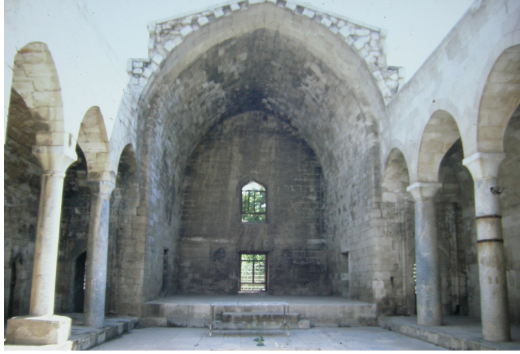
Resim 3. Karaman Hatuniye Medresesi, avlu, revak, sütunlar.

144, Resim 25c-d, 31- 31d; Şaman Doğan, 1997, s. 348, Resim 3). Bazıları Roma, çoğunluğu Bizans dönemine ait olan devşirme sütunlar genellikle korint başlıklıdır. Bunların dışında Eğirdir Dünder Bey Medresesi'nde geometrik ve bitkisel motiflerle bezeli, bazılarının köşelerine kartal figürleri işlenmiş sepet tipli sütun başlıkları da bulunmaktadır (Belke ve Mersich, 1990, Levha 124-127). Sütun başlıklarından birinde altta balıksırtı bezeli silme ve üstte kademeli silmelerle çerçevelenmiş dört yüzde daire biçimli madalyonlar ile ortasında sekiz sivri yapraklı çiçek motifleri ve köşelerde düşey yerleştirilmiş bitkisel bezemeler yer alır (Resim 4).