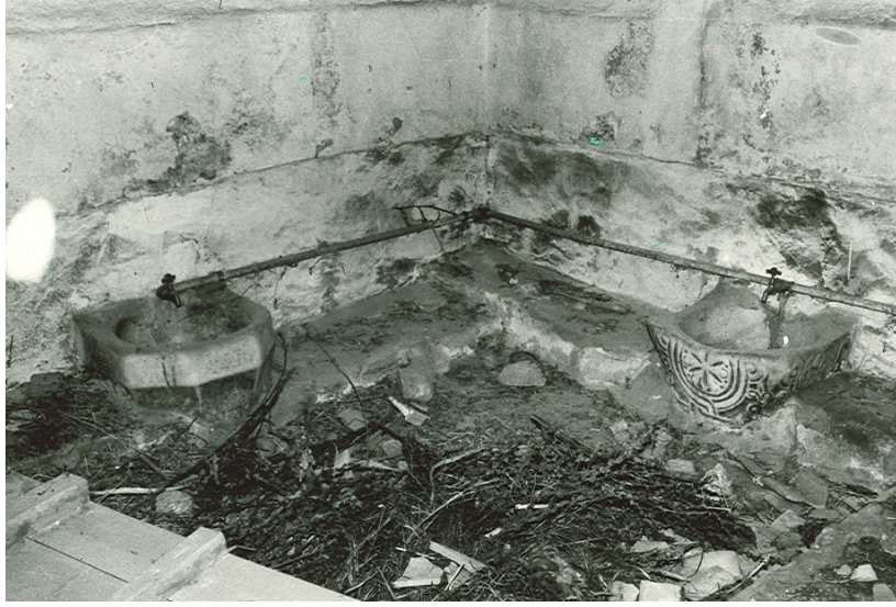
Resim 6. Barla Çaşnigir Hamamı, halvet, kurna, sepet tipi sütun başlığı.