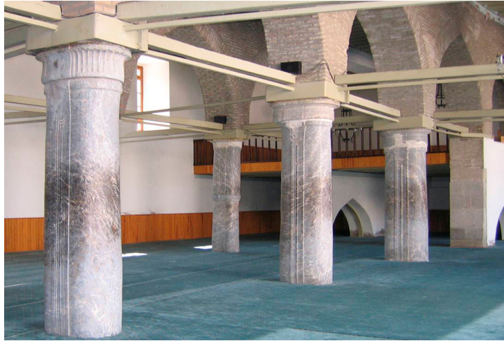
Resim 1. Konya Alâeddin Camii, harim, çift sütunlar.

Sütunların özellikle çok destekli camilerde genellikle harim ve revaklarda kullanıldığı görülmektedir. Kayseri Ulu (1205) , Konya Alâeddin Camii (1220-1221) doğu bölümü (Resim 1-2), Birgi Ulu (1322) , Antalya Yivli Minare (1373) ve Yalvaç Devlethan (14. yüzyıl) camilerinin harimi, Manisa Ulu (1366) ve Selçuk İsa Bey (1375)