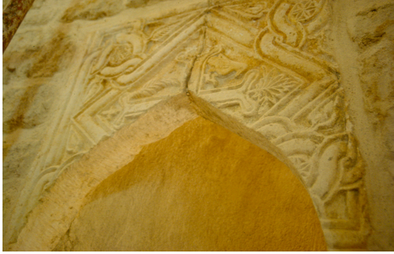
Resim 15. Atabey Ertokuş Türbesi, ortadaki kapı, içten görünüm, korkuluk levhası.