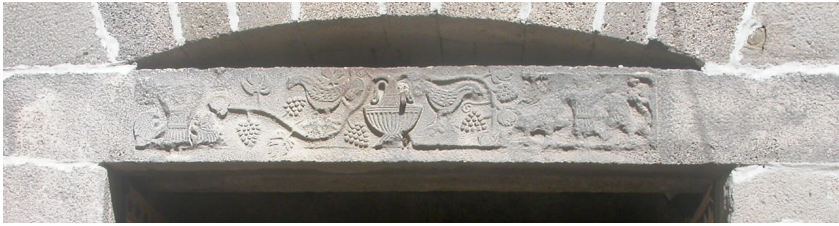
Resim 10. Diyarbakır Ulu Camii, avlu, batı giriş kapısı, arşitrav.

lerinde oniki sivri yapraklı çiçek motifleri yer alır. Ayrıca dairelerin arasında da stilize palmet motifleri bulunur. Bezemeli kısmın sağ tarafındaki kare alan boş bırakılarak kompozisyonun devam ettiği anlaşılmaktadır. Arşitravın alt yüzü de dikdörtgen çerçeveli, çerçeveye ve birbirlerine düğümlenen eşkenar dörtgenlerin yüzeyindeki oniki sivri yapraklı çiçek motifleriyle süslenmiştir (Resim 12). Özellikle Diyarbakır Ulu Camii'ndeki asma yaprakları ve üzüm salkımları ile süslü arşitravın ortasında yüksek kaideli ve dilimli gövdeli bir kaptan su içen tavus kuşları betimlenmiştir (Resim. 10). Tacü'l Vezir Türbesi'nin sövelerinde de yüzeyleri yürek motifleriyle süslenmiş templon arşitravları görülmektedir. Sivrihisar Hoca Yunus Türbesi'nde (1276) ise giriş kapısının