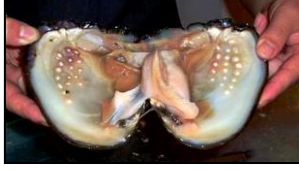
Resim 4-Diş Sırasına Benzeyen İnciler