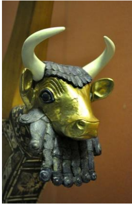
Resim 3: Boğa Liri

Benzer biçimde kadim Yunan'da boğa boynuzu, erillik özelliğini temsil etmekteydi. Boynuz, dişin sahip olduğu özelliklerin tanrı krallardaki göstergesiydi. Çünkü canlılığın devamını sağlayacak başka canlar ele geçirmek, diş ve boynuz cinsinden sert ve delici nesnelere sahip olmakla ilgiliydi. Bu nedenle mitolojide olumsuz özellikleriyle karşımıza çıkan canavar formları; iyi ve kötü tanrıların silahları (dişler, boynuzlar) ve mücadeleleri neticesinde ortaya çıkmıştır. Bu silahlar -yani boynuzlar ve dişler- dünyadan sonraki hayat için sembolik birer yardımcıdır. Dolayısıyla kutsiyet, güç ve irade sembolü olan nesnelere, kral-kraliçe mezarlarında bulunmaktadır. Britanya Müzesi'ndeki, Kraliçe Puabi'nin Mezarından Çıkarılan Boğa Liri; dünyadan sonraki hayatta iradeyi elde tutma anlayışına ve yeniden doğuşa işaretler. (Bkz.: Resim 3)