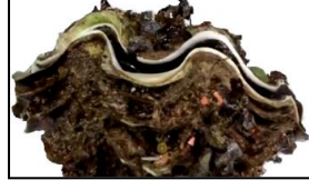
Resim 5- Giant Oyster