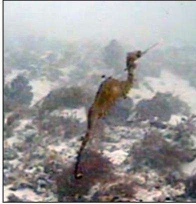
Resim 7: Yakut Deniz Ejderhası