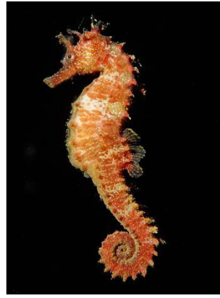
Resim 8: Deniz Atı