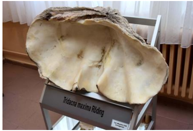
Resim 1 -Tridacna maxima Röding

Yunus Emre'nin, 13. yüzyılda ejderhayı; çatalı dili, tehdit eden dişleri ve açılan kocaman ağızıyla "insan yutucu" olarak tanımladığı nakledilir (Roux 2002: 151). Erlik tarafından yaratılmış bir canavar olan "Andalma Mongus" ise denizden dilini çıkararak insanları yakalayıp yutar (Karakurt 2011: 213). Bu insan yutuculuk özelliği, istiridyelerin/canavarların boyutlarıyla da ilgili olabilir. İstiridyeler, günümüzde kocaman boyutlarıyla pek bilinmemektedir. Yeni bulgular, devasa boyutlardaki istiridyelerin varlığını göstermekte hatta bu canlıların insanlara zarar verebilecek büyüklüklerde olduğunu gerçekçi delillerle ortaya koymaktadır: