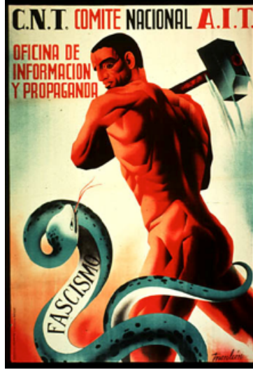
Resim 1: “Faşizm Tehlikesi” konulu propaganda afişi

“Faşizm Tehlikesi” konulu propaganda afişi Barthes’ın düzenlamında değerlendirildiğinde görsel kodlar içerisinde elinde çekiç bulunan çıplak ve kaslı bir erkeğin, büyük bir yılanı saldırdığı görülmektedir. Yılanın üzerinde İspanyolca “Fascismo/Faşizm” yazılı kodu bulunmaktadır. Yılan, kendisine doğru saldıran erkeğe karşı savunmaya geçmiş ve sunum kodları içerisinde erkeği tehdit edersine üzerine saldırmıştır.