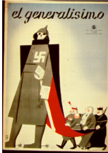
Resim 4: “General Franco” konulu propaganda afişi

“General Franco” konulu propaganda afişinde Barthes’ın düzenlamı boyutunda, devasa boyutta asker kıyafetleri içerisinde bir kuru kafanın ve kuru kafanın pelerininin tutan üç kişinin olduğu görülmektedir. Kuru kafanın hemen üstünde İspanyolca olarak “El generalísimo/ başkomutan” yazılı kodu yer almaktadır. Devasa boyutta bir kılıç ve miğfer görsel kodlar içerisinde kuru kafalı askere konumlandırılmıştır. Askerin, sol göğüs kısmında da devasa boyutta beyaz bir gamalı haçın yer aldığı görülmektedir. Askerin başındaki miğfer, İspanyol ordusunun o dönem kullandığı miğferlerden değildir. Daha çok 19. yüzyılın sonlarında ve 20. yüzyılın başlarında Alman subaylarının giymiş olduğu dik çubuk başlı miğferi temsil etmektedir. Askerin pelerininin tutan kişiler ise, sunum kodları içinde yer alan giysiler ile bir askeri, bir iş adamını ve bir din görevlisini temsil etmektedir.