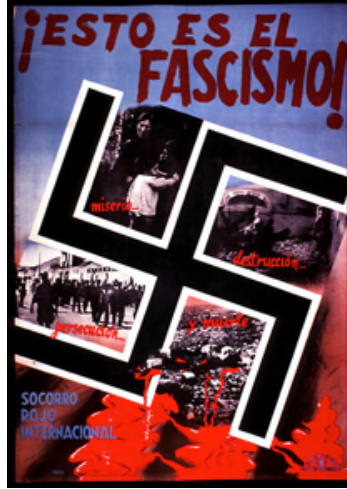
Resim 3: "Faşizm'in Tanımı" konulu propaganda afişi

fotoğraflara yer verilmiştir. Propaganda afişinde gerçek fotoğraflar kullanılarak, propagandanın inandırıcılığının artırılması amaçlanmıştır.