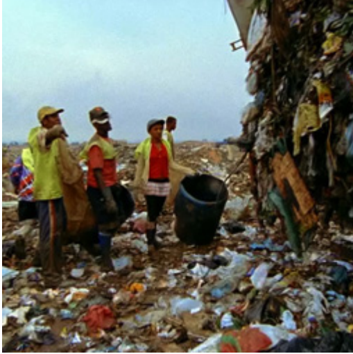
Görsel 6. Vik Muniz, Çöplerin Resimleri serisi çalışma süreci ve çalışmaya katılanlar, 2009, Rio.

ise portrelere hayat veren ve portreleri oluşturarak katkı sağlayan çöplükte çalışanlara başlanmıştır. Aynı zamanda, çalışma süreci ve sonucu, çalışmanın, katılımcılar üzerindeki etkisini gözler önüne seren Wasteland (Çöplük) adında Yönetmenliğini Lucy Walker'ın yaptığı bir belgesel filmle belgelenmiştir ("Waste Land", 2010).