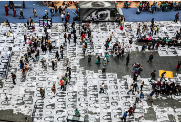
Görsel 3. JR, New York Şehrinin Ters yüzü (Inside Out New York City), 22Nisan-10 Mayıs, 2013.

JR ve ekibinin çalışmalarından örnek olarak New Yorkluları ve şehre gelen misafirleri, kendi portre fotoğraflarını çekmek üzere davet ettikleri çalışmalarından bahsedilebilir (Görsel 3). Çalışma esas olarak 'burada' bulunma ve 'bu anda' olma ile ilgilidir. Times Meydanında bulunan kişilerden fotoğraflarını çekmek için izin istenir. Fotoğrafi çekilen kişilerin portrelerinin baskısı bir kaç dakika içinde katılımcılara verilerek, yine katılımcılar tarafından Times Meydanı'nın zeminine yapıştırılmıştır. Projenin amacı, her bir portre sahibinin kendi yüzüyle dünyaya mesaj vermesidir. Görselde ele alınan ve sanat çalışmasını gösteren fotoğrafın alındığı internet sitesi, görselde en önde duran kadının blog sayfasıdır (Görsel 4). Çalışmaya katılımcı olarak katılan kadının fotoğrafının altında yazan yazı "Times Meydanı'nın bir parçası oldum" şeklindedir. Projenin, katılımcıların her birinin görünür olarak, bir bütünün parçası haline getirmesini sağladığı, bu sözlerden de anlaşılabilir (Zimmer, 2013).