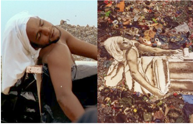
Görsel 7. Vik Muniz, Çöplerin Resimleri serisinden, 2009, Rio.

Amerikalı sanatçı Helen Harvey de, 2008 yılındaki Whitney Binal'inde 15 dakikalık seanslar boyunca, toplamda 100 ziyaretçinin portresini çizmiş, aynı zamanda da oluşturduğu sorulara, ziyaretçilerin kendi el yazılarıyla, cevaplar vermesini sağlamıştır (Görsel 8, 9). Sorularda, kişisel bilgilere dayalı sorular olmasıyla birlikte, kişinin portresini beğenip beğenmediğini, portresi çizilirken sıkılıp sıkılmadığı gibi sorular bulunmaktadır. Portre ve soru-cevaplar Park Avenue Armory'de sergilen-