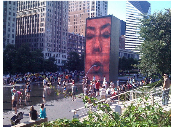
Görsel 2. Jaume Plensa, Taç Çeşmesi (Crown Fountain), 2004, Şikago.

re yapılan bir yarışma sonucunda birinci gelerek, parkta yerini almıştır. Taç Çeşme, bulunduğu yer olan Şikago'daki meydana ve çevresinde yaşayan insanların portrelerinden oluşmaktadır. İspanyol heykeltıraş Jaume Plensa tarafından tasarlanmış, Krueck ve Sexton tarafından hazırlanan çalışmanın, aynı zamanda, bir meydana fiziksel olarak toplumun buluşmasını sağlayarak, kamusal bir mekân yarattığı kabul edilebilir (Plensa, web, 2004). Çalışma bir çeşmedir ve böylelikle geleneksel Türk kültüründe de bulunan çeşme başı muhabbetleri gibi deyimlere de yol açan, meydanlardaki çeşmelerden yola çıkılmıştır. Eskiden bir iletişim alanına dönüşebilen çeşmelerin 21. Yüzyıla uyarlanmış hali olarak bile kabul edilebilir