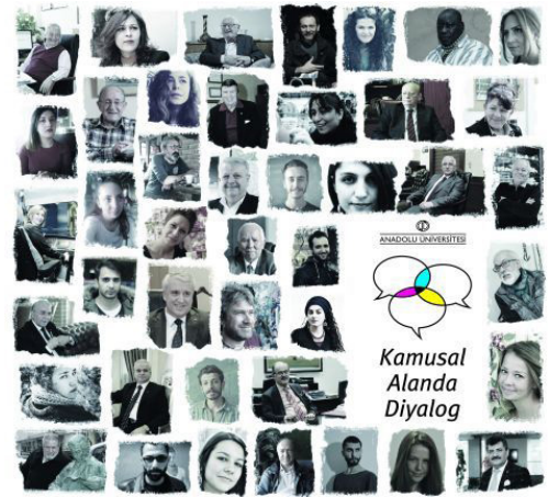
Görsel 15. Portreleri çalışan 19 kişi ve portreleri çalışılan 24 kişinin portre fotoğraflarının yer aldığı Kamusal Alanda Diyalog Sergisi Katalog Kapağı, Tasarım: Utku Tan Çağlan.

rencileri ve öğretim elemanlarından oluşan 19 kişi, Eskişehir'de yaşayan, şehre katkı sağlamış ve bir şekilde Eskişehir'e mal olmuş olan 24 kişinin portre resimlerini yapmış, portrelerden oluşan bir sergi hazırlanmış ve sergi sonunda portreler asıl sahipleri olan, portreleri yapılan kişilere hediye edilmiştir. Buradaki asıl önemli konunun ise, bütün bir sürecin aslında birer nesne olan tuval resimlerine odaklanması değil, resim sanatı aracılığıyla ilişkiler yaratılmasına odaklanması olarak tanımlanmaktadır.