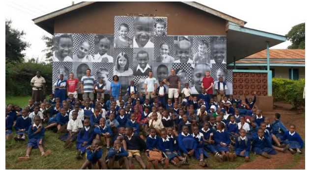
Görsel 5. JR, Kilimanjaro'da Eğitimin Önemi (24 portre, 2014), Kilimanjaro