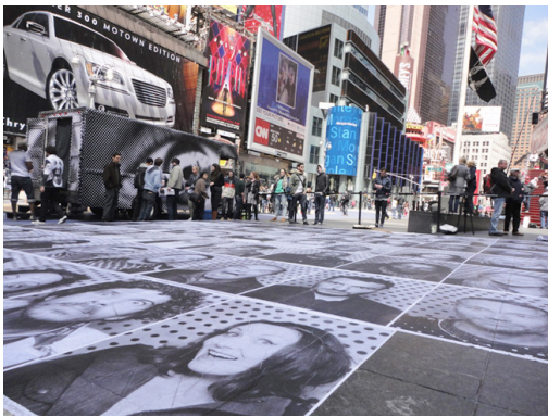
Görsel 4. JR, New York Şehrinin Ters yüzü (Inside Out New York City), 22Nisan-10 Mayıs, 2013.