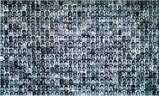
Görsel 1. Bai Yiluo, İnsanlar No: 1 (People No. 1), photogram 2, 50 x 500 cm, 2001.

Yiluo'nun çalışmasından anıtsal bir heykel olarak bahsedilirken, onun geleneksel kamusal sanattaki anıtsal heykellerde rastlanan mekânsal ve nesnel özelliğini vurgulamaktan öte, ilişkilerin heykeller yerine geçebildiğinden bahsedilmektedir. Bu durum Beuys'un Sosyal Heykeli'yle ilişkilendirilebilir.