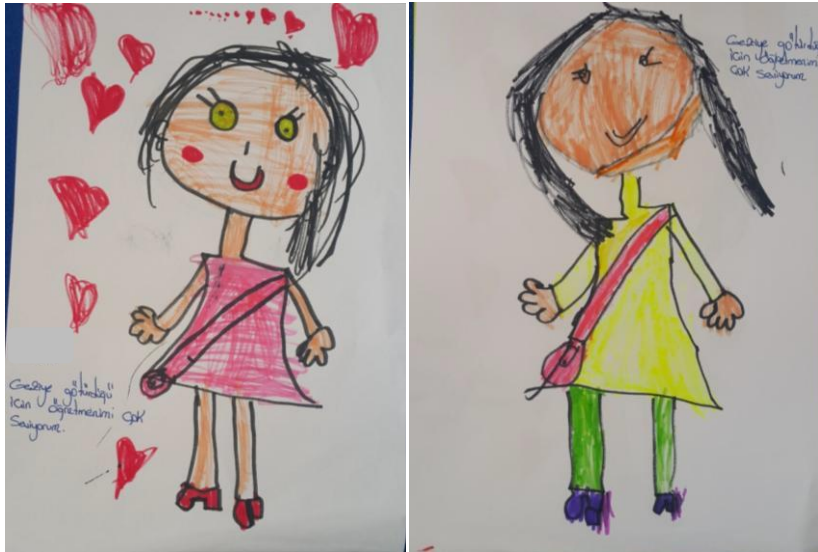
Görsel 2: öğretmenimi seviyorum çünkü.. etkinliği, katılımcı çalışmaları

Görsel 2 de görülen çalışmalarda katılımcıların öğretmenin saçına, makyajına, kıyafet ve ayakkabı modeline dikkat ettikleri görülmektedir. Araştırmacı notlarında ilgili olarak şu ifadeler yer almaktadır: 'öğrenciler öğretmenin kıyafetleri, çantası takıları gibi birçok özelliğine dikkat ederek resimlerinde temsil ediyor (öğretmenimi seviyorum çünkü... etkinliği, araştırmacı notu, 12.03.2018).'