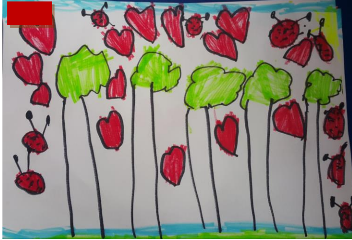
Görsel 5: orman- resim yarışması etkinliği, katılımcı çalışması

Toplanan verilerde görülen doğa unsurları ağaç, kelebek, bulut vb. elemanlardır. Yapay elemanlar ise insan tarafından yapılmış olan her türlü eşya ve yapıyı kapsamaktadır. Beş yaş grubu çocukların doğa unsurlarını daha sık resimlerinde tekrar ettikleri görülmektedir.