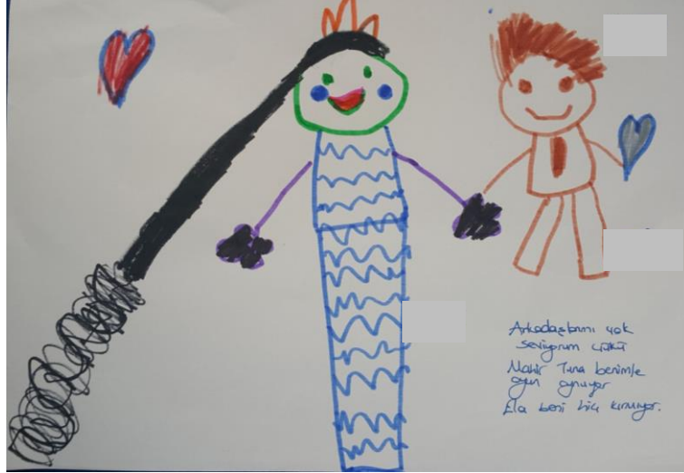
Görsel 6: arkadaşımı seviyorum çünkü... Etkinliği, katılımcı çalışması

Çocukların anne baba ve diğer aile bireylerini sanat çalışmalarında temsil etmekten hoşlandıkları ve sık sık resimlerine yansıttıkları görülmüştür. Bununla birlikte sınıftaki arkadaşlarını ve öğretmenlerini de sık sık resimlerinde çizdikleri bulgular arasındadır. Sanat çalışmalarında aile bireyleri ve diğer tanıdıkları haricinde çocuğun kendisini çizdiği 11 sanat ürüne rastlanmıştır.