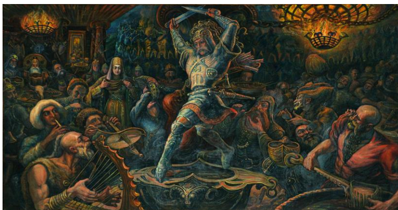
«Пире нартов» - М. Туганов

О мифологическом наследии древности с его особым способом миропонимания свидетельствует коллективное участие в съезжих праздниках, специально устраиваемых для юношей и девушек, достигших брачного возраста. Показательным примером являлся праздник в селении Дзывгъис ( Дзывгъисы дзуары къуыри ), куда съезжались до четырехсот юношей и девушек для участия в массовых танцах ( хъазт ). Культовый аспект осетинских народной хореографии подкреплен их устойчивой распространенностью в обрядовой культуре, поскольку танцы всегда являлись неотъемлемым компонентом праздничных ритуалов. «Как и другие элементы празднества, они символизировали и реализовывали форму воображаемого контакта с небесной добродетелью и обеспечивали успех всего общества» (Uarziati, 2007: 177]. Для организации подобных празднеств устраивались специальные площадки для танцев «Симды фæз» («Поле для симда») близ святилищ. Подобный принцип пространственной организации предполагал обеспечение особой благодати небесных покровителей для участников ритуального действия.