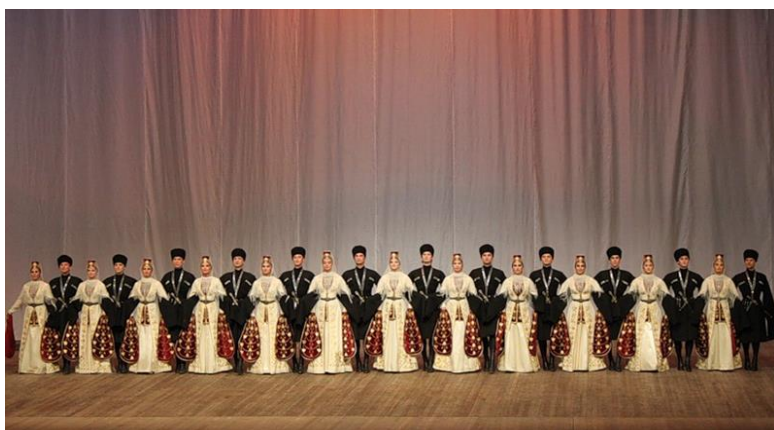
Танец Симд - Государственный Академический Ансамбль Танца "Алан"