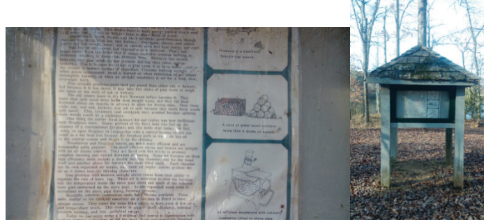
Şekil 9. Oconee kent ormanı hakkında bilgilerin yer aldığı tanıtım yapısı (kiosk) (2015)