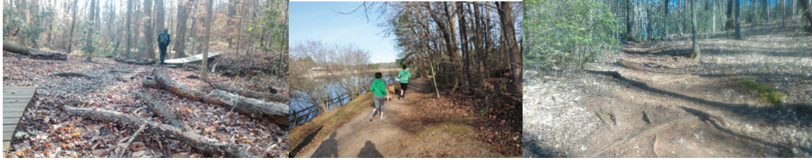
Şekil 7. Yürüyüş parkurları ve dağ tırmanışı izleri (2015).

Bisiklet kullanıcıları kendilerine kapalı olan dağ yürüyüşü parkurlarının dışında, sadece kendilerine ayrılan yollarda sürüş yapmalıdır. Diğer alanlarda koşu ve yürüyüş ve tırmanış yapılması için orman alanı temizlenmiş ve doğal görünümü bozulmadan budamalar yapılmıştır. Alanda yaşlı ve kuru kütükler biyolojik zenginliğin sağlanması, böcek ve kuşların barınağı olması açısından alınmamaktadır. Orman alanında güvenliğin sağlanması ve bireysel yürüyüşlerin yapılabilmesi için patikalar oluşturulmuştur. Aynı zamanda kişilerin kendilerinin yeni patikalar keşfedebilmeleri, kendi sınırlarını zorlayarak deneyimler edinebilmeleri için de orman alanında izler yaratılmıştır (Şekil 7).