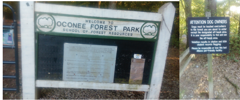
Şekil 3. Alanın girişinde yer alan kurallar (2015).

Oconee kent ormanı, Georgia Üniversitesi Warnell Orman Kaynakları Bölümü ne bağlı olarak Daniel B. Warnell tarafından yönetilmektedir. Alan yaklaşık 100 yaşındaki yaşlı doğal ağaçlardan oluşan ormanlık alan olup, UGA golf sahasının yakınında yer almaktadır. Alanın girişinde park kuralları ve gerekli uyarılar yazılmıştır (Şekil 3).