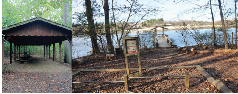
Şekil 5. Korunaklı piknik alanı ve egzersiz aletleri (2015).

Korunaklı piknik alanı ilk gelen esasına göre, grup veya bireysel olarak kullanılabilir. Alanda 3 piknik masası, 1 çöp kutusu, bir çeşme ve doğal malzemelerden oluşturulan egzersiz tahtaları bulunmaktadır (Şekil 5).