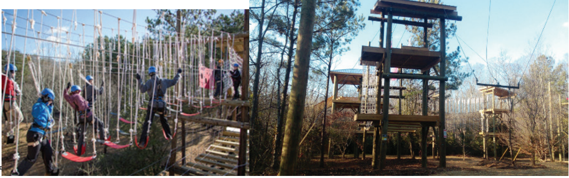
Şekil 12. Eğitmen eşliğinde yapılan Challenge kursu *(URL 4) ve alanı (2015)

Alan, Georgia üniversitesi tarafından organize edilen performans kursu için kullanılmaktadır (meydan okuma kursu=UGA Challenge). Bu kursa gençler katılarak yeteneklerini geliştirebilir ve yaşam performansını artırabilir (Şekil 12).