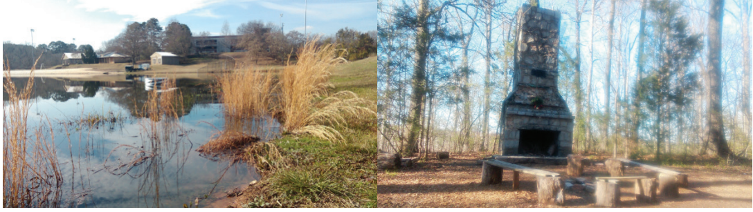
Şekil 4. Oconee Forest Park kullanım alanları (2015)

Günümüzde orman alanında yer alan aktiviteler, kullanım olanakları ve donatılar şunlardır: Göl, yürüme ve bisiklet yolu, piknik masaları, spor aletleri, doğal bitki örtüsünün tanıtımı, açık doğal çayırılık alan, doğal bitki örtüsüne ait çiçekler (Şekil 4).