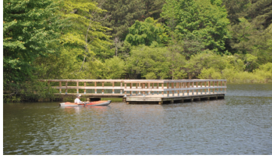
Şekil 8. Herrick Gölü'nde kano yapan bir kullanıcı (2015).

Göl alanı, 60702.85m 2 dir. Orman fakültesinin eski dekanının adı verilen göl, üniversite öğretim elemanlarına ve öğrencilere balık avlama olanağı sağlamaktadır. Göl plajı (Herrick beach) 1 Mayıs işçi bayramı (Labor Day) ile, Mayıs ayının son pazartesi olan önceki savaşlarda yaşamını yitirenlerin anıldığı (Memorial Day) günler arasındaki sürede kullanıma açıktır. Kano kiralama saati ve bilgileri için rekreasyon sporları bölümünün aranması ve randevu alınması gereklidir (URL2). Alanda doğal bir eğim vardır ve yağmur sularının akışı kolaylaştırılmış, dere iyileştirme yapılarak tüm yağmur suları ile göl havzası oluşmuştur. Göl biyolojik çeşitliliği zenginleştirmekte ve spor olanağı sağlamaktadır (Şekil 8).