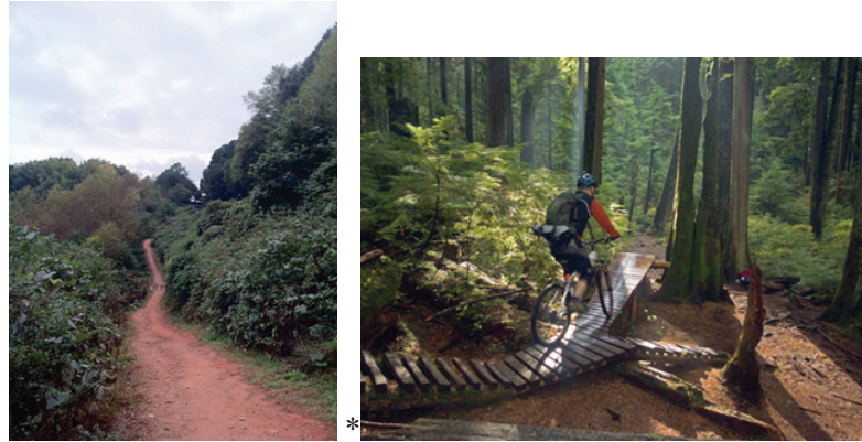
Şekil 6. Dağ bisikleti yolu (2015) * (URL3).

Oconee kent ormanı, zengin bir yaban hayatına ev sahipliği yapmaktadır. Gölet ve çevresi, birçok kuş, memeli ve diğer hayvanların sığınağıdır. Alana gelenler bunları tanıma olanağı bulmakta ve doğa içinde farklı bir çok faaliyet yapabilmektedirler. Dağ bisikleti bunlardan biridir. Bisiklet ile doğada macera yaşamak isteyenler için özel ayrılmış bir yol tasarlanmıştır (Şekil 6).