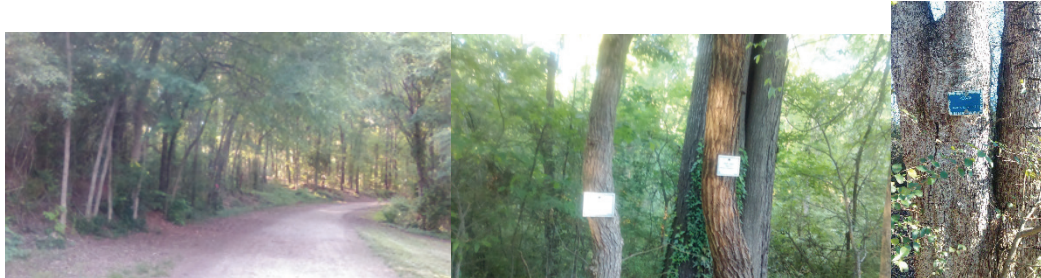
Şekil 11. Orman alanındaki etiketli ağaçlar (2015).

Orman alanında ağaç ve çalılarla çevrelenmiş parkurlardaki bitkiler tanıtım amacı ile etiketlenmiştir. Mavi isim etiketleri, ağaca veya bitişik metal bir direğe bağlanır. Tanıtım alanlarında yer alan broşürde alan haritası üzerinde bu ağaç numaraları yer alır, her bir bitki numunesinin yaklaşık yeri de broşürde belirtilir. Bu bilgilere alana gelmeden ulaşmak isteyenler üniversite web sayfasından broşürü daha önce indirerek ulaşabilir ve ağaçları alanda yerinde tanıyabilir (Şekil 11).