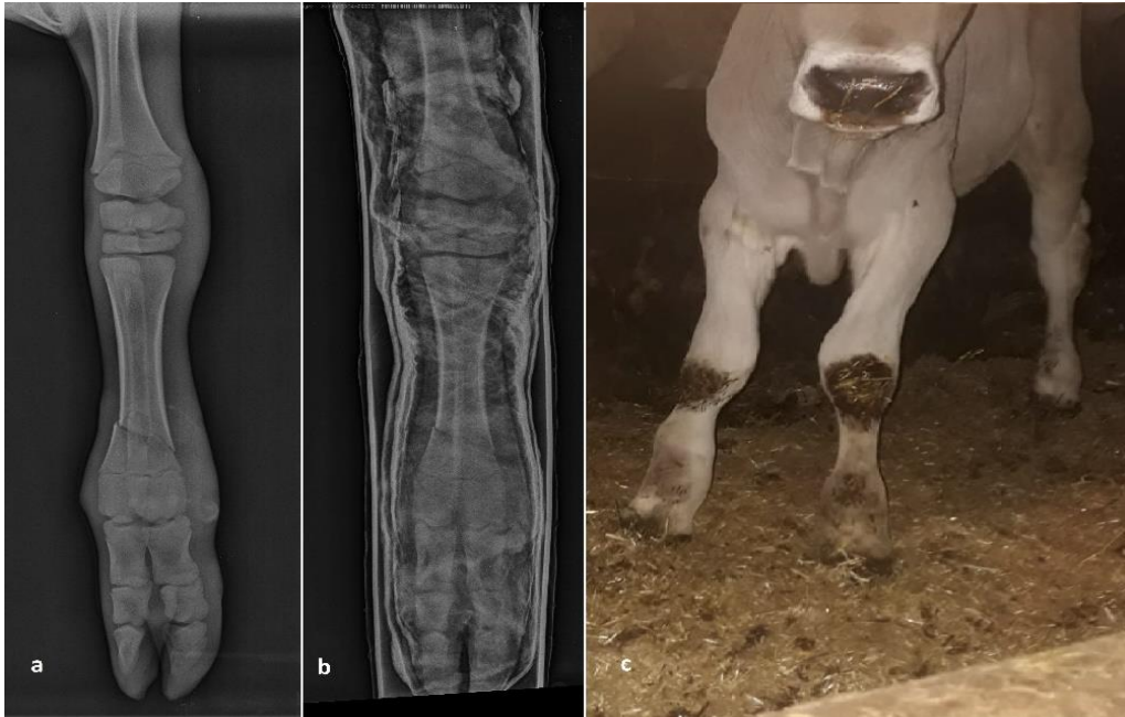
Şekil 2. Bir olguda oblik diyafizer metakarpal kırığı (a) ve PVC destekli alçılı bandaj ile tedavisi (b). Postoperatif 60. gün görünümü (c) (Olgu no=24).