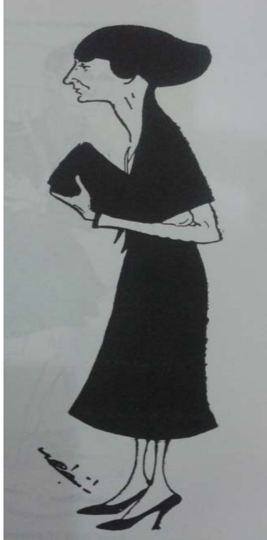
( Akbaba , 25 Haziran 1923, s.4.)