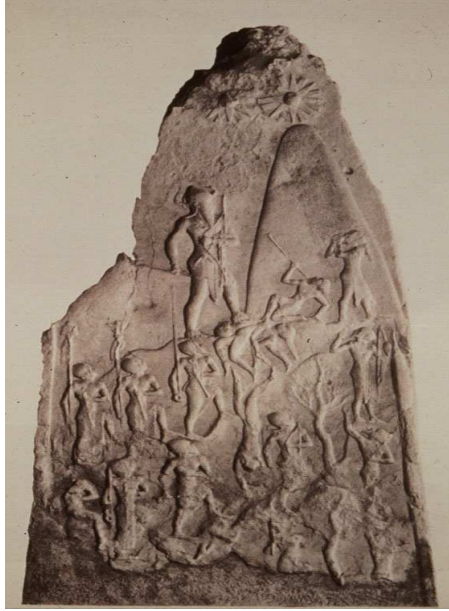
Naram-Sin, Zafer Dikilitaş, M. Ö.. 2300-2200