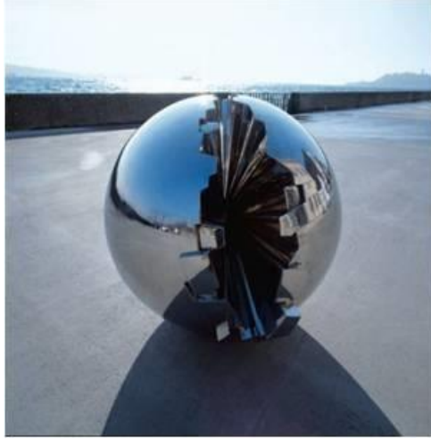
R.15. F. Özşen, “Ay Tanrıçası”.

”Dokuz aylık hamile bir kadının karnına dokunmuştum, cam gibi parlak,sert, sıcak ve küresel, bu doğa harikası, içindeki varlıkla birlikte beni çok etkiledi. Hamile kadınlar çizdim. Heykeller yaptım. Giderek kollar ve bacaklar yok oldu. Küre salt bir biçim olarak elimde kaldı. Üreme ve bereket sembolü olarak kullandım onu. Tıpkı Ön Asya'nın mutlak bereket tanrıçası Kibele gibi. Sonradan yaptığım seriye de "Kibele Serisi" dedim”. ( http://www.istanbulmodern.org/tr/sergiler/gecmis-sergiler/bellek-ve-olcek_80.html )