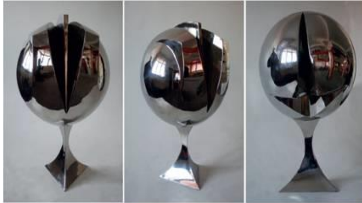
R.16. F. Özşen, “Venüsün Doğuşu”. (Günyaz, A. Heykel Sanatı ve Ferit Özsen. s.4-6. ).

Sanatçı, Venüs temasını da aynı form anlayışıyla yorumlamıştır. (R.16)