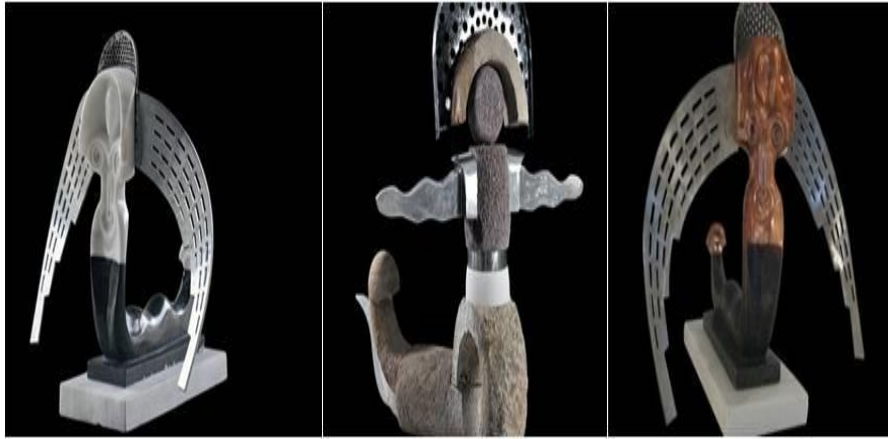
R.11. M. Aksoy, “Şahmeranlar”. (Yılan Hikâyeleri. (2010). Mehmet Aksoy Heykel Sergisi 21 Ekim 2010, Perşembe - 4 Aralık 2010, Cumartesi. http://www.evin-art.com/exhibitions/98-serpent-tales-mehmet-aksoy-sculpture-exhibition

Mehmet Aksoy ‘Modern Heykel-Bellek ve Ölçek’ sergisiyle ilgili düzenlenen bir söyleşide, çalışmaları hakkında şunları ifade etmiştir: “Üzerinde yaşadığım coğrafyanın geçmişi ve bugününü buluşturan büyük boyutlu heykeller ve anıtlar gerçekleştirdim. Doğurganlık ve bereket tanrısı Kibele’nin izini sürdürdüm ve Şahmeran’ın katilini betimledim. Mitoslarla, hayal dünyamı kendime özgü tarzda dile getirmeye çalıştım” (Çınar, G., 2006; Antmen, 2006: 135-136.) Ve adına yapılan sergiden daha detaylı bilgiler edinilmiş ve çalışmaları görsel olarak verilmiştir (R.11-12). (Yılan Hikâyeleri, Mehmet Aksoy Heykel Sergisi 21 Ekim 2010, Perşembe - 4 Aralık 2010, Cumartesi 2010).