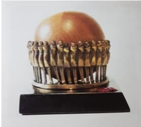
R.9. B. Mavitan, “Ay Gibilere Anıt”. (Mavitan, 2004: 7).

Ayrıca sanatçının çalışmalarında, üç boyutlu evrenin bir arayışını cisimlendirme gayretini görmek mümkündür. Adeta kozmik müziğin tınısını, üslupla, biçimle aktarmak istemiştir. Özellikle evrende yalnız insanı sorgular. Zaman onun için bir yanılısamadır. Düş gezginliğidir. (R.9) (Mavitan, 2004: 6).