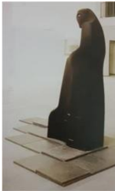
R.2. R. Aksungur, "Büyük Soruşturucu". (Çınar, 2006: 61).

Sanatçının bazen otururken, bazense ayakta betimlenen, insan ve mitos karışımı eserler yaptığı bilinmektedir. Örneğin "Büyük Soruşturucu" yapıtı, bu bağlamda önemlidir. Onun bu heykelinde, sanki insan, kuş karışımı bir figür meydana getirilmiştir (R.2) (Antmen, 2013: 60-61; http://www.istanbulmodern.org/tr/sergiler/gecmis-sergiler/bellek-ve-olcek_80.html ).