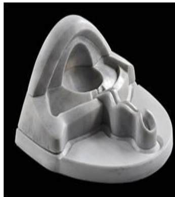
R.12. M. Aksoy, “Şahmeran’ın Gözyaşı” (Yılan Hikâyeleri. (2010). Mehmet Aksoy Heykel Sergisi 21 Ekim 2010, Perşembe - 4 Aralık 2010, Cumartesi. http://www.evin-art.com/exhibitions/98-serpent-tales-mehmet-aksoy-sculpture-exhibition