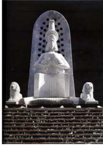
R. 13. M. Aksoy, “İş Bankası kule avlusuna dikilen Kibele heykeli”. (Engin, 2009: 64-65, 463).

Kibele çalışmalarını da severek yapan sanatçı şunları söylemektedir: “Kibele ve aslanlarını yapacağım. Aslanları iyice inceledim, Hitit’ten Asur’dan falan”. (R.13-14) (Engin, 2009: 366-67).