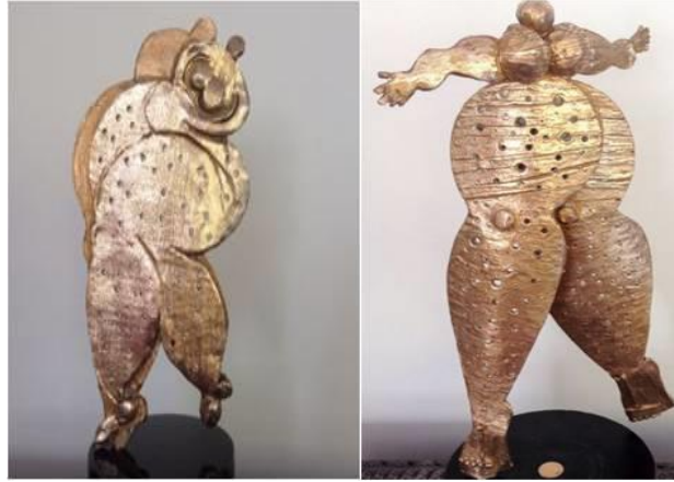
R.18. E. Behar, “Kibele’den Sinderalla’ya” Serilerden Örnekler

Yakın dönem sanatçılardan birisi de Eti Behar’dır. Sanatçının “Kibele’den Sinderalla’ya” isimli özel bir serisi bulunmaktadır.( R.18 ). ( https://gallerymak.com/tr/sanatci/eti-behar/41/ )