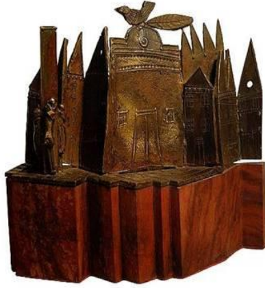
R.8. B. Mavitan, “Kuşlu Masal Manzarası” (Çınar, G. 2006)

Ayrıca sanatçının çalışmalarında, üç boyutlu evrenin bir arayışını cisimlendirme gayretini görmek mümkündür. Adeta kozmik müziğin tınısını, üslupla, biçimle aktarmak istemiştir. Özellikle evrende yalnız insanı sorgular. Zaman onun için bir yanılısamadır. Düş gezginliğidir. (R.9) (Mavitan, 2004: 6).