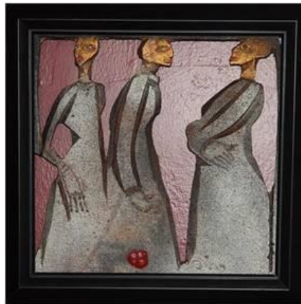
R.10. B. Mavitan, “Sohbet” Bu çalışma sanatçının, mitolojideki “Üç güzelleri” (Hera, Athena ve Afrodit) akla getirmektedir (Mavitan, 2004: 7).