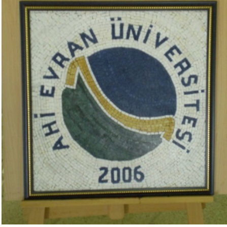
Resim: 6- Ahi Evran Üniversitesi Logosu (Opus musivum) (G. Ekinciöğlü, 2017)