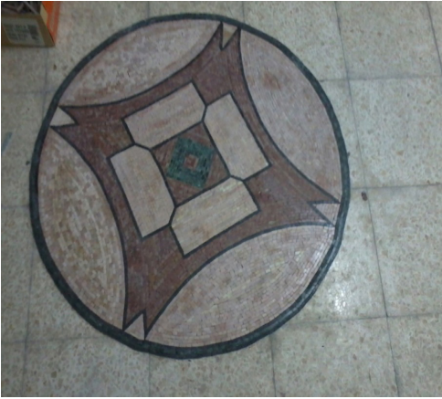
Resim: 8- Mozaik Madalyon (Opus Tessellatum ve Opus Circumactum) (G. Ekinciöğlü, 2017)