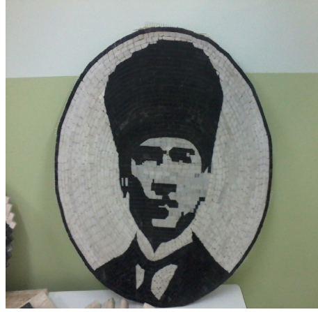
Resim: 7- Mustafa Kemal Atatürk silüeti (Opus Classicum ve Opus Verbiculatum) (G. Ekinciöğlü, 2017)