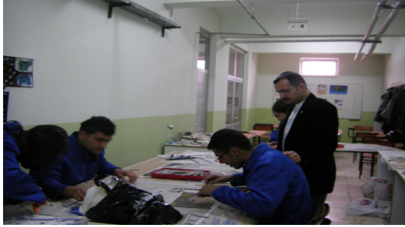
Resim: 4- Kaman MYO öğrencilerinin uygulamalarından görünüm

İnsanı eğitmede veya biçimlendirmede güzel sanatların çok önemli bir yeri olduğu gibi insanları birleştirici ve kaynaştırıcı özelliği de vardır. Bu çalışma kapsamında öğrencilerde doğal taş sanatı ve tarihi aracılığı ile sanata karşı ilgisinin artırılması amaçlanmış olup Anadolu kültür ve sanat tarihinde önemli bir yer tutan mozaik sanatının yaşatılması adına Ahi Evran Üniversitesi Kaman Meslek Yüksekokulu Mozaik Kulübü öğrencilerinin yapmış olduğu eserler paylaşılmaya çalışılmıştır (Resim 4-5).