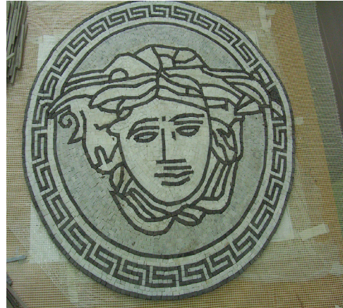
Resim: 9- İndirekt teknikle yapılan Medusa Başı Çalışması (Opus Classicum ve Opus Verbiculatum) (G. Ekinciöğlü, 2017)