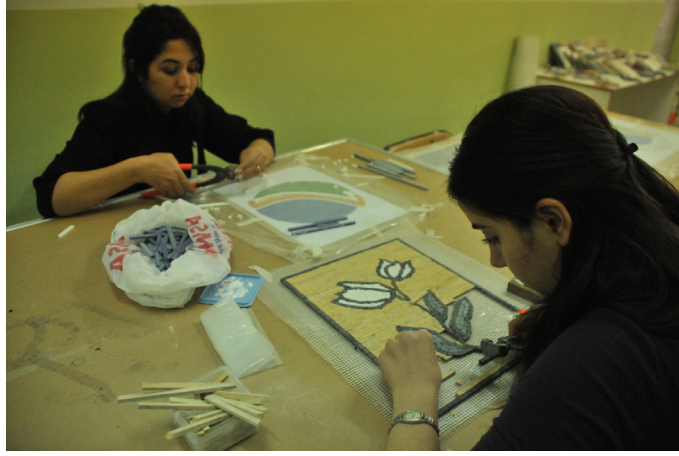
Resim: 5- İndirekt teknikle yapılan uygulama (G. Ekincioglu, 2017)

Kırmızı ve mavi doğal taş bulunması zorluğu nedeniyle yapay renklendirilmiş polyester esaslı malzemeler haricinde çalışmalarda yurdumuzun farklı bölgelerinde üretilen doğal taşlar kullanılmıştır. Ahi Evran Üniversitesi logosunun gökyüzünü simgeleyen üst kısmında mavi polyester esaslı yapay malzeme, orta kısmındaki Ahi Evran Veli'nin kuşağını temsil eden bölümde sarı renkli ve alt kısımda yeryüzünü temsil eden bölümde yeşil renkli doğal taşlar kullanılmıştır (Resim 6). 6