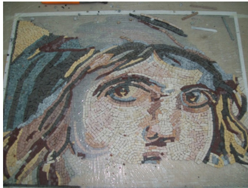
Resim: 10- Zeugma çingene kızı (Opus Classicum ve Opus Verbiculatum) (G. Ekinciöğlü, 2017)