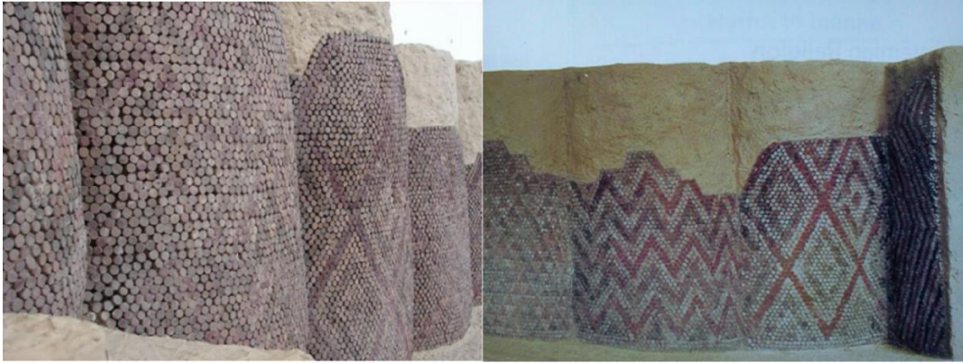
Resim: 1- Sümer Dönemi'ne ait öncül duvar mozaği örnekleri ( http://cargocollective.com/klink/History-Cone-Mosaic-Mesopotamia )

Mozaik sanatının tarihsel gelişimine bakıldığında, bu teknikte bilinen en erken örnekler M.Ö. 4. ve 3. binli yıllara tarihlenen Mezopotamya'da yer alan Uruk-Warka ve Al Ubaid adlı Sümer kentlerinde rastlanmıştır (Uğur, 2011, s. 43; Dunbabin, 1999). Pişmiş topraktan yapılan ve çiviye andıran huni biçimli parçaların görece sivri kısmının uygulama yapılacak alana yassılaştırılmış kısmın ise dekorasyonu tamamlamak amacıyla üstte kalacak şekilde yerleştirilmesi ile oluşturulan bu mozaik tekniği duvar mozaiklerinin öncüsü niteliğindedir. Kullanılan motifler çanak çömlekler ve mühürler üzerinde de uygulanan geometrik motiflerden oluşmuştur (Resim 1).