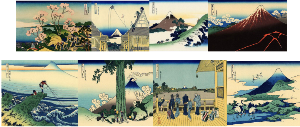
Resim: 12 OtuzaltıFuji Dağı Serisi'nden Resimler 1830'lar https://tr.wikipedia.org/wiki/36_Fuji_Dağı_Manzarası_(Hokusai) .