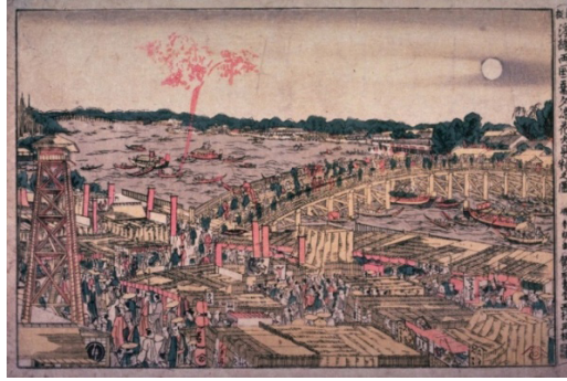
Resim: 5 Ryogoku köprüsünde serin bir yaz akşamı havai fişek izlerken, ahşap baskı,1780–1790 ( https://ukiyo-e.org/image/famsf/5050161212710081 ).