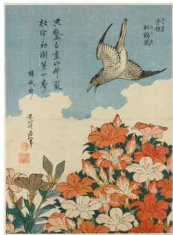
Resim: 1 Guguk Kuşu ve Azaleas, ahşap blok baskı, 1828( https://www.pinterest.com/banksothecreeks/hokusais-birds-flowers ).

“Modern olma” anlamı da taşıyan Ukiyo-e, Edo döneminde ortaya çıkan bir resim sanatı türüdür. Fani Dünya Resimleri anlamına gelen Ukiyo-e, günlük yaşamdan sahnelerin de konu alındığı, döneminin çağdaş resmidir. Konularını yerel efsanelerden, dinden, edebiyattan, şiirden, imparator ve ailesi ile ilgili hikayelerden, geleneksel Japon tiyatrosundan, Kabuki aktörlerinden ve yaşamın akışından alır. Klasik Japon resminin üstüne kültürel öğeleri ve günlük yaşamdan parçaları ekler. Peyzaj konuları da bu yeni tarza göre biçimlenir. Eski tip elle boyanan Japon kitaplarının içinde ve kapaklarında da kullanılan Ukiyo-e tarzı, genellikle renkli ahşap bloklarla baskı şeklinde uygulansa da, akımın ilk dönemlerinde fırça ile suluboya etkisi veren Ukiyo-e resimleri de bulunmaktadır. 17. yy’dan 19. yy’a kadar Japon kültüründe bir tür eğlenceye dönüşen Ukiyo-e tarzında resimlenmiş kitaplar ve resimler görsel kültürün yaygınlaşmasında önemli bir rol üstelenir (Resim 1-2).