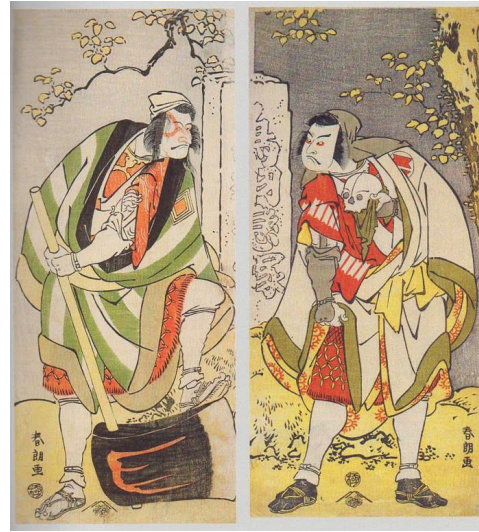
Resim: 4 Sakata Hangoro III, gezgin bir rahip olarak, renkli ağaç baskı, 31.4 x 14.2 cm. 1791. Boston Güzel Sanatlar Müzesi. (Paget, 2018, s.9).

Kariyerinin erken dönemlerinde çocukları için oyuncaklar tasarlar. Diaroma denilen üç boyutlu manzara modelleri ve içinde küçük peyzajların olduğu masa oyunları yapar. 1793'te Shunshō'un ölümünden sonra, Fransız ve Hollandalı sanatçıların bakır gravürlerinden gördüğü Avrupa stillerini ve diğer sanat tarzlarını keşfetmeye başlar. Daha sonra Ukiyo-e'nin geleneksel konuları olan oyuncuların ve aktörlerin görüntülerinden uzaklaşır. Bunun yerine, çalışmaları çeşitli sosyal düzeylerden Japon halkının günlük yaşamının manzaralarına ve görüntülerine odaklanır. Bu değişim, ukiyo-e ve Hokusai'nin kariyerinde önemli bir dönüm noktasıdır. Ryōgoku Köprüsündeki Havai Fişekler (1790), Hokusai'nin yaşamının bu döneminden kalmadır (Resim 5).