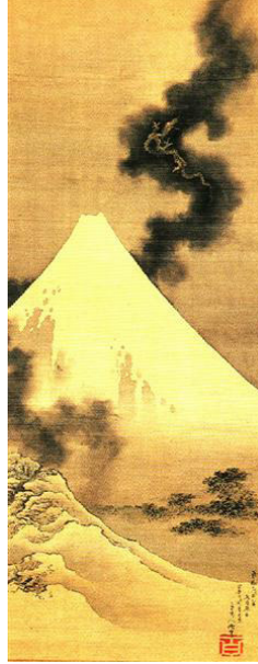
Resim: 14 Fuji Dağı'nın Üstünde Yükselen Ejderha, 1849 İpek baskı, Hokusai-kan Museum.

Hokusai'nin incelikli ustalığının ve kendine özgü betimleme yeteneğinin şiirsel bir göstergesi olan baskı, Hokusai sanatının kendinden sonraki nesillere ilham kaynağı olmasını sağlar. Pek çok sanatçı bu resimden ilham alır. Bu sanatçılardan biri de Vincent Van Gogh'tur. Yıldızlı Gece resminde Kanagawa Dalgası'dan etkilenir. Gökyüzündeki hava akışı ve renk skalası Hokusai'nin Kanagawa Dalgası'ndaki akışı anımsatır.