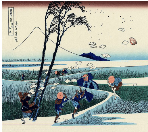
Resim: 10 EjiriSuruga Kırşalında, Otuz altı Fuji Dağı Manzarası Serisinden, 1830-31, Boston Güzel Sanatlar Müzesi( https://theartstack.com/artist/katsushika-hokusai-ge-shi-bei-zhai/ejiri-suruga-province ).

Edo bölgesinin önemli peyzajlarından oluşan mazara resimleri bu dönemde betimlediği konulardandır (bkz: Resim 10). Otuz altı Fuji Dağı Manzarası da aynı döneme tarihlenir. Batı tarzı perspektifi ustaca kullandığı, Japon doğasının ve insanların günlük yaşamını resimlediği bu renkli tahta baskılar, dönemin yaşam tarzı ve hayat akışı ile ilgili de önemli ve belgeleyici nitelikte kaynaklardır. Bu resimlerde, dönem Japonya’sında günlük yaşamları içinde sıradan insanlar, balıkçılar, köylüler, günlük giysileri, araç gereçleri ve doğa içindeki günlük uğraşları esnasında betimlenir.