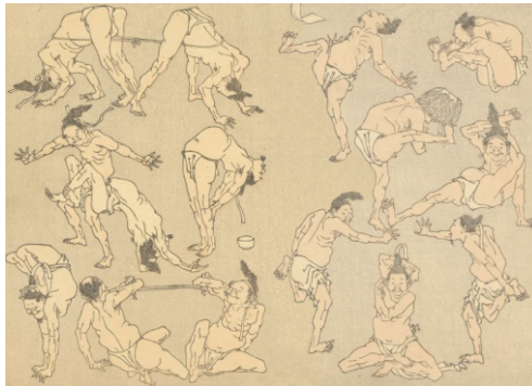
Resim: 8 Performansçılar, Hokusai Manga 1815-1865 ( https://neurophilosophy.wordpress.com/2010/03/23/IMPLIED_MOTION_IN_HOKUSAI_MANGA/ ).