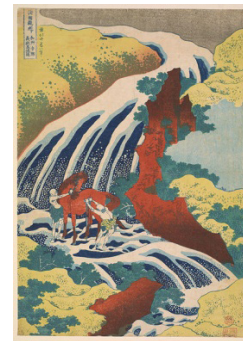
Resim: 2 Ünlü Wazu Şelalesinde At Yıkama, kağıt üzerine ahşap baskı, 1833. ( https://tr.wikipedia.org/wiki/Dosya:Katsushika_HokusaiYoshitsune_Falls,_from_the_seriesFamousWaterfalls_in_Various_Provinces_Google_Art_Project.jpg ).