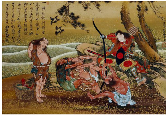
Resim: 6 Tametomo ve Onigashima Adasının Yerlileri,1811. ( https://fr.muzeo.com/reproduction-oeuvre/larcher-tametomo-defie-les-sauvages-donoshima-de-parvenir-a-bander-son-arc ).

Hayatı boyunca pek çok kez taşınan (yaklaşık 93 farklı ikametgah), ve pek çok kez ad değiştiren Hokusai, farklı konularda farklı yöntemlerle üretmeyi seven bir sanatçıydı. Antolojiler, erotik içerikli kitaplar, baskı resim albümleri, elde boyanan resimler ve tarihi romanlar gibi pek çok farklı türde iş üreten Hokusai, 1800 yılına kadar, Ukiyo-e'nin portre dışındaki amaçlar için kullanımını daha da geliştirmiştir. Yaşamının bu döneminde, doğduğu yer olarak da bilinen Edo'nun, “kuzey stüdyosu” anlamına gelen eski adını yani Katsushika Hokusai'yi isim olarak benimser. Sonraki dönemlerde de bu isim, sanatçının en bilinen adı olarak anılacaktır. O yıllarda, iki manzara koleksiyonunu; Doğu Kapısı'nın Ünlü Manzaranarı ve Edo'nun Sekiz Manzarası'nı yayınladı.