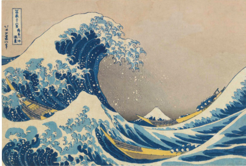
Resim: 13 Kanagawa Dalgası, renkli ağaç baskı, 36 Fuji Dağı Manzarası serisinden, 1832 ( https://www.wikiart.org/en/katsushika-hokusai/the-great-wave-of-kanagawa ).

Bu seriden, orjinal adı “The Great Wave of Kanagawa” olan, Kanagawa Dalgası adlı resim ilk olarak 1832’de, 36 Fuji Dağı Manzarası adlı serinin bir parçası olarak basıldı. 36 Fuji Dağı Manzarası serisinden, muhtemelen Japon sanatının en ünlü imajı olan bu ikonik tahta baskı, devasa bir dalganın köpürme anını betimler. Derinliği ve dalgaların hacmini gösterebilmek için batı perspektifini kullanır. Dalgalarla baş etmeye çalışan balıkçı tekneleri dalganın heybeti karşısında çaresizce mücadele eder. Resmin içinde dikkatlice bakınca uzakta görünen Fuji Dağı, dalgalardan biri gibi görünür. Sanatçı dalgaların içine bir Fuji silueti daha çizer. Büyük dalganın önünde görünen dalga, dağın ikinci bir betimlemesini gizler (Resim 13).