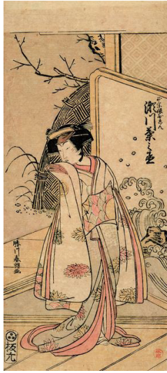
Resim: 3 Segewa Kikunojo III, Oren olarak (kılığında), renkli ağaç baskı, yaklaşık 13 x 15 cm. 1779. Tokyo Ulusal Müzesi, (Paget, 2018, s.6).

Resim yapmaya çok küçük yaşlarda başlayan Hokusai, küçük yaşta ayna yapımcısı olan babasının işlerine yardım etmiştir. Sanatında küçük yaşta öğrendiği bu zanaatın biçimlendirici bir etkisi olduğu düşünülür. İlk işi bir kütüphanede katipliktir. Dört yaşından ustası Shunsho'nun yanına girdiği 18 yaşına kadar bir ağaç kesicinin yanında çırak olarak çalışır. Bir Ukiyo-e sanatçısı olan Shunsho'nun stüdyosuna kabul edildiğinde, o da ustası gibi daha çok mahkumlar, günlük olaylar ve Kabuki aktörleri gibi imajlara odaklanır. İlk isim değişikliği de burada olur. Ustası tarafından verilen Shunrō adıyla 1779'da ilk defa bir dizi Kabuki aktörünün resmini yayınlar (Resim 3-4).