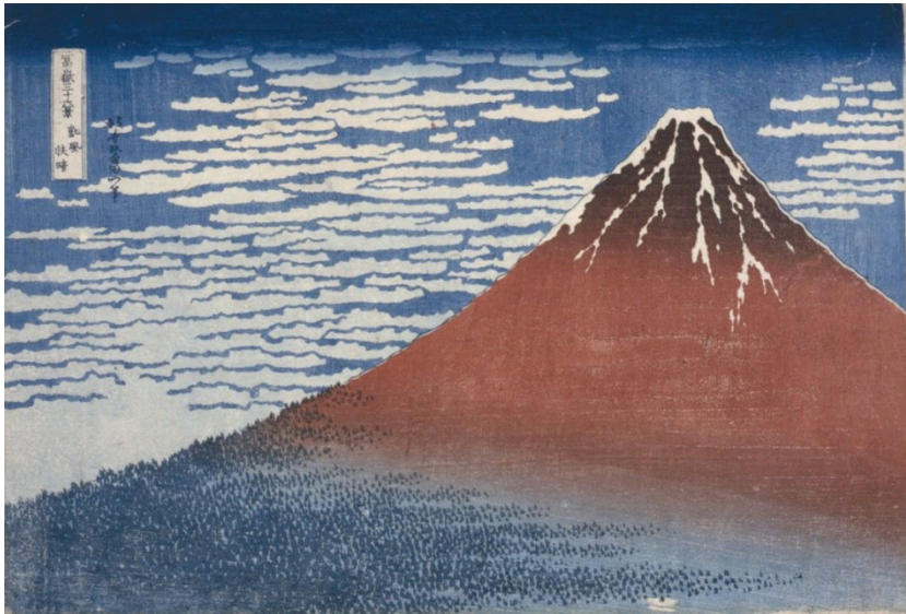
Resim: 11 Otuz altı Fuji Dağı Manzarası Serisinden, İnce Rüzgar, Berrak Sabah, 1830'lar. Indianapolis Sanat Müzesi( https://tr.wikipedia.org/wiki/36_Fuji_Dağı_Manzarası_(Hokusai) ).

Fuji Dağı masalında olduğu gibi, bu seriyle birlikte Hokusai, masalda geçen ölümsüzlük iksirine kavuşmuş olur. Bu kutsal dağın resimleri, bir sanatçı olarak yaşamının sonunda yeniden doğmasını ve sonsuza kadar yaşamasını sağlayacak güce sahip olmasını sağlar.