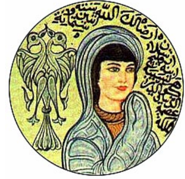
Resim 1. Gevher Nesibe Hatun

Selçuklu Sultanı II. Rükneddin Kılıç Arslan'ın kızı ve Sultan I. Gıyaseddin Keyhüsrev ile I. İzzeddin Keykavus'un kardeşleri olan Gevher Nesibe'nin doğum ve ölüm tarihleri -mezar taşı olmadığı için- tam olarak bilinmemekte; bu tarihlerin yaklaşık olarak XII. yüzyılın sonu ile XIII. yüzyılın başına rastladığı tahmin edilmektedir ( Resim 1 ). Gevher Nesibe Sultan, Selçuklu soyundan gelen karakaşlı, kara saçlı, kara gözlü, ak yüzlü bir Türk kızı olarak resmedilmekte ve külliye'nin yapılışı halk arasında aşağıda yer alan efsaneyle bağlantılandırılmaktadır 1, 2, 9, 13, 14 :