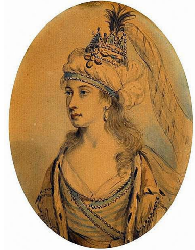
Resim 4. Hürrem Sultan

İstanbul Yenibahçe'deki Gureba-i Müslimin Hastanesi Sultan Abdülmecid (1839-1861) döneminde, Bezm-i Âlem Valide Sultan tarafından 1843 yılında inşa ettirilmiştir. Hastane Osmanlı külliye mimarisi geleneğinde cami, darüşşifa ve çeşme olarak planlanmıştır. Hastane adından da anlaşılacağı üzere fakir halka hizmet verilmek için inşa edilmiş ve vakıf gelirlerine bağlanmıştır. Tanzimat hareketinden (1839) sonra dilimize giren "hastane" sözcüğünün ilk kez kullanıldığı sağlık kuruluşudur 11 .