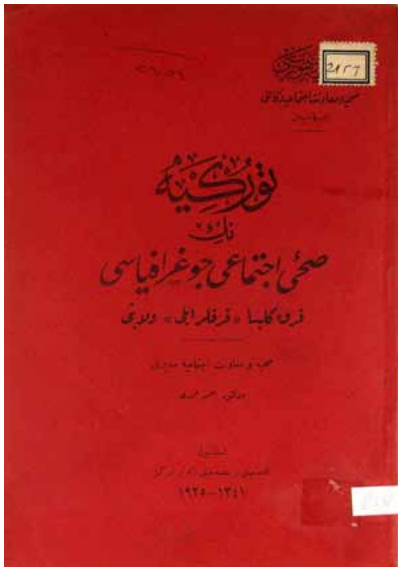
Resim 1. Türkiye'nin Sıhhi ve İçtimai Coğrafyası: Kırklareli Vilayeti adlı eserin kapak sayfası.

Beşinci bölümde yörede görülen hastalıklar hakkında bilgiler mevcuttur. Altıncı bölümde ise sadece 1923 yılına ait doğum ve ölüm rakamları verilmiştir. Kitabın sonunda ise bir Kırklareli haritası mevcuttur.