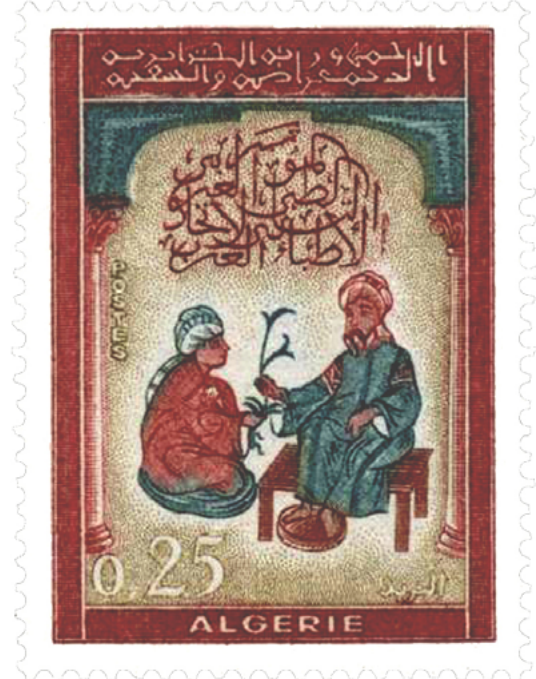
Resim 2. Arap Tıp Kongresi, Cezayir