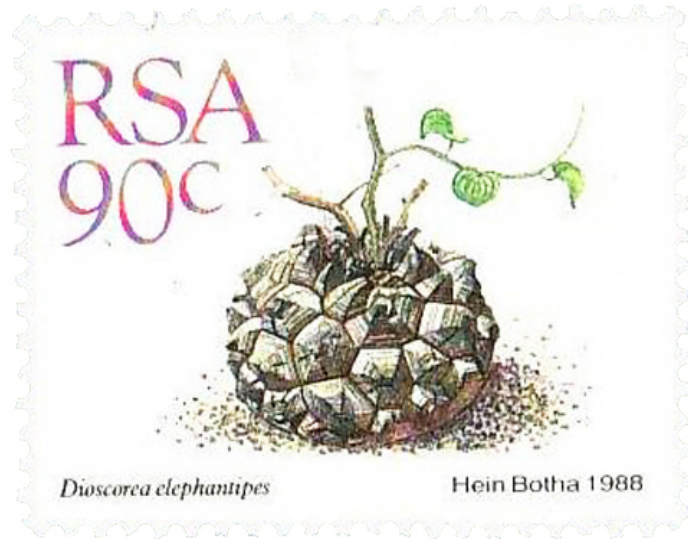
Resim 7. İçi Sulu Bitkiler, Güney Afrika