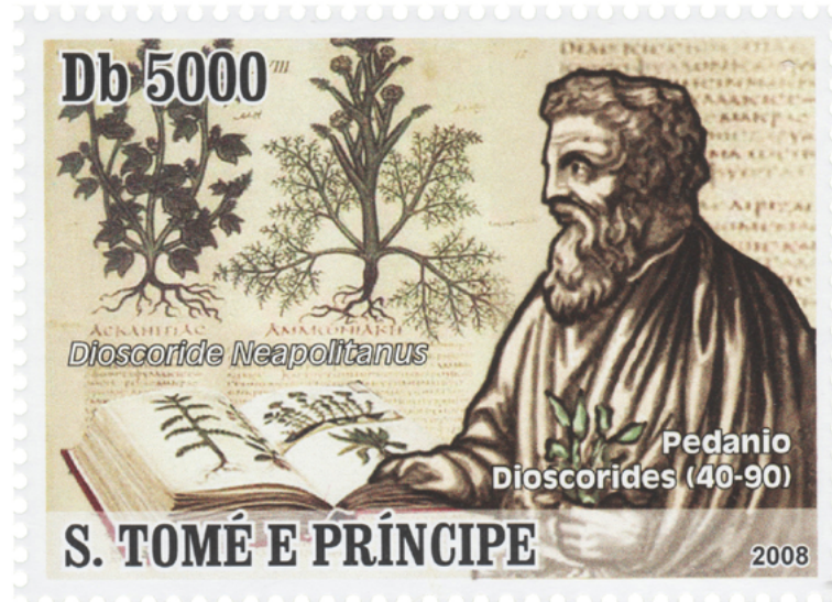
Resim 3. Natüralistler, St. Tome