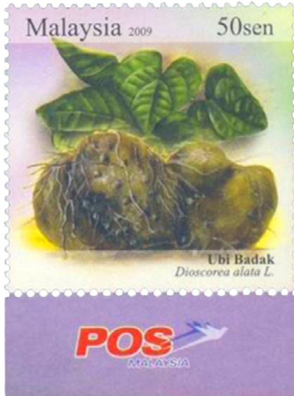
Resim 6. Yumrulu Kökler, Malezya