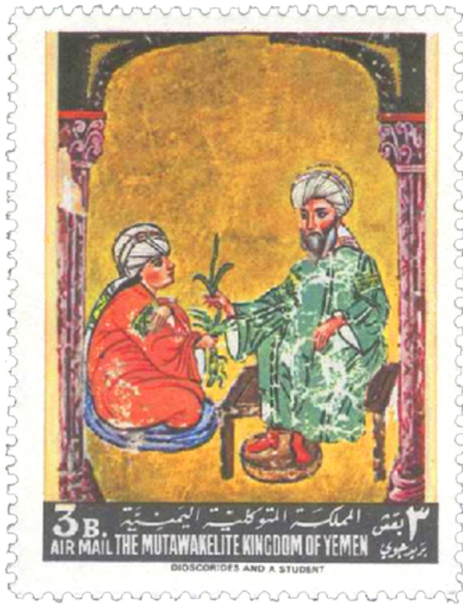
Resim 1. Asya Tabloları, Yemen