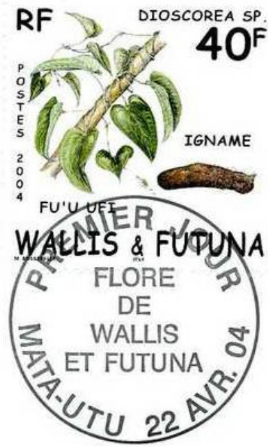
Resim 4. Yöresel Bitkiler, Wallis ve Futuna