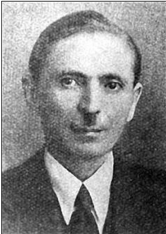
Resim 1. Dr. Hulusi Behçet

Hulusi Behçet 20 Şubat 1889'da İstanbul'da doğdu. Maarif müdürlerinden Ahmet Behçet Bey'in oğludur. Kuleli Askeri Tıbbiye İdadisi'ne 1901 yılında girdi ve 1910 yılında yüzbaşı rütbesi ile mezun oldu. Bir yıl süren stajdan sonra 1911-1914 yılları arasında Gülhane Tatbikat Okulu'nda cildiye servisinde hocaları Eşref Ruşen, Talat Çamlı, Reşit Rıza'nın yanında çalıştı ve 1914 yılında cildiye (dermatoloji) uzmanı oldu. Birinci Dünya Savaşı sırasında Kırklareli ve Edirne hastanelerinde 4 yıl süreyle görev yaptı.