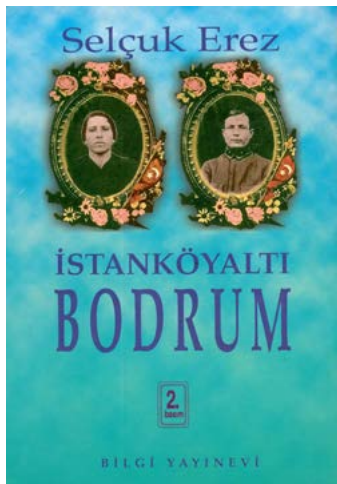
Resim 4. İstanköyaltı Bodrum (1997) kitabının kapağı

Selçuk Erez’in eserlerinde tıp ve eczacılıkla ilgili konulara -bilimsel detayları ihmal etmeksizin- sıklıkla değinmiş olmasında kendisinin de bir kadın doğum uzmanı olmasının rol oynadığı açıktır. Nitekim eserlerinin birçoğunda kahramanlarını bilinçli bir tercihle kadın doğum uzmanı seçmiş (“Albay’ın Tebliği”, Eldebran’a Gideyim mi? , “Kötü Hastalık”, Öpüşmek Yasaktı Düşünmek de , “Trendelenburg Pozisyonu”); bunu doktor ( Dünyanın Sonu Gelmeyecek , Garı Dayı ), diş hekimi (“Dişçinin Hünerini Tebessümler Gösterir”, Garı Dayı ), eczacı ( Makriköy’e Dönüş ), hastabakıcı (“Pansumancı Onbaşılar”, Öpüşmek Yasaktı Düşünmek De ) gibi sağlık meslek mensupları izlemiştir. Bu duruma paralel olarak da eserlerinde kadın doğum kliniği, ameliyathane, hastane odası ve eczane gibi mekânlar öne çıkmıştır.