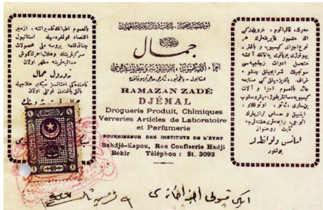
Resim 3. Ramazanzade Cemal Ecza Deposu başlıklı fatura (1925) (Belgelerle Türk Eczacılığı III, 1999: 166).

Öpüşmek Yasaktı Düşünmek de başlıklı romanda başkahraman Ali katılması gereken bir mevlidin okunacağı camiye karıştırınca telaşa kapılmış ve doğru camiye güç bela ulaşabilmiş, bu sırada baş ağrısı tutunca da eczaneden Aspirin almıştır. 26 Aynı romanın ilerleyen bölümlerinde de başkahraman Aspirin’i bu kez soğuk