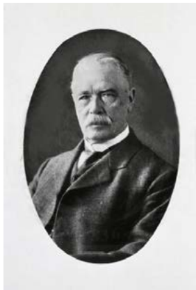
Resim 1. Dr. Friedrich Trendelenburg (1844–1924)