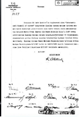
Resim 4. VIII. Uluslararası Hemşirelik Kongresi'ne ilişkin Mustafa Kemal Atatürk imzalı kararname, 3 Temmuz 1937 5