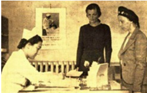
Resim 7. Kızılay gönüllü hastabakıcı teşkilatına katılmak isteyen gençlerin kayıtları yapılırken, 1939 14