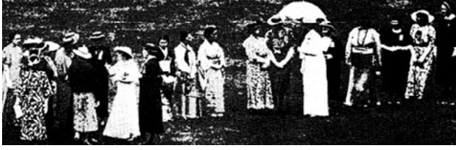
Resim 1. Kraliçeler konsey üyelerini kabul ederlerken, 20 Temmuz 1937 9