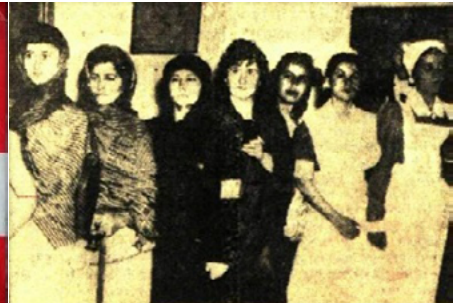
Resim 9. Tarih içinde hemşire kıyafetlerine ilişkin gösteri, 1953 21