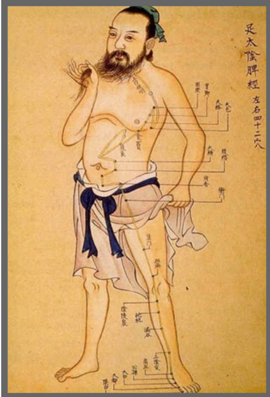
Şekil 1. Geleneksel Çin Tıbbı'nda Akupunktur Noktaları

Çin Tıbbı, hasta ve hastanın semptomlarını bütüncül (holistik) bir yaklaşımla ele almakta olup Yin ve Yang'ın dengede olma durumunu, sağlıklı olma hali olarak tanımlamaktadır. Yin, hareketleri, beş temel madde olan metal, tahta, su, ateş ve toprak arasındaki etkileşimi etkileyen, yer, soğuk ve kadınlığı temsil etmekte, Yang ise gökyüzü, sıcak ve erkekliği temsil etmektedir. Çin Tıbbı'nda, bitkisel ilaçlar ve baharatlar, elle yapılan terapiler, akupunktur ve taichi gibi egzersizler, nefes alma teknikleri ve diyet gibi birçok uygulama yer almaktadır. 1,8,9 Bu tedavi sistemi temel olarak, insan vücudunun bütünlüğü ve doğal çevre ile ilişkisi üzerinde durmaktadır. 10