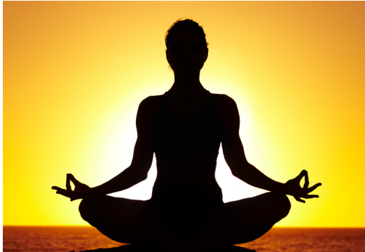
Şekil 5. Yoga