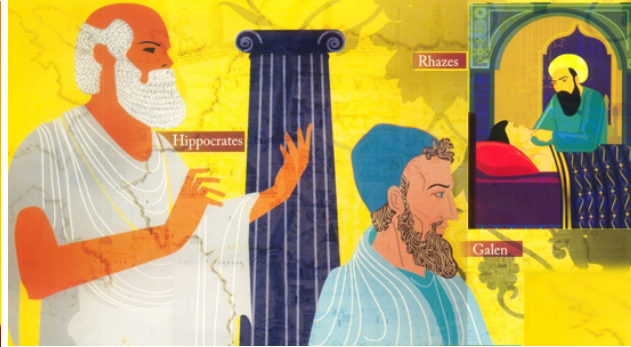
Şekil 6. Unani Tıbbı'nın Gelişimine Katkı Sunan Bilim Adamları