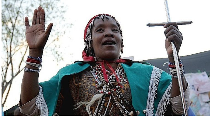
Şekil 7. Geleneksel Afrika Tıbbı

Geleneksel Afrika Tıbbı denildiğinde daha çok bölgeye özgü bitkilerden elde edilen ilaçların geleneksel sağaltıcılar tarafından hazırlandığı bir sistem akla gelmektedir. Bölgedeki halk ilaçları, pek çok sağlık sorununa çözüm bulmaya yönelik olmasına rağmen özel olarak HIV/AIDS tedavisine yönelik hazırlandıkları bilinmektedir. Geleneksel Afrika Tıbbı'nda kâhinler, ebeler ve şifalı otlar satan kişiler önemli yer tutmaktadır ve bu sistemde hastalığın hasta ile sosyal çevresi arasındaki dengesizlikten kaynaklandığına inanılmaktadır (Şekil 7). 29