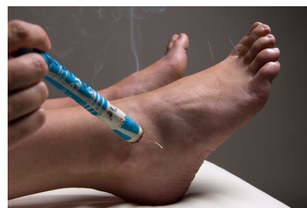
Şekil 3. Moksa Terapisi.

Sasang tipolojisine göre insanlar, bitkiler ve ilaçlara duyarlılıkları