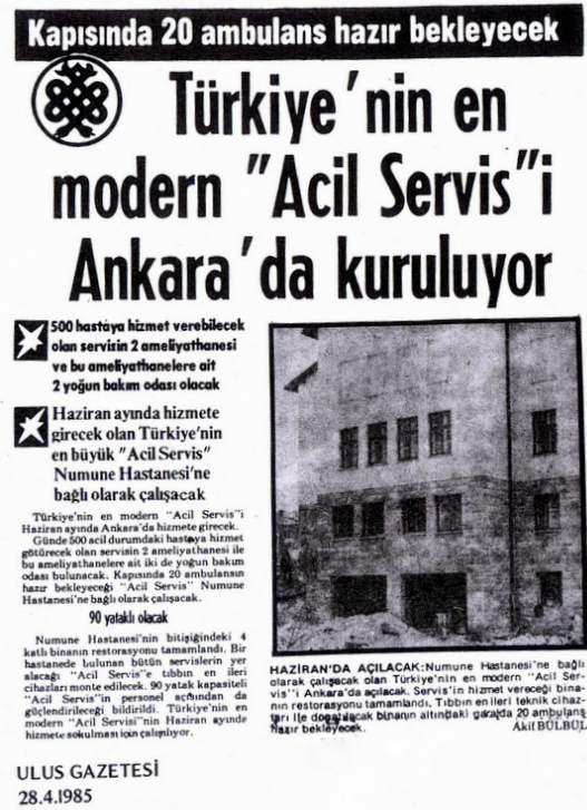
Şekil 2. 28 Nisan 1985 tarihli Ulus Gazetesi

Aslında hekim kökenli olmayan Sağlık ve Sosyal Yardım Bakanı Mehmet Aydın döneminde, Ankara Numune Hastanesi’nde “Hızır Acil Servis” ismiyle bir servis hizmete açılmıştır. 6,10 1985 yılının ekim ayında hizmete açılan bu servis; doktorların, hemşirelerin, sağlık memurlarının ve şoförlerin modern anlamda bir ambulans sistemi bünyesinde görev aldığı Türkiye’deki ilk yapılandırma. 11 Acil durumlarda ambulans talebini karşılamak üzere organize edilen serviste, sağlık görevlileri de ambulansla birlikte olay yerine gitmektedir. (Şekil 2)