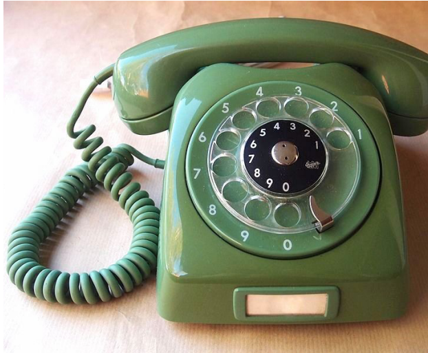
Şekil 3. Çevirmeli telefon

Türkiye’nin, bir modernleşme projesi olarak kendine hedef koyduğu Avrupa Birliği -o zamanki ismiyle Avrupa Ekonomik Topluluğu- 1991 yılında, üye ve aday ülkelere ambulans hizmetleri konusunda bir tavsiye kararı almıştır. 15 Bu tavsiye kararına göre, söz konusu ülkelerde hastane öncesi acil yardım hizmetleri, tek numarada birleştirilerek “112” olarak belirlenmiştir. Ancak uzun bir süre pek çok ülke bu tavsiye kararına uymamıştır. Türkiye, bu kararı uygulamaya koyan ilk ülkelerden biridir. 10,16 Ambulans servisinin numarası olarak “112” nin belirlenmesinde, o dönem için bir takım teknik