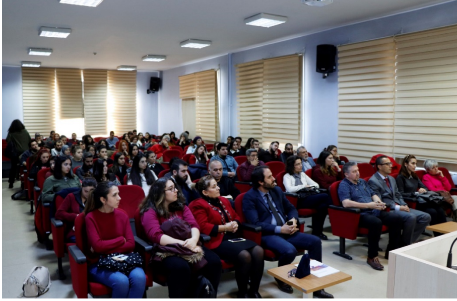
Resim 2. Katılımcılar