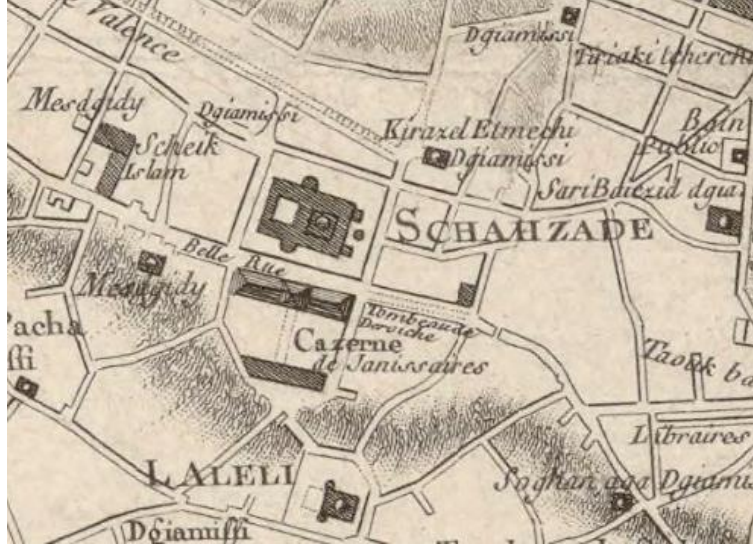
Harita 1: Kauffer Haritaları'nda Şehzade Cami karşısında yer alan Yeniçeri Kışlası