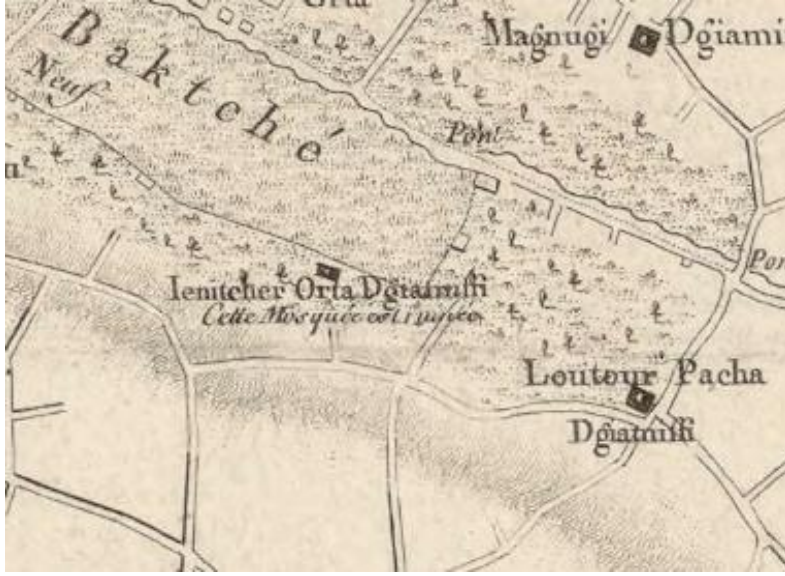
Harita 3: Yeni Bahçe civarında Yeniçeri Orta Cami