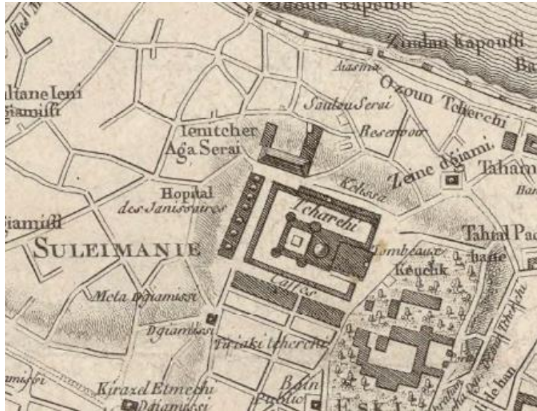
Harita 2: Kauffer Haritaları'nda Eski Saray civarında Yeniçeri Ağa Sarayı ve Yeniçeri Hastanesi