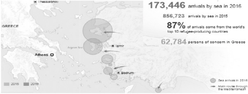
Şekil 1: Ege Denizi'nden Yunanistan'a Geçişler