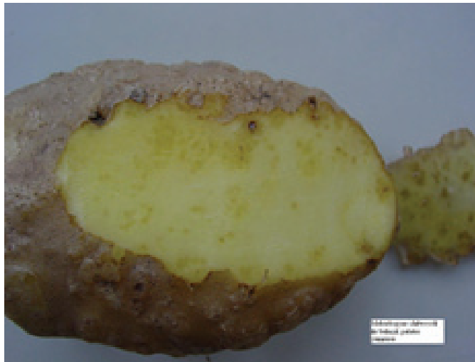
Şekil 1. Meloidogyne chitwoodi ile bulaşık patates yumrusu.

Meloidogyne chitwoodi ile infekteli patates yumrularından nematoda ait yumurta paketleri toplanıp, yumurta paketlerinden ikinci dönem larvalar elde edilmiştir (Şekil 1).