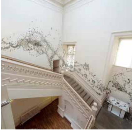
Görsel 32. "Stirring the Swarm" Enstalasyonundan Görünüm, Birimler: 2-20 cm aralığındadır. Nottingham Kalesi, 2012