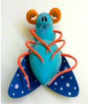
Görsel 28. “Karasinek-I” 15,5x21x14 cm, 2016

Bazı eserlerde böceğin en rahatsız edici kısmı olduğunu düşünülen bacaklar ön plana çıkarılmaktadır. Bazılarında ise insana özgü ifade ve mimiklerin belirgin bir şekilde ortaya konulduğu görülmektedir. Bu yorumlarla seramik malzemenin plastik dilini vurgulanarak, izleyicinin dikkatini çekmesi için eserlerde canlı renkler kullanılmış olup çiçek, puantiye ve benzeri bezemelere yer verilmiştir.