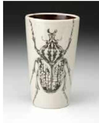
Görsel 35. "Goliath Beetle" 6", 2010