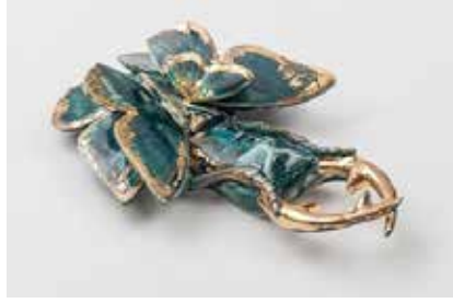
Görsel 30. "Beetle" 14x20 cm, 2016

neklerden bahsederken daha yakından incelendiğinde karanlık duygularınızı kulağınıza nazikçe fısıldamaktadır.