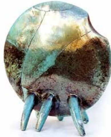
Görsel 15. "Mavi Böcek" 40x35x10 cm, 2004