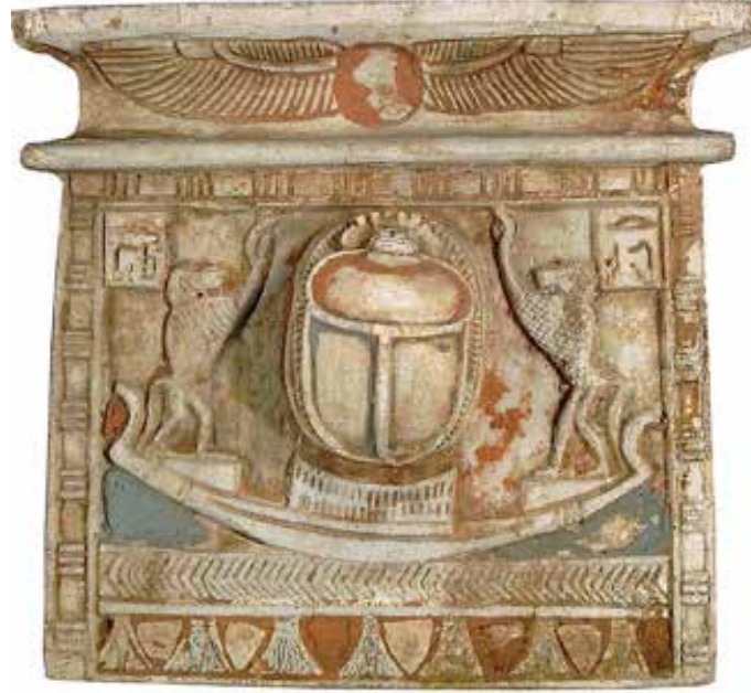
Görsel 2. Üzerinde Scarabaeus yer alan Pektoral, M.Ö. 1292-1070, Mısır Walters Sanat Müzesi'nde sergilenmektedir.

İnsanlık tarihinin en önemli ibadet yapılarından biri olan, Şanlıurfa' ya 15 km. uzaklıkta bulunan ve arkeolojik olarak Çanak Çömlek Öncesi Neolitik A Dönemine (M.Ö 9.600 – 7.300) ait olan Göbeklitepe' de, bir tepe üzerine inşa edilmiş halde boyları 3 ila 6 metre arasında değişen T biçiminde sütunlar bulunmuştur. Arkeologlar bu sütunların yüzeylerinde görülen el ve kol tasvirleri nedeniyle stilize edilmiş insan figürü olduklarını düşünmektedirler. Ayrıca söz konusu taş sütunlar üzerine işlenmiş çeşitli hayvan tasvirleri ve soyut semboller de bulunmaktadır (http 4) . Bu figürler arasında kabartma halinde bir de akrep figürü yer almaktadır (Görsel 3). Bazı arkeologlara göre bu hayvan figürleri tapınağı ziyaret eden farklı kabilelerin sembolü olarak nitelendirilmektedir (http 5) .