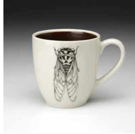
Görsel 37. "Cicade" 4.25", 1998