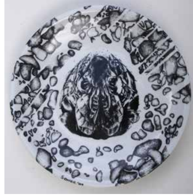
Görsel 21. "İsimsiz" R:28 cm, 2009