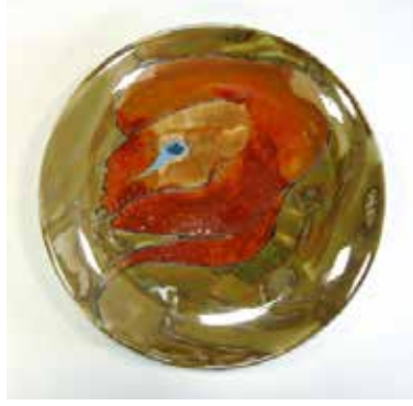
Görsel 19. "Kabuksuz" R:28 cm, 2010

Soner Genç, eserlerinde böcek imgesini kullanan Türk sanatçılardan biridir. Böcek imgesini kullandığı çalışmalarını transfer yöntemi ile gerçekleştiren Genç, farklı böcek türlerini, kara-kalem desen oluşturduktan sonra sır üstü çıkartmalarını kendisi hazırlamaktadır. Siyah-beyaz tonlardaki çalışmalarında doğadan aldığı farklı böcek türleri görülmektedir. Tabakların iç yüzünde belli bir düzende (sıralı, üst-üste) oluşturduğu kompozisyonlarda böcek imgeleri çarpıcı şekilde ön plana çıkmaktadır (Görsel 20-21-22-23).