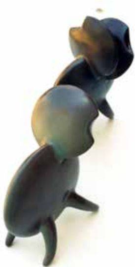
Görsel 14. "İsimsiz" 55x28x30 cm, 2004

Bir diğer Türk Sanatçı Perihan Şan Aslan doğanın önemli bir parçası olduğunu düşündüğü böcekler üzerinde uzun süre çalışmıştır. Böcekler doğadaki tüm hayvan türlerinin önemli bir bölümünü oluşturmaktadır. Bu çeşitlilik çok sayıda farklı biçim, renk ve dokunun var olduğu anlamına gelmektedir. Aslan'ın bu konuya yönelmesinin sebeplerinden biri de söz konusu çeşitliliğidir. Sanatçı, yaptığı çalışmaların bir kısmını böcek biçimlerini soyutlayarak bir kısmını ise doğadan algılayıp zihninde biriktirdiği böcek imgesini yeniden kurgulayarak gerçekleştirmiştir. Aslan için soyutlamalarda yalın, çarpıcı bir biçime ulaşmak önemlidir. Formlarını oluştururken böceklerin temel özelliklerini seçip geometrik birimlere indirgeyerek bu özellikleri ön plana çıkarmaya çalışmıştır (Görsel 14). Böceklerin renklerini vurgulamak için raku gibi farklı redüksiyon pişirim tekniklerini de çalışmalarında kullanmıştır (Görsel 15).