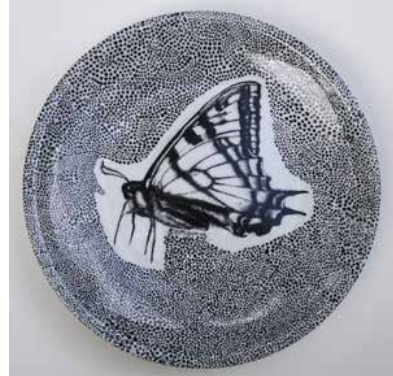
Görsel 23. "İsimsiz" R:28 cm, 2009