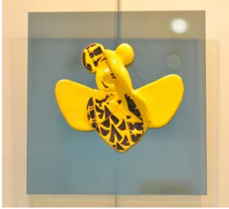
Görsel 26. “Ertuğrul” un Ayakkabısı” 32x35 cm, 2017

rahatsızlık hissine neden olan sinekler, eninde sonunda öldürülmeye mahkûmdurlar. Bu çalışmalarda ölüm ve öldürme olgusunun istemsiz şekilde hoş karşılandığı tek canlı türünün böcekler olduğunu düşünülmektedir. Mizahın pozitif etkili yönü kullanılmış “Öldürmeyen Yoktur” isimli seramik sergisinde buna dikkat çekilmektedir.