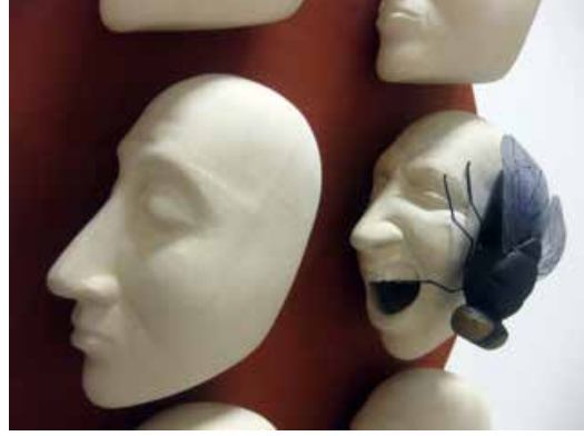
Görsel 13. "Musibet" Detay, 50x50x10 cm, 2016

Bir diğer Türk Sanatçı Perihan Şan Aslan doğanın önemli bir parçası olduğunu düşündüğü böcekler üzerinde uzun süre çalışmıştır. Böcekler doğadaki tüm hayvan türlerinin önemli bir bölümünü oluşturmaktadır. Bu çeşitlilik çok sayıda farklı biçim, renk ve dokunun var olduğu anlamına gelmektedir. Aslan'ın bu konuya yönelmesinin sebeplerinden biri de söz konusu çeşitliliğidir. Sanatçı, yaptığı çalışmaların bir kısmını böcek biçimlerini soyutlayarak bir kısmını ise doğadan algılayıp zihninde biriktirdiği böcek imgesini yeniden kurgulayarak gerçekleştirmiştir. Aslan için soyutlamalarda yalın, çarpıcı bir biçime ulaşmak önemlidir. Formlarını oluştururken böceklerin temel özelliklerini seçip geometrik birimlere indirgeyerek bu özellikleri ön plana çıkarmaya çalışmıştır (Görsel 14). Böceklerin renklerini vurgulamak için raku gibi farklı redüksiyon pişirim tekniklerini de çalışmalarında kullanmıştır (Görsel 15).