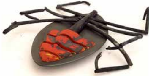
Görsel 16. "İsimsiz" 50x100x15 cm, 2004

Böcek imgesini yeniden kurgularken böceklerin hareketleri ve böcek kavramının insan üzerinde oluşturduğu psikolojik çağrışımları da göz önünde bulunduran sanatçı, böceklerin insanlar tarafından en çok tahrip edilen canlı türlerinden biri olduğunu ve böcek denildiğinde ilk akla gelen kavramlardan birinin de öldürmek olduğunu söylemektedir. Özellikle ters dönmüş böcek formlarını üretirken ölüm- öldürmek kavramları ve Kafka'nın "Dönüşüm" adlı romanında kendini dev bir böceğe dönüşmüş olarak bulan kahramanı Gregor Samsa dan ilham almıştır (Görsel 16-17) (Perihan Şan Aslan ile Eserleri Üzerine Röportaj) (Röportaj Tarihi: 05.07.2017).