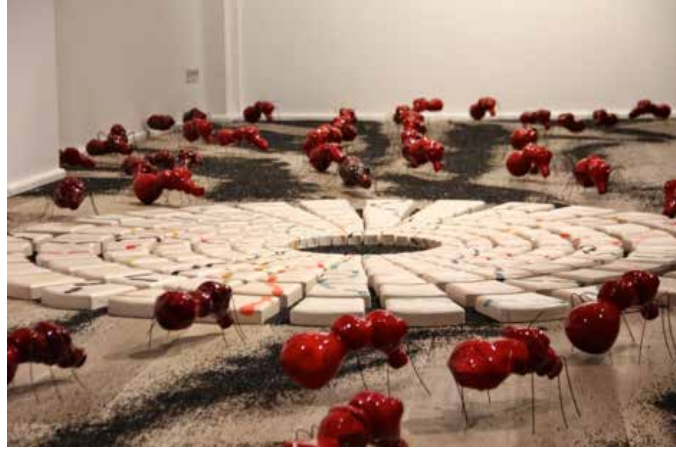
Görsel 6. "Sınana Sınana" İsimli Seramik Sergisinden, 40 m2, 2014