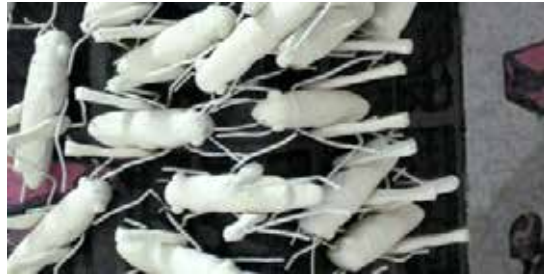
Görsel 9. “İstila” Detay, 135x60x50 cm, 2009