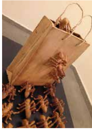
Görsel 25. “Karıncalar” Düzenleme Detay, 50x140x75 cm, 2017

Görsel 26-27-28-29’da görülen Firdevs Müjde Gökbel’ e ait çalışmalar, böcek imgesine yer verilen diğer örneklerdendir. Bilinçaltında özellikle korku, ürkme, kaygı, tiksinti gibi duyguları uyandıran böcekler ele alınmıştır. Bu türden hislerin izleyici açısından bakıldığında daha uyarıcı olduğu düşünülmektedir. Bu düşünceden hareketle böceklerden öncelikle sinek türü seçilmiş, insana özgü duygu hallerinin yanı sıra yaşamında başına gelebilecek durum ve olaylar sinek figürü üzerinden çalışmalarda yansıtılmaktadır. Bu figürler çoğunlukla mizahi bir yaklaşım sergilemektedir.