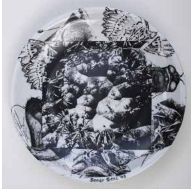
Görsel 20. "İsimsiz" R:28 cm, 2009

Soner Genç, eserlerinde böcek imgesini kullanan Türk sanatçılardan biridir. Böcek imgesini kullandığı çalışmalarını transfer yöntemi ile gerçekleştiren Genç, farklı böcek türlerini, kara-kalem desen oluşturduktan sonra sır üstü çıkartmalarını kendisi hazırlamaktadır. Siyah-beyaz tonlardaki çalışmalarında doğadan aldığı farklı böcek türleri görülmektedir. Tabakların iç yüzünde belli bir düzende (sıralı, üst-üste) oluşturduğu kompozisyonlarda böcek imgeleri çarpıcı şekilde ön plana çıkmaktadır (Görsel 20-21-22-23).