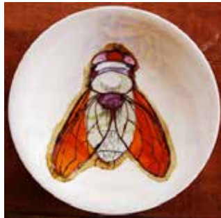
Görsel 18. "Sinek" R:28 cm, 2010

Pınar Genç, eserlerinde böcek imgesini kullanan Türk sanatçılar arasındadır. Bazı böceklerin sahip olduğu çarpıcı renkler ve anatomik özellikleri sanatçının dikkatini çekmiştir. Tabak formu üzerinde çalıştığı böceklerin canlı renklerini lüster tekniği ile ortaya koyan Pınar Genç' in gerçekçi çalışmalarının yanı sıra fantastik bir yaklaşımla ortaya koyduğu eserleri de mevcuttur (Görsel 18-19).