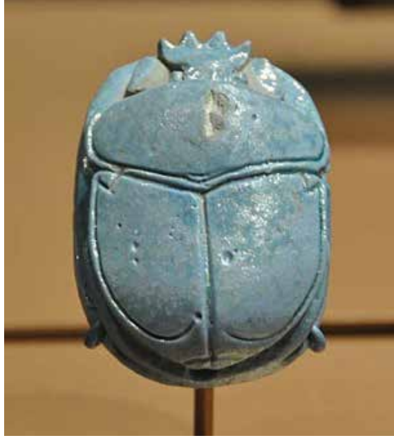
Görsel 1. III. Amenhotep ve Kraliçe Tiye'nin "Evlilik Scarabaeus'u", Sırlı Fayans, 2,8 x 5 x 7 cm. M.Ö. 1390-53, Mısır, Fotoğraf: Stephen Sandoval. New York, Brooklyn Müzesi'nde sergilenmektedir.

Yumurtalarını yuvarlanarak şekillendiren ve gübre topları halinde taşıyan bu canlı, eski Mısır dininde yer alan önemli simgelerden bir tanesidir (http 2) . Eski Mısır Uygarlığında sanatta, dinde, mitolojide, söylencelerde Kutsal Mısır böceğinin önemli bir yeri vardı. Ölümsüzlüğün simgesi, ölümden sonra da yaşamın delili olarak algılanan Scarabaeus, yumurtalarını dışkısının içerisine bırakır ve başı Doğu'ya dönük bir şekilde arka ayaklarıyla söz konusu topağı, toprağın içerisinde iterek yuvasına götürür. Topak incelendiğinde geometrik küreye taş çıkartacak mükemmellikte yuvarlak olduğu görülmektedir. Mısırlılar' a göre, yuvarlanan topak, güneşin gökteki hareketini, topaktan çıkan scarabaeus ise ölümden sonra dirilişi simgeler (http 3) .