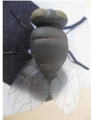
Görsel 11. “Gölge” Detay, 15x15x5 cm, 2011