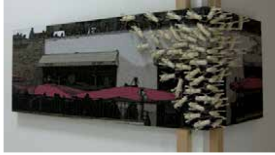
Görsel 8. “İstila” 135x60x50 cm, 2009

şekilde tıpkı tüketime odaklanan insan yığınları gibi kafenin kapısına yığılmışlardır (Görsel 8-9) . (Bahar Arı Dellenbach ile Eserleri Üzerine Röportaj) (Röportaj Tarihi: 05.07.2017) Sanatçının “Gölge” isimli çalışmasında seramiğin yanı sıra yardımcı malzeme olarak metal ve plastik kullandığı görülmektedir. Sanatçı, sineğin yere yansıyan kendinden büyük gölgesi ile ironi yapmaktadır (Görsel 10-11). “Musibet” isimli çalışmasında bir grup insan yer almaktadır. Tekdüzeliliği ifade edercesine aynı pozisyonda duran insan yüzlerinden bir tanesinin üzerinde bulunan sinek sebebiyle rahatsızlık duygusu gözlemlenmektedir. Aynı grupta yer alan diğer bireylerin sabit ifadeleri ile söz konusu eserde toplumda yer alan umursamazlık, görmezlikten gelme durumları da anlatılmaktadır (Görsel 12-13).