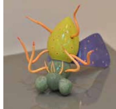
Görsel 29. “Yerler Kaygandı” 22x19x17 cm, 2017

İngiliz sanatçı Anna Collette Hunt, izleyiciyi böcek figürleriyle yarattığı dünyasına çekmek için malzeme olarak kil kullanmaktadır. Yarattığı alan kimi zaman evren kimi zaman ise evrenin küçük bir parçası olabilmektedir. İzleyiciler sanatçının eserlerindeki gizli detayları katmanlı yüzeylerde aramakla yükümlüdür. Gerçekleştirdiği kabartmalı illüstrasyonlara dokunma ya da meraklı bir şekilde cezbedici makaslıböceği (geyik böceği) tutma isteğini inkâr etmek zordur (Görsel 30). Yüzeylerde yakalanan sahneler ve kompozisyonlar, tarihi ihtişam ve geçmiş gele-