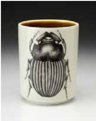
Görsel 34. "Scarab Beetle" 5.25" x 5.25" x 7", 1998

Amerikalı sanatçı Laura Zindel, eserlerinde böcek imgesine yer veren diğer sanatçılardan biridir. Sanatçının doğaya ve tasarıma gösterdiği ilgi, geçen yüzyılın başında ortaya çıkan Arts & Crafts hareketi tarafından savunulan, materyallerin biçim ve gerçeğin sadeliği ilkesine dayanmaktadır. Sanatçının imge kullanımı ve desenleriyle oluşturduğu yaklaşımının temelinde bu yöntemleri övme ve dekoratif sanat dünyasıyla alakalı olarak koruma amacı bulunmaktadır. Arts & Crafts hareketinin pragmatizmasının aksine Zindel, 17. yüzyılda Avrupa' da başlayan sanat hazineleri ve doğal dünyanın harikaları ile dolu olan Viktorya Dönemi vitrinlerine (Cabinets of Curiosities) ilgi göstermiştir. Saplantılı bir bağlılık ile dolaplara yerleştirilen bu nesnelerin eklektik zenginliği, Zindel' in sanatına verdiği yanıtta açıklanamayan ilkel bir şeye dokunmaktadır. Sanatçının tutkusu, elle ve endüstriyel üretim yöntemleri ile gerçekleştirilen ürünlerin kendine özgü etkisini birleştirmektedir. Ortaya çıkan ürünler doğal yaşamın güzelliklerini, merakını ve çeşitliliğini yansıtmaktadır (Görsel 34-35-36-37) ( http 9 ).