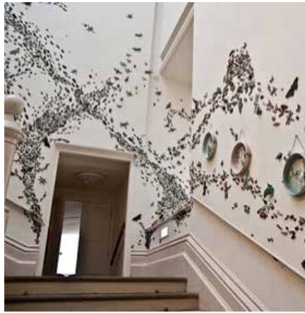
Görsel 31. "Stirring the Swarm" Enstalasyonundan Görünüm, Birimler: 2-20 cm aralığındadır. Nottingham Kalesi, 2012

Sanatçı, gittiği yerlerde karşılaştığı nesnelere etkilenerek eserler üretmektedir. Bu nesne mermer bir büst, mobilya veya hayvan postu olabilmektedir. Yakalamak istediği etkiyi arttırmak için ölçülerle oynamaktadır. Görsel derinlik ise seramik yüzey üzerinde renk, işaretler, transferler ve lüster uygulamalarıyla sağlanmaktadır. Nihai nesnelere ise sevindirici, merak uyandırıcı ve izleyicisini ömür boyu büyüleyecek zengin bir varlık sergilemektedir. Stüdyo koleksiyonlarının yanı sıra 2012 yılında Nottingham Kalesi'nde geniş ölçekli bir enstalasyon da gerçekleştirmiştir. Nottingham Entomoloji (Böcekbilim) koleksiyonunu inceledikten sonra kendi masalını yazmaya karar veren Hunt, zihninde canlandırdığı hikâyesini çamur üzerinde canlandırmaya başlamıştır. Bir yılın içerisinde Nottingham Kalesi'ni adeta istila eden 10.000 adet seramik böcekten oluşan güzel ve unutulmaz bir sürü yapmıştır. İzleyici, hikâyenin ve enstalasyonun gaddar güzelliğinin tadını çıkarmaya çalışarak masalının içine girmeyi başarmıştır. İlgili yapıt ulusal ve uluslararası izleyicisi tarafından halen büyük bir heyecan ve merakla ziyaret edilmeye devam etmektedir (Görsel 31-32-33) ( http 8 ).