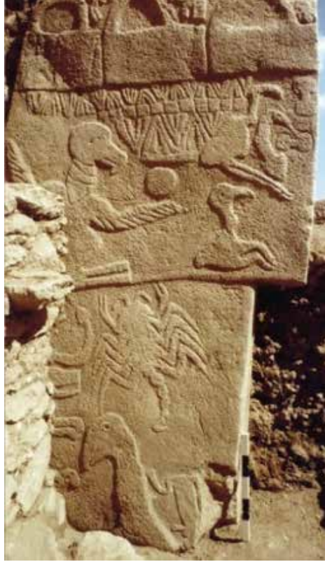
Görsel 3. Göbeklitepe Tapınağı'nda yer alan stel üzerindeki akrep kabartması, M.Ö. 10.000, Şanlıurfa, Göbeklitepe

Sanat eserleri imgeleri temsil etmektedir. Duyu yoluyla alımlanan imgelerin her bireyde oluşturduğu etki farklıdır. Buna bağlı olarak ortaya çıkan yansımaları da farklıdır. (Bayav, D. 2009) Böcek imgesinin uygarlık tarihindeki yeri yukarıda da söz edildiği gibi oldukça geniştir. Çağdaş sanat açısından bakıldığında böcek figürü ve imgesi resim, heykel, mimari, tekstil, seramik ve benzeri disiplinlerde karşımıza çıkmaktadır.