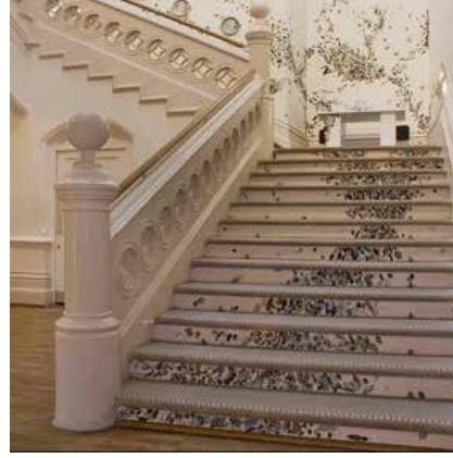
Görsel 33. "Stirring the Swarm" Enstalasyonundan Görünüm, Birimler: 2-20 cm aralığındadır. Nottingham Kalesi, 2012

Amerikalı sanatçı Laura Zindel, eserlerinde böcek imgesine yer veren diğer sanatçılardan biridir. Sanatçının doğaya ve tasarıma gösterdiği ilgi, geçen yüzyılın başında ortaya çıkan Arts & Crafts hareketi tarafından savunulan, materyallerin biçim ve gerçeğin sadeliği ilkesine dayanmaktadır. Sanatçının imge kullanımı ve desenleriyle oluşturduğu yaklaşımının temelinde bu yöntemleri övme ve dekoratif sanat dünyasıyla alakalı olarak koruma amacı bulunmaktadır. Arts & Crafts hareketinin pragmatizmasının aksine Zindel, 17. yüzyılda Avrupa' da başlayan sanat hazineleri ve doğal dünyanın harikaları ile dolu olan Viktorya Dönemi vitrinlerine (Cabinets of Curiosities) ilgi göstermiştir. Saplantılı bir bağlılık ile dolaplara yerleştirilen bu nesnelerin eklektik zenginliği, Zindel' in sanatına verdiği yanıtta açıklanamayan ilkel bir şeye dokunmaktadır. Sanatçının tutkusu, elle ve endüstriyel üretim yöntemleri ile gerçekleştirilen ürünlerin kendine özgü etkisini birleştirmektedir. Ortaya çıkan ürünler doğal yaşamın güzelliklerini, merakını ve çeşitliliğini yansıtmaktadır (Görsel 34-35-36-37) ( http 9 ).