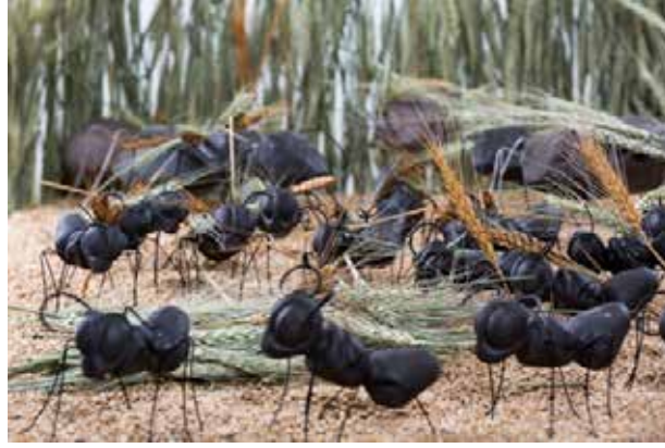
Görsel 4. “Tohum Takas” Projesi, 1,5 m2, 2014

Buket Acartürk uzun süredir farklı misyonlar yükleyerek karınca figürleri yapmaktadır. Türk sanatçı, kişisel kaygı ve düşüncelerini, toplumsal alanda söylemek istediklerini sanatsal alanda biçime dönüştürmektedir. Karıncaları özellikle örgütlü yaşam biçimleri ve disiplinleri nedeniyle seçmiş olan sanatçı, “Tohum-Takas” isimli projesinde buğday başağı taşıyan karıncaları ile yeryüzünün yoksulluk ve beraberinde en temel sorunu olan açlık durumuna dikkat çekmek istemiştir (Görsel 4).