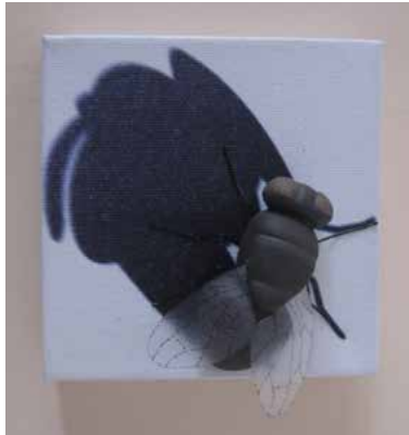
Görsel 10. “Gölge” 15x15x5 cm, 2011