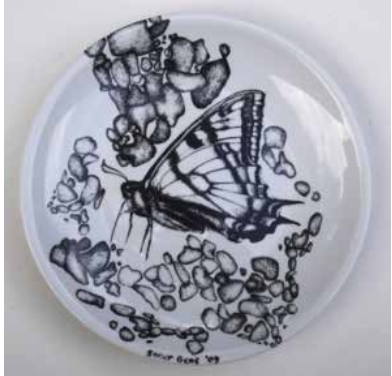
Görsel 22. "İsimsiz" R:28 cm, 2009