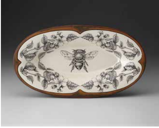
Görsel 36. "Honey Bee" 10" x 21" x 2", 1998