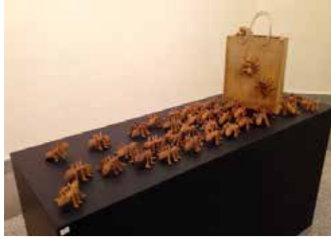
Görsel 24. “Karıncalar” Düzenleme, 50x140x75 cm, 2017