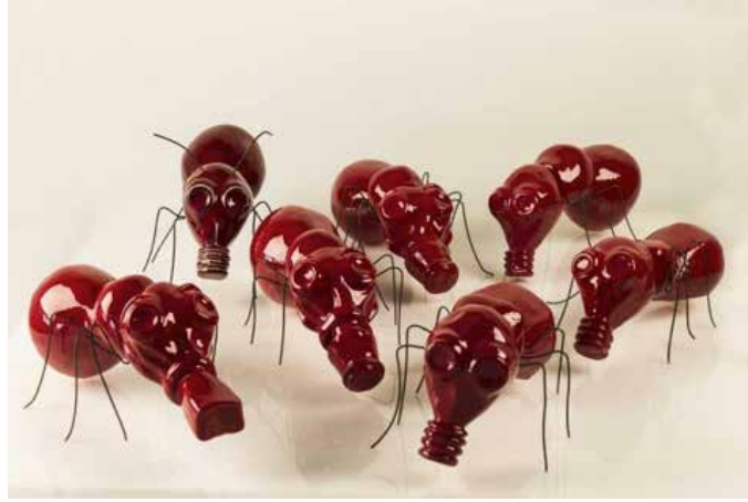
Görsel 7. "Sınana Sınana" İsimli Seramik Sergisinden, Her Birim: 20x25x35 cm, 2014

Böcek imgesini kullanan Türk sanatçı Bahar Arı Dellenbach ise; çalışmalarında sosyal, siyasi ve kültürel konular hakkında eleştirel bir bakış açısı ortaya koymaktadır. Çevre kirliliği, doğanın yıkımı, savaş gibi sosyal konular, tüketim kültürü ve benzeri temalar üzerinde durmaktadır. Sanatçının kimi eserlerinde sembolik, ilginç, tuhaf ve rastgele nesnelere kullandığı görülmektedir. Böylelikle malzeme olarak ele aldığı obje ve tema, izleyiciyi öz eleştiri yapmaya itmektir. Her proje genel olarak birkaç bileşenden oluşur. Seramik malzeme işin merkezidir. Çoğunlukla siyah veya beyaz rengi kullanan sanatçı, zaman zaman anlamı güçlendirmek, dikkat çekmek ve izleyiciyi şaşırtmak için farklı renk ve malzemeler de kullanmaktadır (http 7).