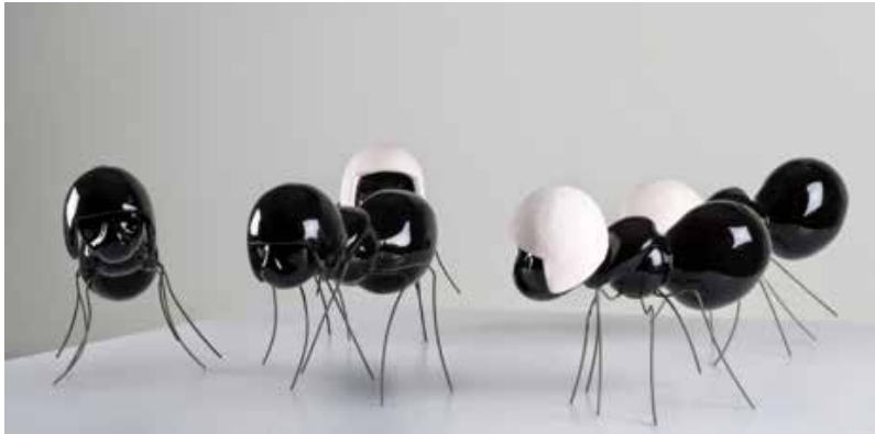
Görsel 5. “Çarşı” 80 cm2, 2014

Yaşanan toplumsal değişim ve dönüşümlerin etkisi ile yeniden yorumladığı karıncalarını izleyicilerle buluşturan sanatçı, “Sınana Sınana” isimli sergisinde meydan kavramını temsil ederken gaz maskeli karınca figürleri ile baskıya direnmenin serüvenini simgelemektedir (Görsel 5-6-7). Aidiyet duygusunu güçlendiren, meydanlara, haksızlıklara, baskılara ve insanların bir amaç uğruna “bir-aradalığına” karınca figürleri ile göndermede bulunan seramik sanatçısı Buket Acartürk, insanlık serüveninin tarihsel, toplumsal ve siyasal deneyimlerini kendi bilimsel ve sanatsal süzgecinden geçirerek “Sınana Sınana” adlı sergisinin her parçasında yansıtmaya çalışmıştır (http 6).