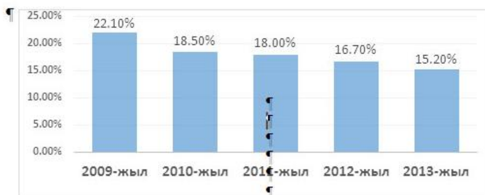
1-сүрөт. ИДПдагы айыл-чарба үлүшү (пайыз менен)

Кыргызстандын азык-түлүк камсыздыгына көз чаптырсак, айыл калкынын шаарларга же болбосо башка мамлекеттерге кетүүсү менен айыл чарба көлөмү кескин түрдө азайды. Мамлекет коркунучсуз абалда деп айтуу үчүн ички өндүрүш 80%ды түзүшү керек, калган бөлүгүн импорттогонго болот. Импорт 20%дан жогору болбоосу керек. Бүгүнкү күндө Кыргыз Республикасынын өндүрүш жана импорт көрсөткүчү кандай? 30% өздүк камсыз, 70% импорт, эң төмөнкү деңгээлде деп айтууга болот, биз өндүрүштү чоңойтуп эң аз дегенде бул экөөнүн пайыздык көрсөткүчтөрүн алмаштырышыбыз керек. (2-сүрөт).