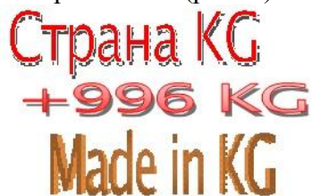
Рис. 2. Примерные зонтичные бренды для КР

Для облегчения продвижения отечественного продукта на внешних рынках и экономии финансовых средств следует разработать для Кыргызстана так называемый «зонтичный» бренд. Единый для товаров республики бренд, под которым будут представляться все экспортируемые товары Кыргызстана (рис. 2).