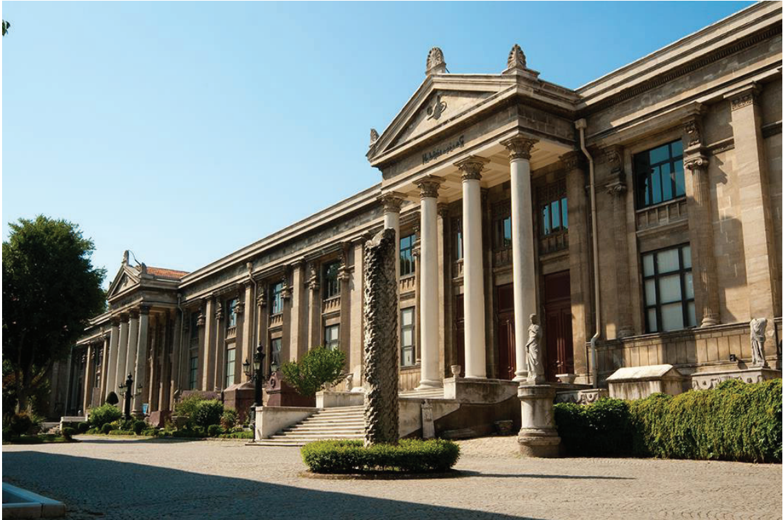
Resim 8: İstanbul Arkeoloji Müzesi, Gülhane, İstanbul.

Son kat olan üçüncü kat ise diğer katlardan oldukça farklı ve bağımsız bir üsluba sahiptir.