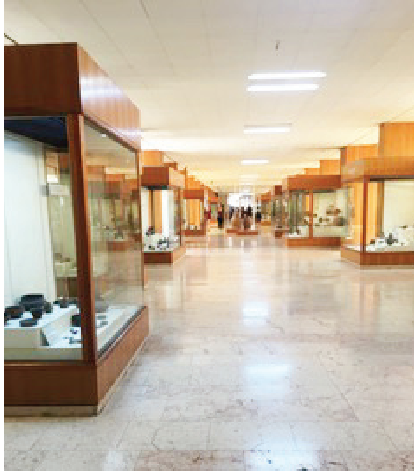
Resim 10: İstanbul Arkeoloji Müzesi, Gülhane, İstanbul, 15.05.2018

Arkeoloji Müzesi'ne genel itibariyle baktığımızda, farklı sergileme üsluplarını bir arada barındırmasıyla diğer kurumlara benzese de, içerik ve mekânın kullanımı bakımından oldukça farklı olduğunu söylemek mümkündür. Devlete ait bir kurum olmasından mütevellit, alan ve imkân genişliği bulunmasına rağmen, bir o kadar da yeniliğe kapalı ve hantal bir düzen bulunmaktadır. Özel kurumlara göre işlerin daha yavaş ilerlemesi ve bir işlem için birçok makamdan geçilmesi, mekânın değişimini güçleştirmektedir. Tüm olumsuz yanlarına rağmen içerisinde barındırdığı nice önemli eserleri, ihtişamlı mimarisi ve yeşillikler ile dolu sakin bahçesiyle, Türkiye'de bulunan en önemli müzelerden birisidir.