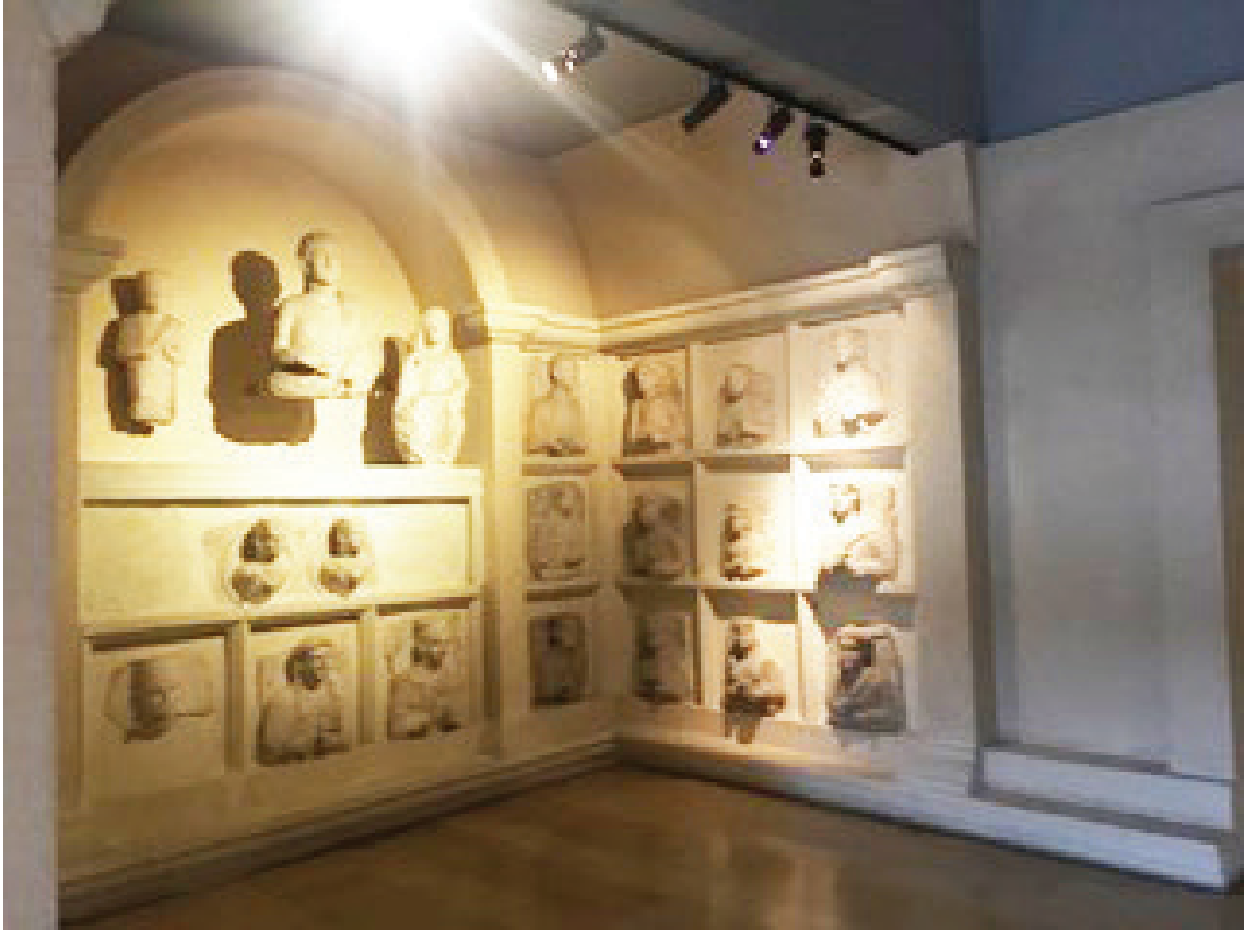
Resim 11: İstanbul Arkeoloji Müzesi, Gülhane, İstanbul, 15.05.2018

sağlanmıştır. Her iki mekânda sergilenen benzer nitelikli eserlerin farklı izlenimler yaratmasının nedeni sorgulandığında, karşımıza mekân olgusu çıkmaktadır. Kurumların mekânı kullanma şekli ziyaretçilerin hem kuruma karşı hem eserlere karşı olan yaklaşımını etkilemektedir. Daha korumacı ve daha eser odaklı sergileme pratiğine sahip bir kurumda, ziyaretçiler eserlerin daha "değerli" olduğu fikrine ulaşır, hareketlerini sınırlandırmaktadır. Zeminde kullanılan materyal, hâkim olan renkler, ışıklandırma, güvenlik personeli, kaide boyutları gibi birçok faktörün farklılığı, bu tür bir izlenim oluşturmaktadır. Bunların yanı sıra kurumun kime ait olduğu, yöneticilerin düşünce yapısı, sponsorların kim olduğu, özel veya devlet kurumu olması gibi faktörler de, mekânı etkileyen unsurlar olmuştur. Yani kurumlar mekânları, mekânlar ise ziyaretçilerin hareketlerini ve düşüncelerini doğrudan etkilemektedir.