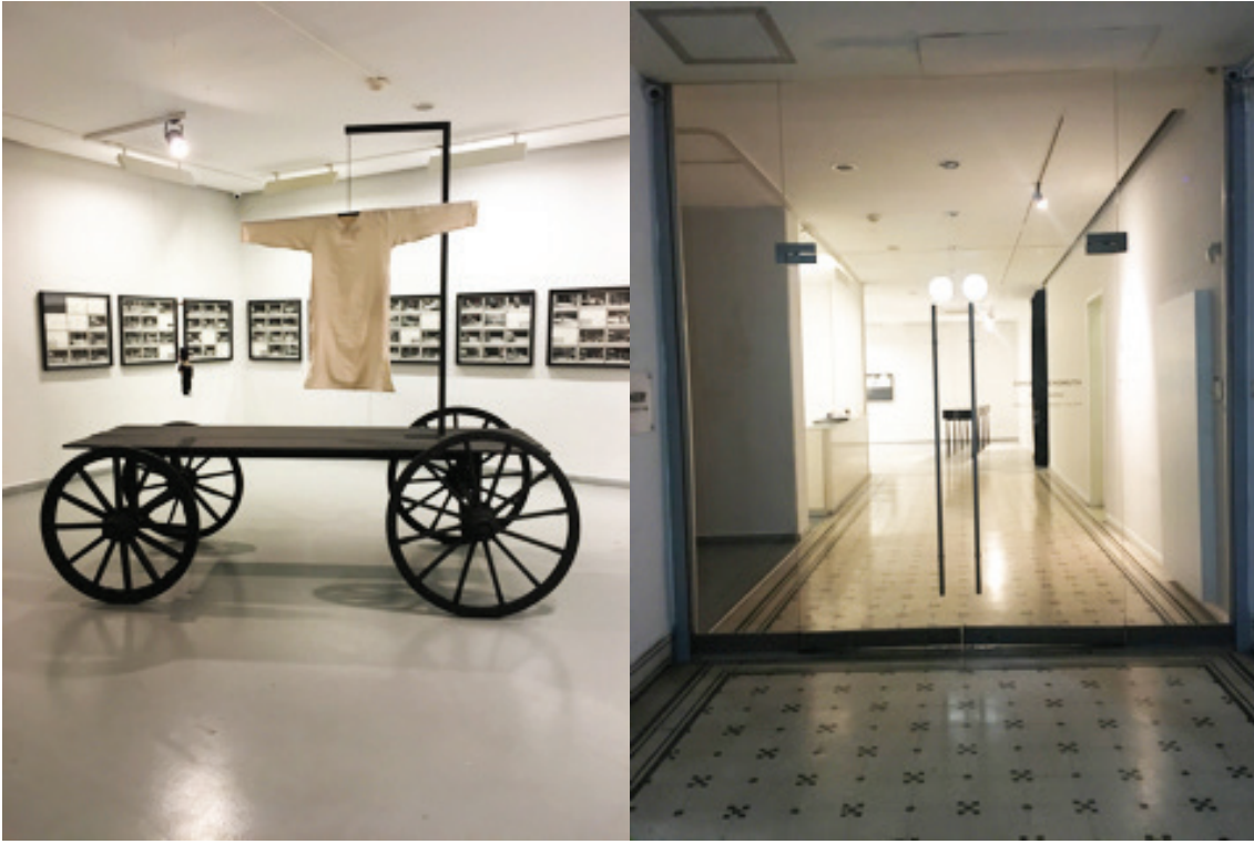
Resim 6-7: Zilberman Gallery, Beyoğlu, İstanbul, 11.05.2018

esas almıştır. Herhangi bir güvenlik elemanının bulunmaması ve çalışmalarla insanlar arasında büyük engeller olmaması, ziyaretçilerin kendini daha özgür hissetmesini sağlamaktadır.