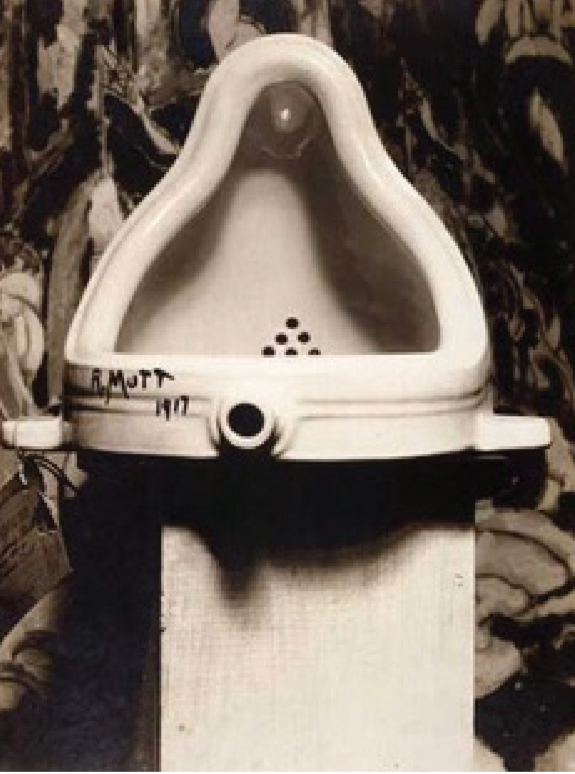
Resim 1: Marcel Duchamp, Çeşme, 1917

Yaşanan bu dönüşümün ilk tohumları 20'inci yüzyılda atılmıştır. Sanatçı bağımsızlığını kazanmış, sanat özgürleşmiş, avande-garde'lar devrimci anlayışı benimsemiş ve kendinden öncekini reddederek, var olan modern sanatı belirlemişlerdir. Bu dönemde sanatın seçkin müze mekânları reddedilmiş, sanat eserlerinin hayatın içinde bir yerlere konma düşüncesi ortaya çıkmış, sanatın algılanmasını tamamen değiştirecek olan Dada, Gerçeküstücülük, Pop Sanatı ve Minimalizm gibi sanat akımları ortaya çıkmıştır. Bu akımlarla müze mekânları sorgulanmış, sanateserive mekân ilişkisi busanat akımlarının da öncülüğünde farklı bir boyuta taşınmıştır. Sanat eserleri kapalı mekânlardan çıkıp günlük hayatın içine girmeye başladıkça, kullanılan nesnelere de günlük hayatta kullanılan materyal olmaya başlamıştır. Bu avande-garde hareketle beraber mekânın sanat içindeki yeri tartışılmaya başlanmış ve her zaman