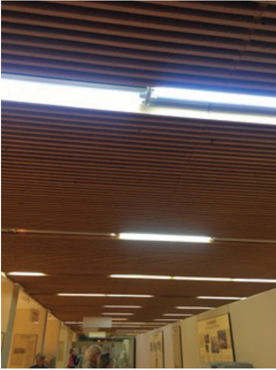
Resim 9: İstanbul Arkeoloji Müzesi, Gülhane, İstanbul, 15.05.2018

Zeminden ışıklandırmaya birçok noktasiyla sanki farklı bir binada olduğunuzu hissettiren bu katta, "Anadolu'nun Çevre Kültürleri: Suriye, Filistin ve Kıbrıs" eserleri sergilenmektedir. Aydınlatma olarak yapay aydınlatmanın kullanıldığı üçüncü katta, yalnızca spot lambalar tercih edilmiştir. Eserlerin bazıları boydan boya camekân, bazıları da kaide üzerinde konumlandırılmıştır. Katın tavanından duvarlarına kadar birçok noktada hâkim olan siyah ve koyu kahverengi renkleri mekânı ağırlaştırmaktadır. Tavanın koyu renk ve derin boşluklu kirişlerden oluşturulması ve içine spotların yerleştirilmesi, eserlerdeki odağı arttırmaktadır. Tavan içerisinde kullanılan bu spotlar yalnızca heykelleri aydınlatırken, camekânların içerisine fazladan yerleştirilen daha küçük boyuttaki spotlar parlama yapmadığı için dışardan yapılacak aydınlatmalara göre oldukça başarılıdır. Yalnızca eser odaklı olan bu sergileme tekniği sayesinde ilgi odağının dağılması önlenmiştir.