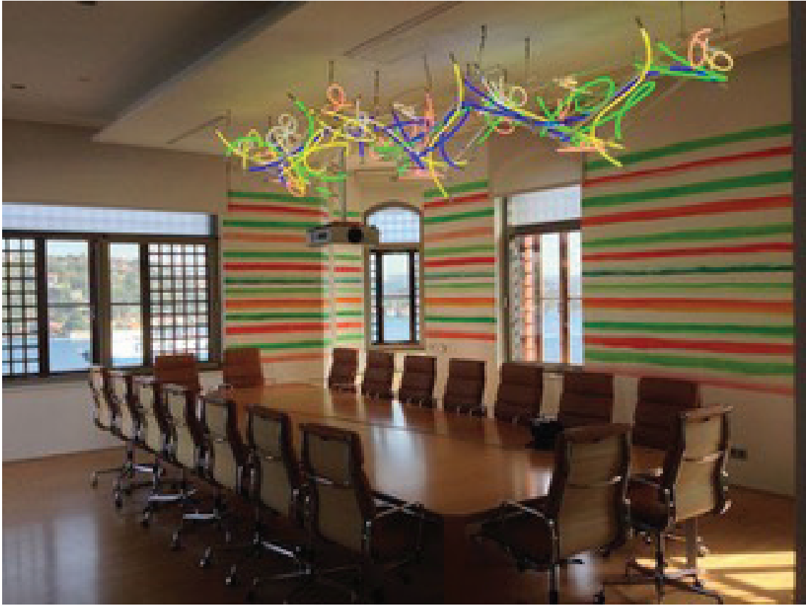
Resim 5: Borusan Contemporary, Sarıyer, İstanbul, 28.04.2018

Giriş ve Müze Café haricindeki 2 galeri katı ise tam bir müze havasındadır. Zeminden tavana, duvardan hole her noktası diğer katlardan bağımsız ve klasik bir galeri görünümündedir. Borusan Sanat'a ait olan bu katlarda güvenlik görevlisi sayısı azdır ve ziyaretçilerin hareketleri diğerleri kadar kısıtlı değildir. Çok daha serbest ve rahat olunan bu katlarda sergilenen eserlerin üslubu da farklılık gösterir. Zaten kalıcı eserlerin olmamasının yanı sıra sergileme tekniği olarak da çeşitlilik mevcuttur. Dönüşüme açık, seyyar ve portatif malzemelerin kullanılması, mekânın değişimine olanak sağlamaktadır. Kısacası Borusan Contemporary bu dokuz katlı bina içerisinde kurumsal kimliklerini, şahsi zevklerini, Kocabıyık ailesinin gücünü ve servetini gösterip, aynı zamanda ziyaretçilerine farklı dokuları tatmalarına imkân vermektedir.