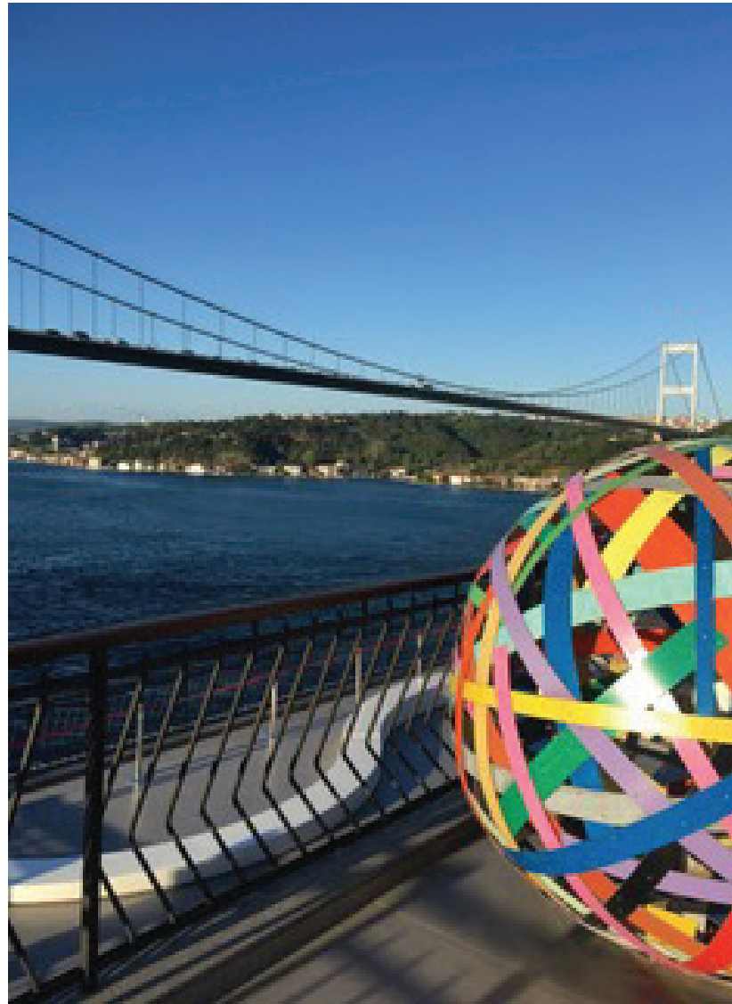
Resim 4: Borusan Contemporary, Sarıyer, İstanbul, 28.04.2018

hissetmeniz mümkün değildir. Zaten ziyaret öncesi yapılan uyarılar da bunu kanıtlar niteliktedir. Tamamı Borusan Holding'e ait olan bu katlarda herhangi bir koltuğa oturmak bile yasaktır. Sayıca fazla olan güvenlik görevlileri ise hafta içi orada çalışanların mahremine girmekte olduğunuzu göstermektedir. Ofisler içerisine yedirilmiş olan eserler arasında bir koleksiyonu tanımlayabilecek estetik ve tarihsel eklemleme yoktur. Keyfi olarak seçilmiş ve önemli bir bölümü de yerine göre sipariş edilmiş işlerdir.