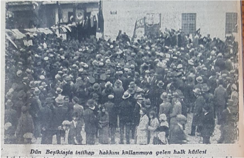
Vakit 12 Teşrinievvel 1930