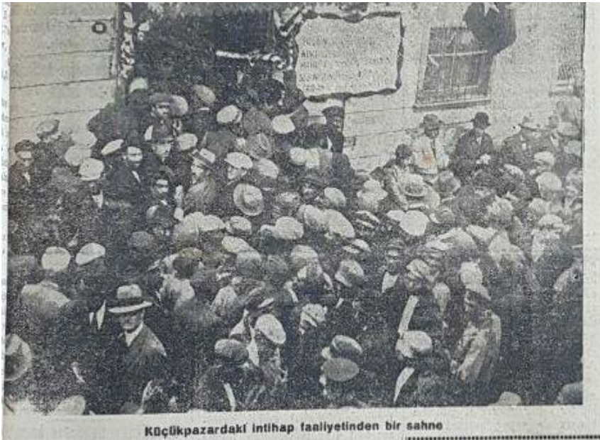
Akşam 8 Teşrinievvel 1930