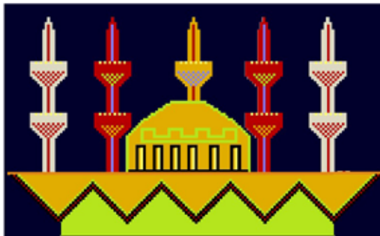
Şekil 6: Zemin 3. bölüm desen çizimi.

Halının üçüncü bölüm deseninde; çakmak-yay başı-çengel motifleriyle çerçeveselenen kare şeklinde bir göbek bulunmaktadır. Yozgat'ta tespit edilen halı yastıklarının birçoğunda da kenar suyu olarak çakmak yangışlarına (mo-