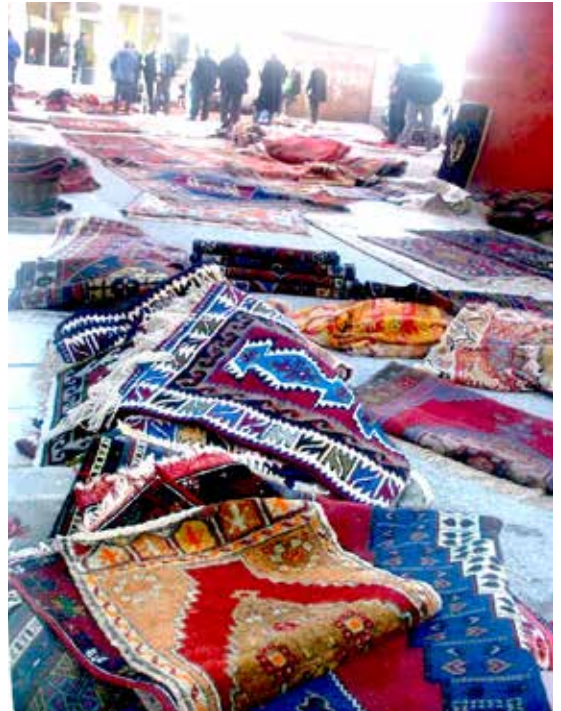
Fotoğraf 1: Niğde Halı Pazarı'ndan görünüm (23.08.2012)

Niğde ilinde perşembe günleri kurulan Niğde halı pazarı (Fotoğraf 1,2) günümüzde işlevini hâlâ devam ettirmekte olan nadir halı pazarlarından biri olması bakımından büyük öneme sahiptir. Bu pazarının tam olarak tarihi geçmişinin ne zamana dayandığı bilinmemektedir. Niğde halı pazarına üreticiler tarafından