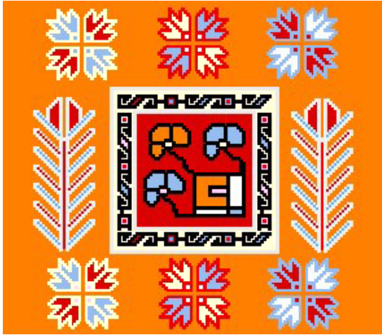
Şekil 5: Zemin 3. bölüm desen çizimi.

maklı el motifleri süslemektedir. Göbeğin çevresi sekiz adet rozet çiçeği ve on adet bağlantılı çiçekle süslenmiş bir çelenk görünümündedir. Bu göbek motifi; Niğde-Kemerhisar (Çelik, 2005: Foto. 35, 41, 42) İç ege, Orta ve Doğu Anadolu halılarında görülen (Yarmacı, 2013: 202-205), Türk halı desenleri içinde çiçekli göbek veya çiçekli göl olarak bilinen bir madalyondur (Şekil. 4, Fotoğraf. 5). Göbeğin kenar boşluklarında ise; yine kötü nazardan korun-