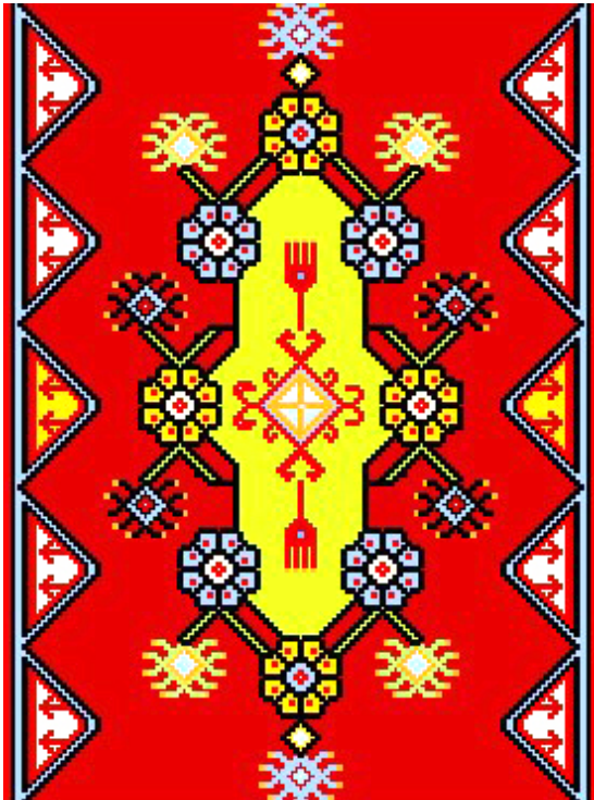
Şekil 4: Zemin 2.ve 4. bölüm desen çizimi.

Halının ikinci ve dördüncü bölüm deseninde; \frac{1}{4} simetrik raporlu çiçekli göbek ve kenarlarda muska (nüsha) motifleri yer almıştır. Göbek merkezinde kötü nazardan korunmayı simgeleyen dörde bölünmüş göz motifi, gücü simgeleyen koçboynuzu kıvrımları sınırlamakta ve dikey eksende Ehli Beyt'i simgeleyen 4 par-