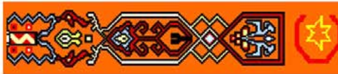
Şekil 2: Kenar suyu motifli.