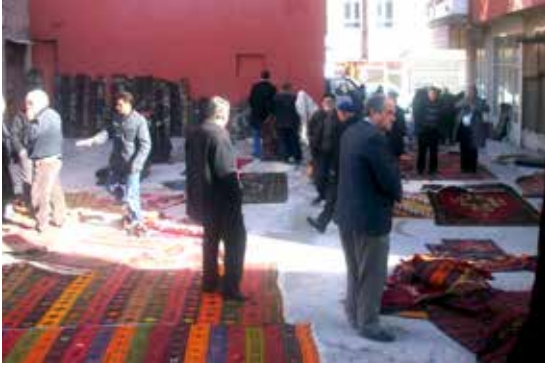
Fotoğraf 2: Niğde Halı Pazarı, ayrıntı (23.08.2012)

Halı pazarının Perşembe günleri kurulmasının en büyük nedeni, şehir pazarının da bu günde kurulmasıdır. Mevki olarak her iki pazar