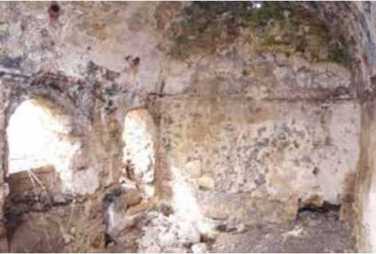
Fotoğraf 4: Beyobası Hamamı ılıklik Bölümünün Kuzey ve Batı Cephesi

Hamamın batı cephesindeki iki kapıdan, kuzey-güney doğrultusunda uzanan, 4.86 x 3.28 m. boyutlarında dikdörtgen plânlı ılıklik mekânına girilmektedir (Fotoğraf 4). Sivri beşik tonozla