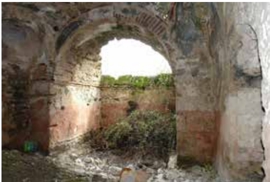
Fotoğraf 9: Beyobası Hamamı Sıcaklık Bölümü Güney Cephesindeki Eyvan

de tahribat görülmektedir (Fotoğraf 8). Aynı mekânın doğu cephe aksındaki açıklıktan su deposuna açılan pencere ile suyun kontrol edildiği anlaşılmaktadır. Orta mekânın güneyine ise buraya kemerle bağlanan ve üzeri beşik tonoz örtülü 2.89 x 2.89 m. boyutlarında tam kare plânlı eyvan eklenmiştir (Fotoğraf 9). Eyvanın beşik tonoz örtüsü tahrip olmuştur. Sıcaklık