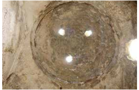
Fotoğraf 11: Beyobası Hamamı Sıcaklık Bölümü Kuzeyindeki Halvetin Kubbesi