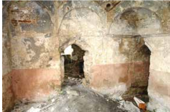
Fotoğraf 7: Beyobası Hamamı Sıcaklık Bölümü Batı ve Kuzey Cephesi

Eserin ılıklikğine doğu cephe aksında yer alan kapıdan sıcaklığa geçilmektedir (Fotoğraf 7). Hamamın sıcaklığı, kuzey-güney doğrultusunda enine düzenlenmiş bir plâna sahiptir 7 . Mer-