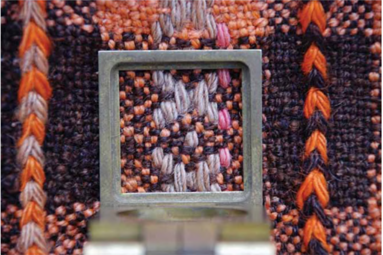
Foto 8. Gökmendil (Çözümlü Çekim-Ölçülü Çekim-Fadime Yıldırım) Temmuz 2009