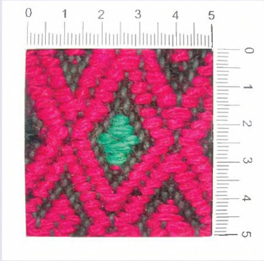
Foto 9. Cicim Tekniği