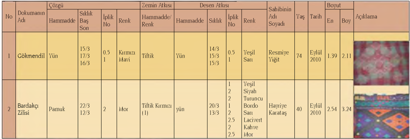
Şekil 1. Tablo 4. Bardakçı ve Gökmendil Örnekleri 2010