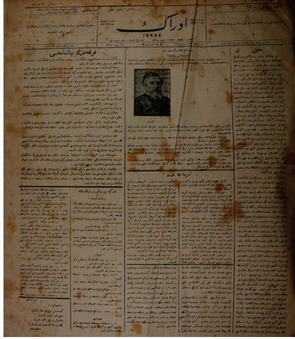
İdrak, 28 Nisan 1919, No: 1