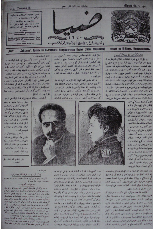
Ziya, 19 Kânunusani 1921, No:9