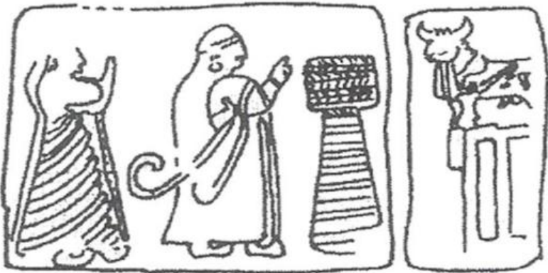
Çizim 7: Alacahöyük Kent Duvarı Kapısının Solundaki Kabartmalı Orthostat (Baltacıoğlu, 1995: res. 1.1).

Alacahöyük Kent Duvarı Kapısının Solundaki Kabartmalı Orthostat (çizim 7), boğa biçimli bir tanrıya tapınan kral ve kraliçe tasvirinden oluşur (Macqueen, 2001: 159). Kral yuvarlak başlıklı, uzun mantolu ve ucu kıvrık ayakkabılı gösterilmiştir. Hitit Kralı elini kaldırarak dua ya da tapma jestinde bulunurken, sağ eliyle de lituus tutmaktadır (Alp, 1999: 14).