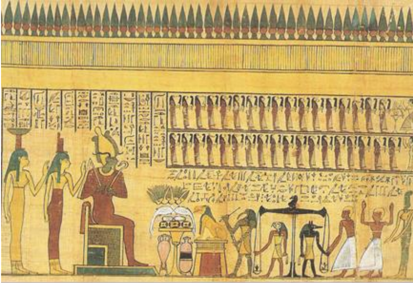
Resim 1: Tanrı Osiris (Robins, 1997: fig. 31).

Eğri asanın ilk tasviri ise Mısır'da MÖ 4. binin sonlarına tarihlenen fildişinden bir bıçak üzerinde görülmektedir (Hayes, 1953: fig.21). Frizde, erkek figürlerin bazılarının, omuzları üzerinde eğri asa yer alır. Mısır'da eğri asanın kendisi ve tasvirleri erken dönemlerden beri görülmektedir. Özellikle MÖ 3. bin ve 2. binde eğri asa kullanımı artmaktadır (Lumsden, 1992: 107). Mısır'da Tanrı Osiris'in (resim 1) atribütü olan eğri asanın, erken dönemlerde kabile reislerince, daha sonra Osiris'in yaşayan kişilikleri de olan firavunlarca taşındığı görülür (Hayes, 1953: fig.117).