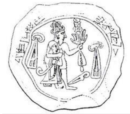
Çizim 10: III. Murşilili'nin Mühür Baskısı (Alp, 2000: 174)