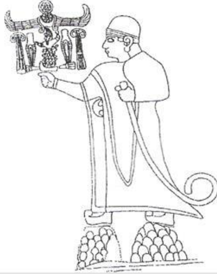
Çizim 4: Yazılıkaya 64 no'lu Kabartma (Bittel et al., 1967: 64; Darga, 1992: 164).

Yazılıkaya 81 no'lu kabartma (çizim 5) tanrının kralı kucaklama sahnesinden oluşur (Bittel et al., 1967: 25; Darga, 1992: 167). Kabartmadaki kral ve tanrı kartuşlarına göre tanrı, Şarumma; kral, Tuthalya'dır (Bittel et al., 1967: 25). Kralın sağ kolunun koltuk altında, aynı tanrınıninki gibi, kılıcının hilal kabzası görülür. IV. Tuthalya sol eliyle lituus tutmaktadır ve yuvarlak başlıklı, uzun mantoludur.