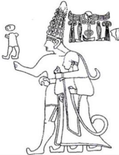
Çizim 5: Yazılıkaya 81 no'lu Kabartma (Bittel et al., 1967: 25; Darga, 1992: 167)

Yazılıkaya 81 no'lu kabartma (çizim 5) tanrının kralı kucaklama sahnesinden oluşur (Bittel et al., 1967: 25; Darga, 1992: 167). Kabartmadaki kral ve tanrı kartuşlarına göre tanrı, Şarumma; kral, Tuthalya'dır (Bittel et al., 1967: 25). Kralın sağ kolunun koltuk altında, aynı tanrınıninki gibi, kılıcının hilal kabzası görülür. IV. Tuthalya sol eliyle lituus tutmaktadır ve yuvarlak başlıklı, uzun mantoludur.