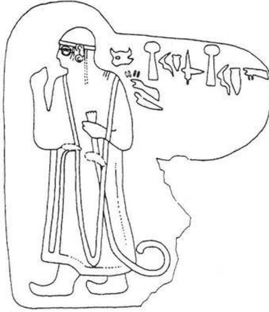
Çizim 3: Sirkeli Kaya Anıtı (Akurgal, 1995: şek.64; Bittel et al., 1967: 25; Darga, 1992: res. 178).

Yazılıkaya 64 no'lu Kabartma'da (çizim 4) Yazılıkaya A odası büyük galeride, ana odanın giriş kısmının sağında tanrı alayı kabartmasının karşısında yer alır. Kabartma üzerinde bir erkek figürü bulunur (Bittel et al., 1967: 64; Darga, 1992: 164). Figürün sağ elinde yer alan kartuşunda Büyük Kral Tuthalya yazmaktadır (Bittel et al., 1967: 93). Kral yarım daire biçiminde bir başlık takmaktadır. Yumruk biçimindeki sağ eli elinin başparmağı ileri uzatılmış biçimdedir. Kral sol eliyle lituus tutar. Lituusun kabzası avucunun üst kısmından taşar şekilde gösterilmektedir. Kral, eski yakın doğuda yaygın olan pullu iki dağın üzerine basar şekilde ayakta durmaktadır (Bittel et al., 1967: 93). Bu kral figürü galerinin en büyük kabartmasıdır (Akurgal, 1995: şek.45). Kral IV. Tuthalya'nın (1237-1209) buradaki tasvirinin öldükten sonra mı ya da ölmeden önce mi yapıldığı tartışmalıdır. Kral burada öldükten sonra tanrılaştırmış olarak tanımlanmıştır (Alp, 1948: 308; Bossert, 1957: 97-98). Ancak Ensart (2005b: 33), IV. Tuthalya'yı Yazılıkaya 34 numaralı figür gibi Güneş Tanrısı ünvanlı hüküm süren kral olarak yorumlamıştır.