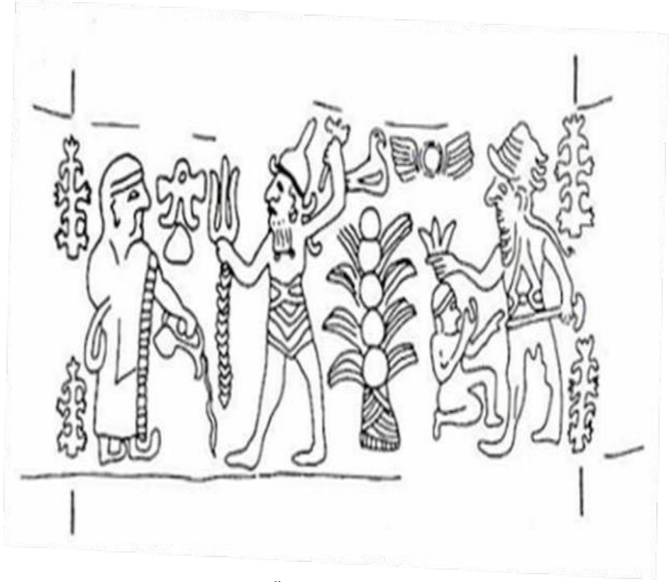
Çizim 8: Bir Küp Üzerindeki Hitit Silindir Mühür Baskısı (Uzunoğlu, 1979: abb 2).

Bir Küp Üzerindeki Hitit Silindir Mühür Baskısı, iki sahneden oluşur (çizim 8). Soldaki sahnede bir Hitit Kralı elindeki gaga ağızlı testiyle hava tanrısının önünde libasyon yapmaktadır (Uzunoğlu, 1979: 180). Sağda ise bir tanrının önünde diz çökmüş küçük bir adamın tapma sahnesi yer alır (Uzunoğlu, 1979: 180). Sol başta libasyon yapan kral tören giysisi ile ayakta durmaktadır. Figür bol ve uzun bir manto giyer ve mantonun altında gizlenmiş olan sağ elinde lituus tutar (Uzunoğlu, 1979: 180). Lituusun ucu alışıageldiği gibi dışa değil, içe doğru kıvrılmıştır (Uzunoğlu, 1979: 180). Bunun sebebi, mührü yapan zanaatkârın lituusta yaptığı bir mantık hatası olmalıdır.