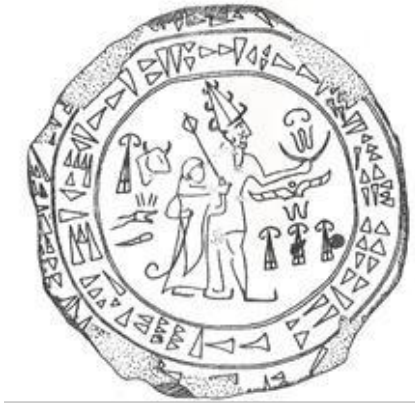
Çizim 9: II. Muvatalli'nin Mühür Baskısı (Beran, 1967: Taf. 12, 250a)

II. Muvatalli 5 (çizim 9) ve kralın oğlu olan III. Murşili 6 (çizim 10) damga mühür baskıları birbirine oldukça benzemektedir. İki mühür baskısında da tanrı uzun boynuzlu, konik başlıklı ve kısa eteklidir. Kral uzun elbiselidir ve sol eli ile fırtına tanrısını tutarken, sağ eliyle de lituus tutmaktadır (Alp, 2000: 174; Gonnet, 1990: 9.) Baskıların üzerinde tanrı ve kralların isimleri yazmaktadır (Alp, 2000: 174; Gonnet, 1990: 9).