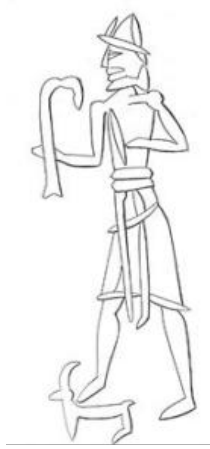
Çizim 1: Tanrı Amurru.(Black & Green, 2003: 130/106).

Suriye Sanatı'nda eğri asa yaklaşık olarak Asur Ticaret Kolonileri Çağı ve biraz sonrasına denk gelen Eski Suriye Dönemi'yle (MÖ 1850-1620) sınırlıdır (Lumsden, 1992: 107). Suriye, bu çağlarda, Kuzey Mezopotamya şehirleriyle, Babil ve Anadolu ile ticari, politik ve sosyal ilişkiler içindeydi. Eski Suriye Dönemi Mühürleri'nde kanatlı güneş kursu ve anka gibi Mısırlı motiflerin bulunması Suriye'nin Mısır ile olan ilişkileri ile ilgilidir (Collon, 1983: 253).