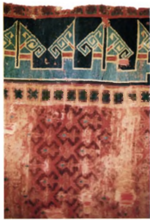
Resim/Picture 4 Resim/Picture 5