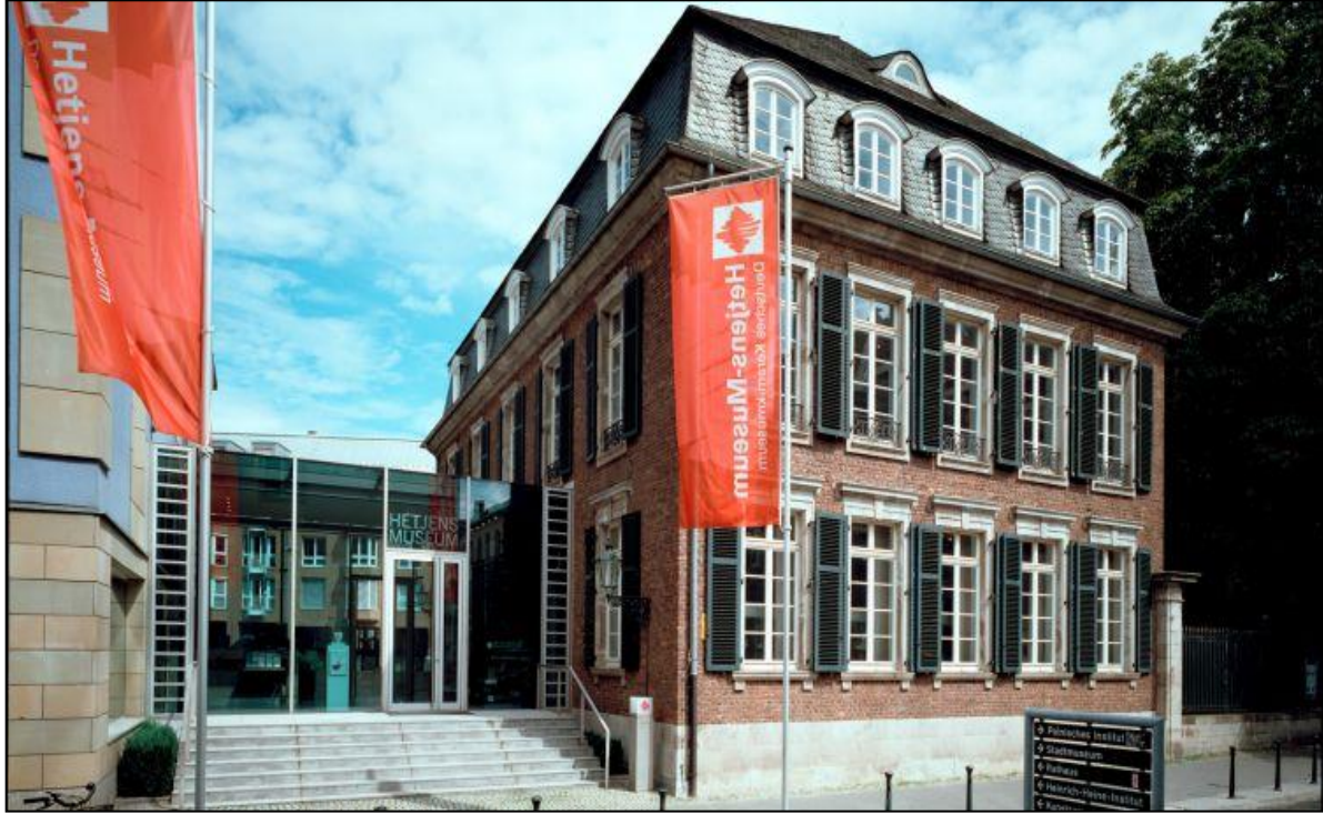
Görsel 30. Hetjens Seramik Müzesi

Hetjens Müzesi 1830-1906 yılları arasında yaşayan sanayici ve sanat koleksiyoncusu Laurenz Heinrich Hetjens'in mirasına dayanarak 1909 da belediye müzesi olarak açılmıştır (Görsel 30). Müzenin kuruluşunda diğerleri yanında, Ren stoneware koleksiyonu mevcut müzenin temelini oluşturmaktadır. Yıllar geçtikçe, 8000 yıllık seramik tarihini sunmak için müze, bağış ve seçici alımlar vasıtası ile genişletilmiştir. Tüm kıtalardan seramik ürünler bir çatı altında birleştirilerek, eşsiz bir müze geliştirilmiştir.