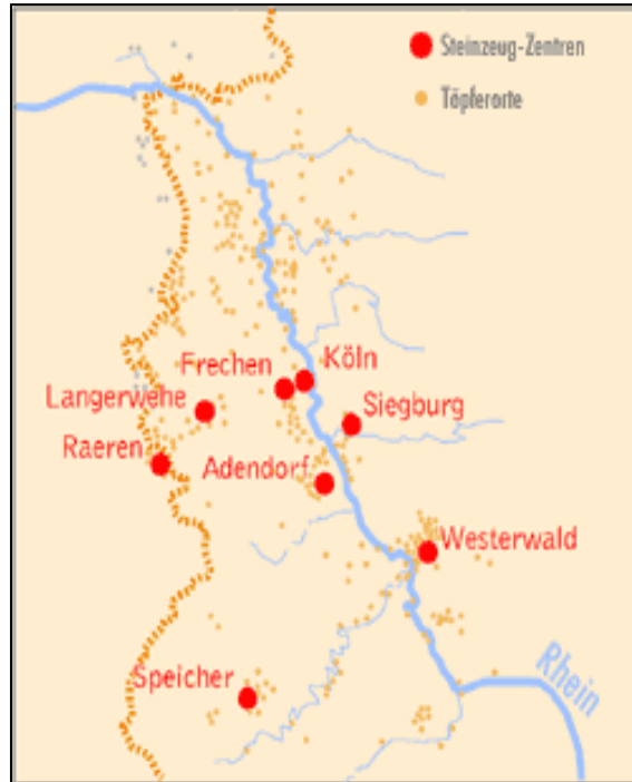
Görsel 14. Ren Bölgesi Seramik Üretim Merkezleri

Müze koleksiyonu, diğer Rhenish üretim merkezleri Siegburg, Köln, Frechen, Westerwald, Langerwehe (Görsel 14) ve Doğu Alman stoneware tarihi çanak çömleklerin yanı sıra Roma çanak çömleklerini de içermektedir. Ayrıca müze, yıllık Euregio Seramik Piyasasından yeni alımlarla çağdaş seramik koleksiyonunu sürekli olarak genişletmektedir (URL-6, 2018).