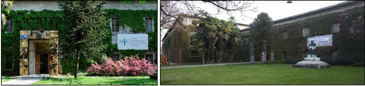
(URL-11, 12, 2018)

Müzedeki dünya seramiklerinden örnekler bir sistematik içerisinde izlenebilmektedir. Koleksiyonlar aşağıdaki gibi gruplandırılmıştır (URL-13, 2018):