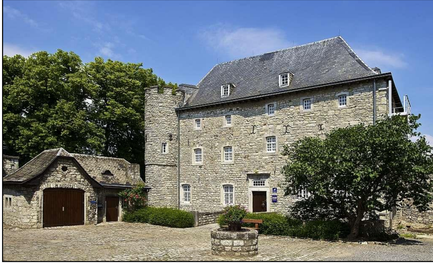
Görsel 13. Töpferi Museum Raeren, Raeren Kalesi

Belçika'da 14. yüzyılda inşa edilmiş olan tarihi Raeren Kalesi 1963'ten beri Raeren Seramik Müzesi olarak ziyaretçilerini karşılamaktadır (Görsel 13). Müzenin koleksiyonunu, 20. yüzyılın ikinci yarısından bu yana Raeren'de çıkan arkeolojik buluntular oluşturmaktadır. 14. yüzyılın sonundan beri farklı kullanımlara yönelik stoneware çeşitliliğine genel bir bakış sunan tek kurumdur (URL-6, 2018).