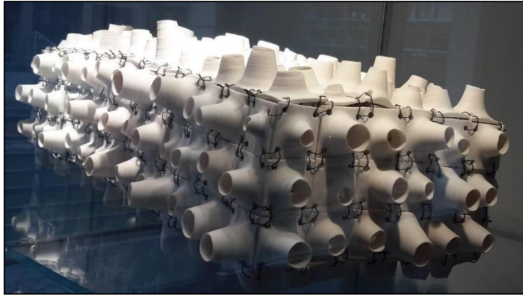
Görsel – 54, 55, 56: Ursula Commendeur (1958), Porselen, 2011, 2017