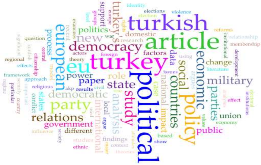
Şekil 3: Özetlerde En Sık Kullanılan 5 Sözcüğün İlişki Şeması.