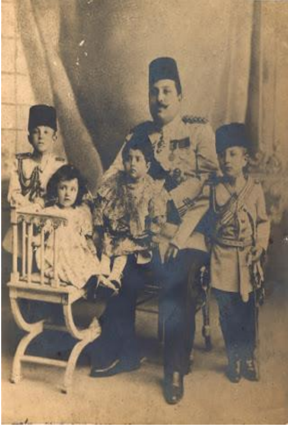
Fehim Paşa'nın çocukları ile bir fotoğrafı.