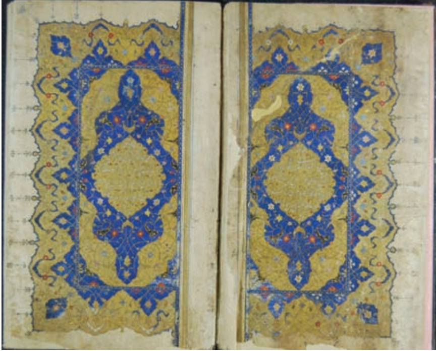
Resim 6- A.Ü. DTCF Kütüphanesi / Üniversite A – 65 “Şemse biçiminde ortası yazılı, tıgılı, tamamı tezhipli zahriye sayfaları”

asla yeterli görülemez. Çünkü tezhip, özellikle Osmanlı dönemi yazma eserlerinde yüzyıllar boyunca farklı tür ve ekollerle gelişim göstermiş, esere en zahmetli çalışmaların ürünü olarak sanatsal değer kazandırmıştır.