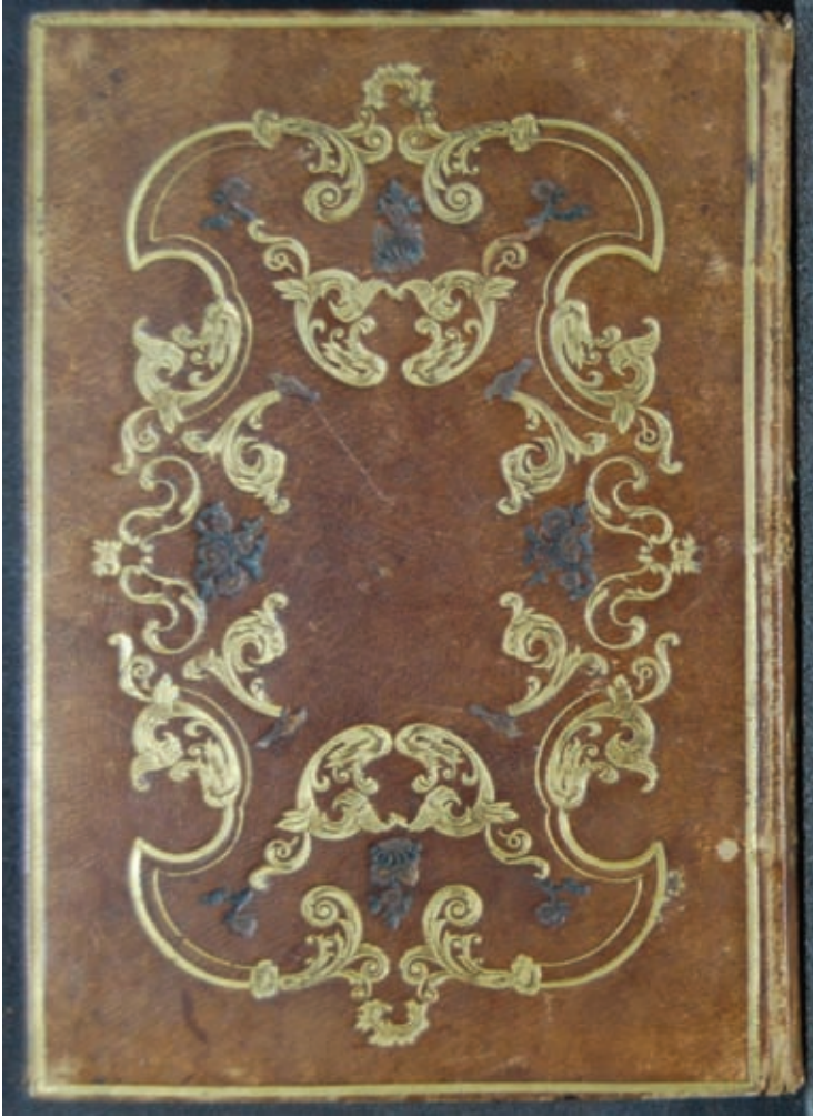
Resim 5- A.Ü. DTCF Kütüphanesi / Üniversite A -353 "Barok üslupta müzehhep motifli, açık kahverengi meşin kaplı mukavva cilt / XIX. yüzyıl"

XIX. yüzyılda şemseli cilt sayısı azalmış, zilbahar (kafes) ciltler yaygınlaşmıştır. Ayrıca basılı eserlerin çoğalmasıyla, Batı tarzı deri ciltler yanında Yıldız cildi denilen, bir yüzüne altın yıldızla Osmanlı sanat arması, diğerine ay yıldız basılı deri, atlas ve kadife ciltler yapılmıştır. Ancak bunların sanat kalitesi oldukça düşüktür. XIX. ve XX. yüzyıllarda klasik Osmanlı ciltleri az da olsa yapılmışsa da zaman içerisinde bu güzel ciltlerle olan bağlantı kopmuştur (Balkanal 2002:343).