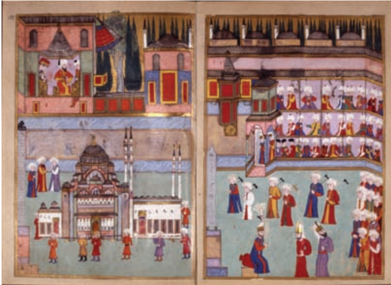
Resim 12- Topkapı Sarayı Müzesi Kütüphanesi H-1344 190b/191a "Surname-i Hümayun- Minyatürlü sayfa örneği"

III. Ahmet'in saray başnakkası Levni'nin eserleri dikkate şayandır. Levni'nin eserlerinde görülen renkler pastel ve ahenklidir. Harikulade şekil ve çizgi güzelliği göze çarpmaktadır. Klasik resimlerle Levni'nin eserleri karşılaştırılacak olursa Levni'nin Türk minyatüründe kendine özgü bir ekol olan özel bir sanatçı olduğu görülür. Levni'nin başyapıtı Sultan III. Ahmet'in şehzadelerinin sünnet düğünü şenliklerini anlattığı Vehbi'nin eseri "Surname"deki resimlerdir (Güney 2001:113). İki boyutlu yüzeysel anlatımdan üç boyutlu hacimli anlatıma geçişi Levni'den daha ileriye taşıyan sanatçı ayrıca gül, lale gibi çiçek resimleri de yapmıştır. Eserlerinde özellikle figürlerin yüzlerinin işlenişinde Batı etkisiyle boyut kazandırmaya çalıştığı görülür ( Adım Adım Osmanlı Tarihi... 2003: 95). XVIII. yüzyılın sonları ve XIX. yüzyılın başlarında Osmanlı saray çevresinin resmi kıyafetlerini gösteren ve suluboya tekniğiyle yapılmış resimleri içeren birtakım albümlerin de hazırlandığı görülür (Renda 1981: 52-56). Batı'ya açılışın yoğunlaştığı Lale Devri'nde minyatür sanatında Batı resmi tarzında ilginç gelişmelere tanık olunur. Bu yüzyılın sonunda tutkallı toprak boyanın, guvaş ve suluboyayla yer değiştirmesiyle birlikte bazı yazma eserler geleneksel minyatür sanatını sonlandıran tekniklerle resimlendirilmiştir. Osmanlı minyatür sanatı bu dönemden sonra özelliğini ve güncelliğini yitirerek yavaş yavaş yerini Batı resim tekniğiyle yapılmış yağlıboya tablolara bırakmıştır.