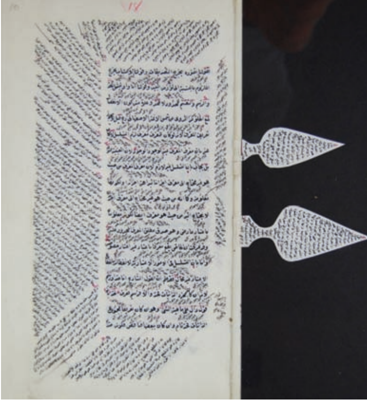
Resim 20- A.Ü. DTCF Kütüphanesi Üniversite A- 268 “Şukka’lı yazma eser sayfası”

karşımıza çıkmaktadır. Eserde şukkaların yer aldığı kısımlar ve hatta şukka şekilleri katalog kaydının notlar alanında belirtilmelidir.