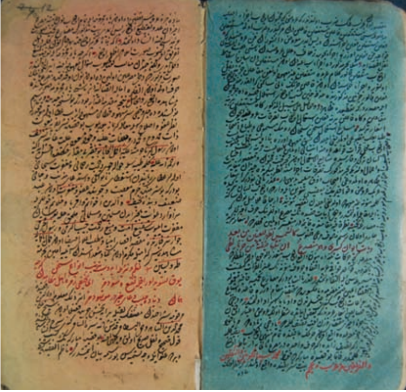
Resim 13- A.Ü. DTCF Kütüphanesi / Üniversite A-76 “Renkli sayfalarından oluşan yazma eser sayfaları”

Katalog kayıtlarında çoğu kez tespit ya da tahmin edilemediği için boş bırakılan “kağıt türü”nü kesin olarak saptayabilmek oldukça zordur. Yazma eserin üretildiği ya da yazıldığı dönem, nerede yazılmış olduğu bilgisi veya eğer kağıt filigranlı ise filigranın yazısı, şekilleri kağıt türü hakkında bilgi verebilir. Bazen de tersi bir durum söz konusudur kağıdın türü ve döneminden hareketle yazma eserin hangi döneme ait olduğu bilgisine ulaşabilir.