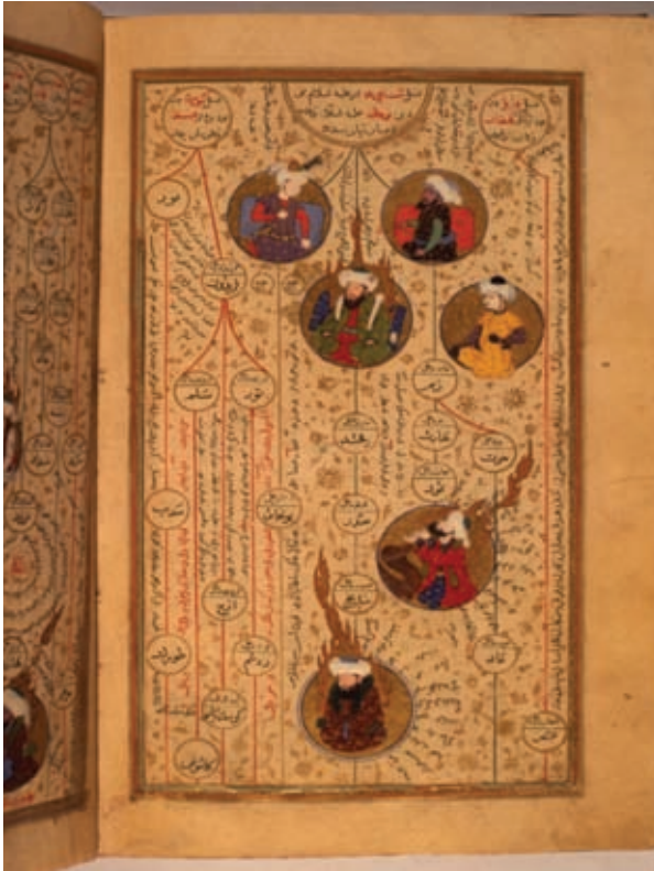
Resim 11- Topkapı Sarayı Müzesi Kütüphanesi H-324-21b “Silsilename -Minyatürlü sayfa örneği”