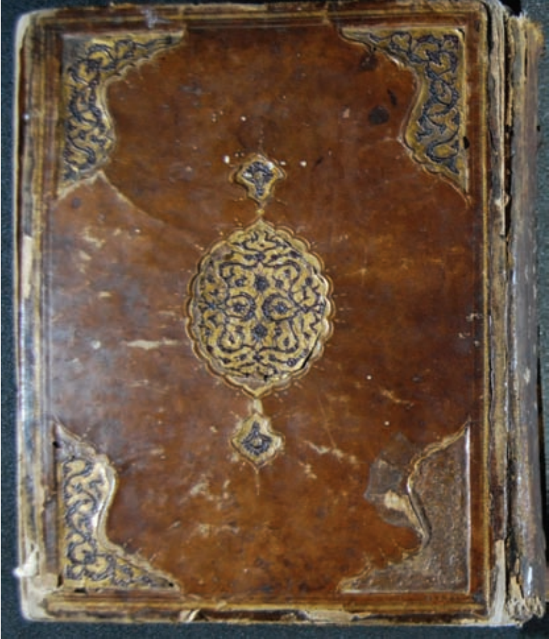
Resim 1- A.Ü. DTCF Kütüphanesi / Üniversite A-139 "Altın yıldız gömme salbek şemseli, köşebentli, kahverengi meşin kaplı mukavva cilt / XVI. yüzyıl"

şemse ve diğer bezemeler bu yüzyılda daha çok parçalı olarak hazırlanmış, bu parçalı şemse, salbek ve köşebentler, alttan ve üstten ayırma motiflerle süslenmiştir. Klasik Türk ciltlerinde şemse ile köşebentlerin arasındaki kısım genellikle boş bırakılmış, az sayıda ciltte bu kısım süslenmiştir. Bu yüzyılda iç kapak süslemeleri de zenginleşmiştir. XV. yüzyılın katı'a süslemeleri, biraz incelenerek ve motif zemininde altın yanı sıra renkli deri de kullanılarak, XVI. yüzyılda da devam ederken; bazı ciltlerde dış kapaktaki bütün süslemeler iç kapakta da aynen uygulanmış, ama iç kapak için farklı renkte bir deri seçilmiştir (Özen 1998: 17-18).