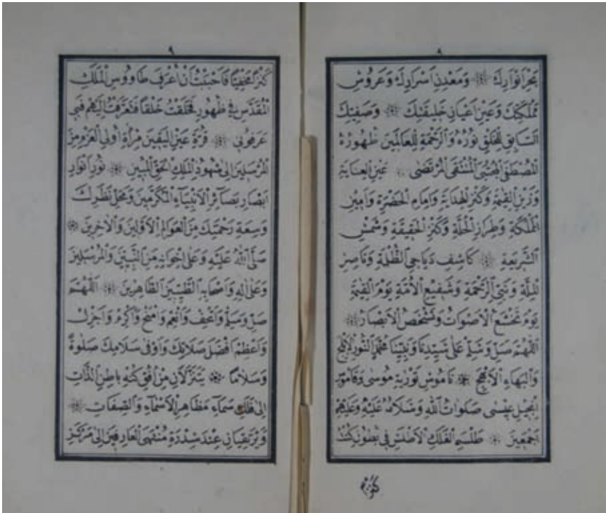
Resim 18- A.Ü. DTCF Kütüphanesi Mustafa Con A- 623 “Rakabe/takip kelimesine sahip, nesih hattı ile yazılmış yazma eser sayfaları”

Birçok eski metinde mürekkep solgunlaşmış (buharlaşmış) ve pembeye yakın bir renk almıştır. Ancak bu durum mürekkebin kalitesine göre de değişebildiği için mürekkep kesin bir kriter olarak düşünülemez. Bazen de mürekkebin rengi önemli bir ipucudur. Çok eski yazma eserlerde kırmızı ve