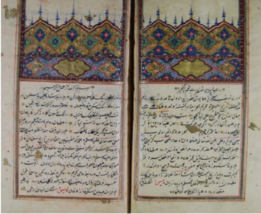
Resim 8- Mustafa Con A- 565 “Altın yıldız cetveli, tıgılı, mihrabiyele, tamamı tezhipli serlevha”

XVI. yüzyıl eserlerinde diğer motiflerle birlikte özellikle yekberk motifinin ve çintemani ile piçide (sarılma) rumi motiflerinin zengin kullanım alanı bulunduğu görülür. Mevcut üslupların yanında çift tahrir ve havalı diye adlandırılan ve küçük helezonlar üzerine ufak hatayı motifleriyle meydana getirilen yeni bir tarzın ortaya çıktığı bilinmektedir ( Hat ve Tezhip Sanatı 2009: 350).