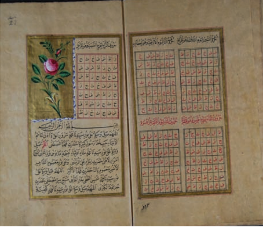
Resim 9- A. Ü. DTCF Kütüphanesi / Mustafa Con A- 400 “Gül tezhipli, altın yaldız cetvelli fihrist örneği”

Serlevha tezhibi, düz başlık şeklinde, kubbeli, dilimli, taç desenli, tepelikli mihrabiye gibi farklı kompozisyonlarda karşımıza çıkabilir. Fatih döneminde serlevha tezhibi sayfanın enine uzanan dikdörtgen formdadır ve çevresinde bitkisel motifler ile geçmeler bulunur. XVIII. yüzyıldan sonra ise özellikle dini kitap serlevhaları taç tezhibi şeklinde düzenlenmiş olup, bazen de çiçek buketleri ile süslenmiştir (Özkeçeci ve Özkeçeci 2007: 157).