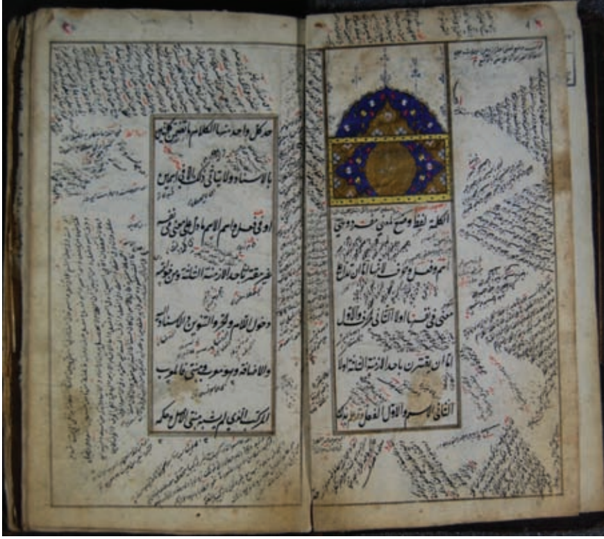
Resim 21- A.Ü. DTCF Kütüphanesi Üniversite A-217 "Yıpranmış, su almış yazma eser sayfaları"

Türkiye yazmaları veritabanı incelendiğinde kataloglama sürecinde yazma eserlerin sanatsal özellikleri çoğunlukla göz ardı edilmiştir. Türkiye yazmaları veritabanında cilt özelliklerini tanımlama konusunda her kütüphanenin farklı bir uygulama içinde olduğu görülmektedir. Katalogların yalnızca küçük bir bölümünde cilt tanımlamalarına yer verilmiştir. Bu durumda yazma eserlerin cilt özellikleri konusunda araştırma yapmak isteyenler kataloglardan bu açıdan yararlanamamaktadır.