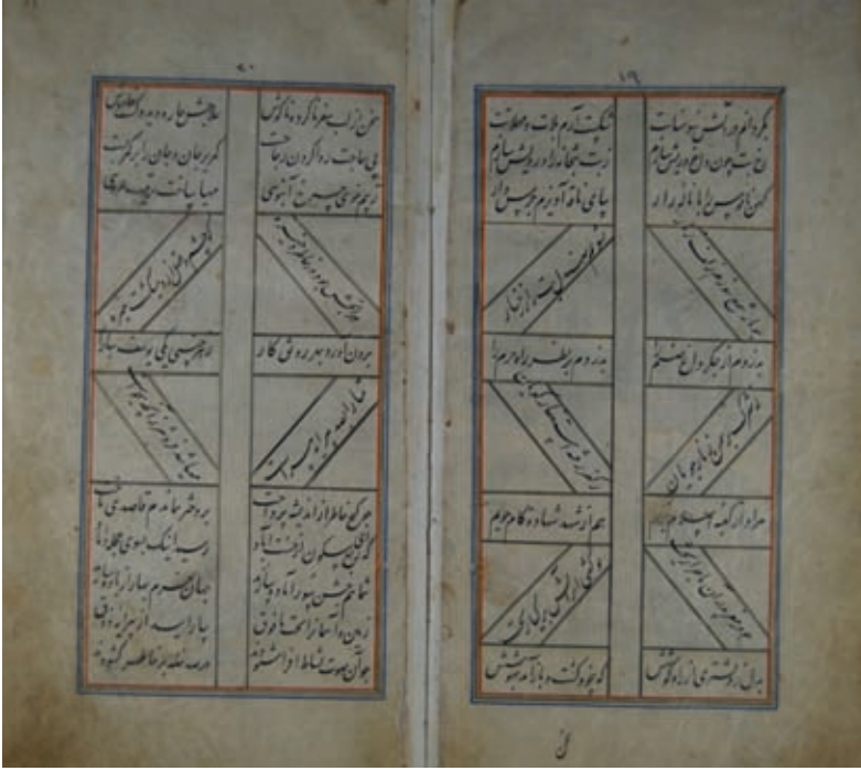
Resim 15- A.Ü. DTCF Kütüphanesi /Mustafa Con A 532 “Geometrik şekilli satır ve sütun düzenine sahip yazma eser sayfaları”

bu sanatın kutsal bir sanat sayılmasına neden olmuştur. Özellikle Osmanlı kültürü içinde hat sanatı çok ilerlemiş, işlevsel görevinin yanı sıra, estetik bir düzeye yükselmiş, adeta Batı resim sanatındaki tabloların yerini tutar olmuştur.