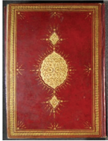
Soldaki Resim 3- A.Ü. DTCF Kütüphanesi Üniversite A-205 "Deffeleri müzehhep salbek şemseli, zencirekli, köşebentli kırmızı meşin kaplı mukavva cilt XVIII. yüzyıl" Sağdaki Resim 4- A.Ü. DTCF Kütüphanesi / Üniversite A -157 "Gömme salbek şemseli, encirekli, deffesi bordo meşin kaplı mukavva cilt / XVII. yüzyıl"