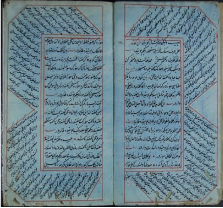
Resim 19- A.Ü. DTCF Kütüphanesi Üniversite A -312 "Derkenarlı yazma eser sayfaları"

siyah renklerin kullanıldığını görürüz. Yeşil ve mavi renkler XIV. yüzyılda kullanılmaya başlanmıştır (Okuyucu 2008).