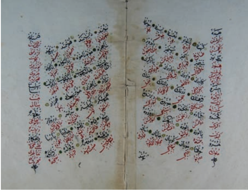
Resim 14- A.Ü. DTCF Kütüphanesi A -193 "Çam ağacı biçiminde satır düzenine sahip yazma eser sayfaları"

1.6. Sayfa, Satır ve/veya Sütun Sayısı (Düzeni): Eserin metin kısmında bir sayfadaki (yazı alanı içindeki) satır sayısı da kayda geçirilmelidir. Satır sayıları değişkenlik gösteriyorsa en çok tekrar edilen rakam yazılabilir ya da bölüm bölüm kaç satırdan oluştuğu ayrı ayrı yazılır. Manzum (dörtlük, beşlik, ikilik olarak yazılan şiir kitapları) Yazma eserlerde sütun sayısı da kaydedilmelidir. Sütun sayıları değişkenlik gösteriyorsa en çok tekrar edilen rakam yazılabilir veya bölüm bölüm kaç sütundan oluştuğu ayrı ayrı yazılır.