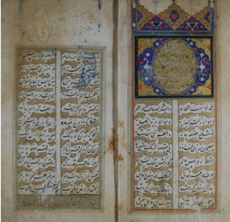
Resim 7- A.Ü. DTCF Kütüphanesi / Mustafa Con A-519 "Altın yaldızlı, madalyon biçiminde ortası yazılı, mihrabiyele, cetvelli, tığlı, müzeyyen ve müzehhep serlevha"

Kanuni dönemi birçok yeni üslubun, motifin ve sayfa kenarı süslemeciliğinde yeni tekniklerin uygulandığı zengin bir dönemdir. Ayrıca saz üslubu da yine bu dönemde çıkmış ve gelişmiştir (Demirağ 2007: 86).