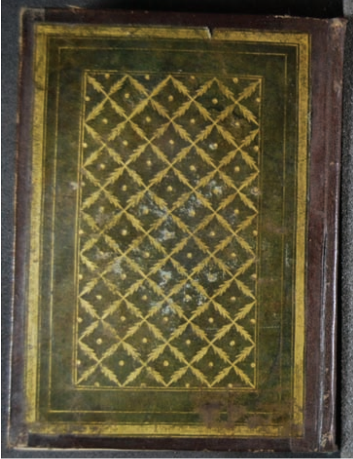
Resim 2- A.Ü. DTCF Kütüphanesi/ Üniversite-A 419 "Sırt ve kenarları kahverengi meşin, deffesi kafes desenli, zencirekli yeşil meşin kaplı mukavva cilt / XVII. Yüzyıl"

Yazma eserlerde XVI. yüzyılda kullanılan malzeme sahtiyan (keçi derisi) ve meşindir (koyun derisi). Ceylan ve deve derileri de kullanılmakla beraber, en çok sahtiyan tercih edilmiştir. Renk olarak siyah ve kahverenginin çeşitli tonları yanında, kırmızı, vişne, yeşil, mavi ve mor kullanılmıştır. İlk örnekleri XV. yüzyılda görülen mukavva üstüne kumaş kaplı ciltler, XVI. yüzyılda daha da güzelleşmiştir. Kırmızı atlas kumaş mukavvaya kaplanmadan önce deri ciltlerin motifleri ile işlenirdi. Zerduzi 14 denilen bu kaplarda motifler cilt ustası tarafından çizilirdi (Aslanapa 1982: 15).