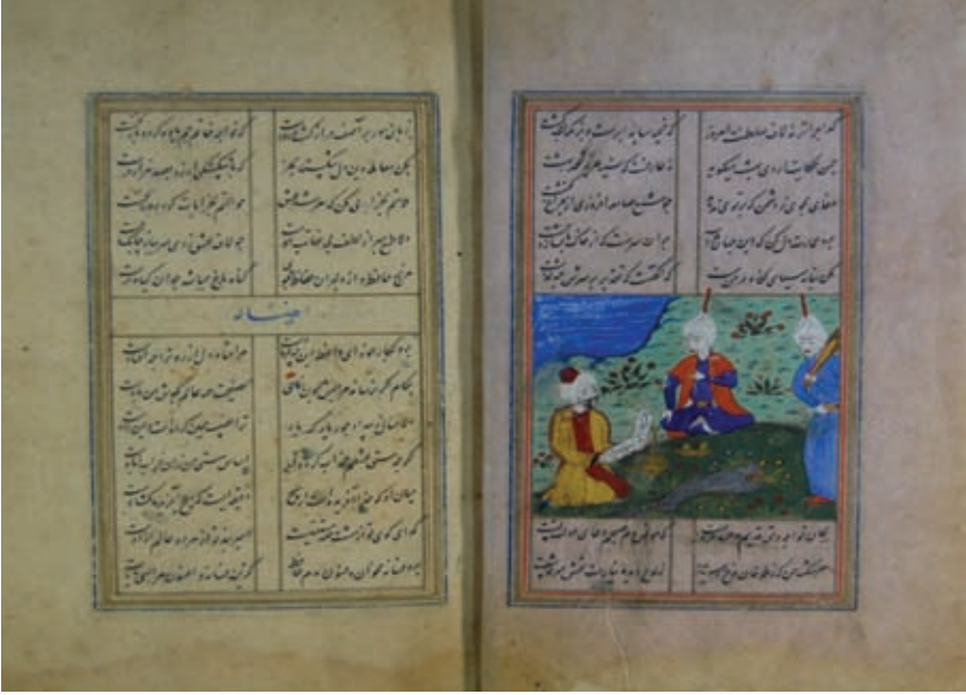
Resim 10- A.Ü. DTCF Kütüphanesi / Üniversite 262 / 24b "Divan-ı Hafız - Minyatürlü sayfa örneği"

Sultan Mehmet döneminde yapılmış birçok minyatürlü eser, Türkmen minyatürlerinin etkisini göstermektedir. Bu eserler dönemin giyim, müzik aletleri ve eğlence hayatı gibi bazı özelliklerini de yansıtır.