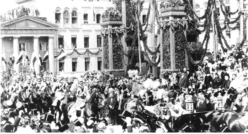
Avusturya-Macaristan İmparatoru I. Franz Joseph'in 4 Mayıs 1900 tarihinde Berlin'i ziyaretini gösteren bir fotoğraf

I. Franz Joseph ve İmparator II. Wilhelm birlikte, faytonun içinde Berlin'deki Paris meydanında gerçekleşen geçit töreninde görülmektedirler (Franz Joseph and Wilhelm II / Berlin, 1900).