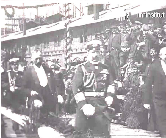
İmparator II. Wilhelm’in Stettin’deki tersaneyi ziyareti filminden bir kesit.

gösteriye katılımıdır. 24 Oskar Messter tarafından 4 Mayıs 1897’de çekilen film, II. Wilhelm’in geminin yapıldığı ve dönemin büyük tersanelerinden biri olan Stettin şehrindeki “AG Vulkan”ı ziyaret edişini gösterir. Filmin başında tersane avlusuna girişi sağlayan iskele köprüünün etrafına toplanmış, İmparator ve heyetini görmeye gelen halkı görürüz. İskele köprü üzerinden ilerleyen konvoyun önünde İmparator II. Wilhelm ve arkasından kendisine eşlik eden birkaç askeri ve sivil giyimli yetkililer, dönemin ileri gelenleri vardır. İmparator ve yanındaki heyet kameraya doğru ilerlerler. İmparator kendisini izleyenlere selam verirken, filmde II. Wilhelm de dahil olmak üzere kendisine eşlik edenlerin birçoğu kameraya bakarak operatörün yanından geçerler. Film 1 dakika 7 saniye uzunluğundadır. Oskar Messter filmin görüntülerini “İmparator’un başarılı ilk ve net yakın çekimi” olarak değerlendirir (Messter’den aktaran Koerber, 1996, s.55 ).