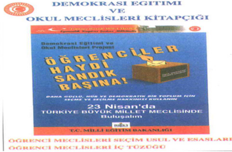
Tablo 4. 7. Sınıf Sosyal Bilgiler Ders Kitaplarında Ünite Bazında Günlük Konulara Yer Verilme Durumu

“Okul Meclisleri” çalışması ile ilgili afişe (s.135) yer verilmiştir. Öğrencinin eğitim gördüğü okulda eğer bu sistem uygulanmıyorsa bu afiş sayesinde öğrenci bunun nedenini sorgulayabilir. Okul meclisleri çalışması yapılıyorsa da öğrencinin bu uygulamanın daha iyi nasıl yapılabileceği konusunda fikir yürütmesini destekleyici bir unsur teşkil ettiği düşünülmektedir.