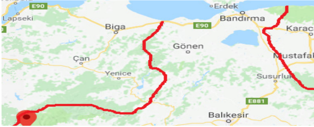
Harita 1: Altınoluk'un Kent İçerisindeki Konumu

yaparken; Edremit Belediyesi de geri kalan kent kısımlarında çalışmalarını gerçekleştirmektedir. Bu hizmet ayrımının daha iyi bilinmesi amacıyla Edremit Belediyesi tarafından kent meydanına hizmet alanlarını gösterir tabelalar yerleştirmiştir (Bkz. Fotoğraf 1). Balıkesir Büyükşehir Belediyesi hizmet ürettiği 2014 – 2018 yılları arasında kendi sorumluluk alanlarında temizlik, zabıta işleri, park düzenlemeleri ve ulaşım seferleri yapmasının yanında; öne çıkan fiziksel projeleri ile sahil dolgu uygulaması (Bkz. Fotoğraf 2), arıtma tesisinin kapasitesinin artırılması (Bkz. Fotoğraf 3), plaj kenarlarına bank, duş ve büfe konulması uygulamalarını da gerçekleştirmiştir (Bkz. Fotoğraf 4).