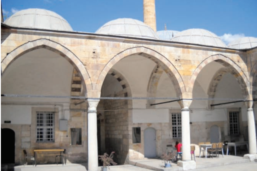
Fotoğraf 10- Damat İbrahim Paşa Medresesi. Giriş eyvanına avludan bakış

Caminin yer aldığı avlu kütesinin batısında, güneye doğru daralan bir parselde medrese, imaret ve sıbyan mektebi; bu grubun kuzeyinde ve onlardan bağımsız hamam uzanmaktadır. Kitabelerine göre, ilk üç yapı, İbrahim Paşa tarafından 1139/1726-1727 yılında, hamam ise 1140/1727-1728'de yaptırılmıştır.