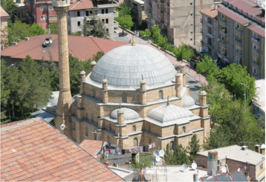
Fotoğraf 9- Damat İbrahim Paşa (Kurşunlu) Camii. Güneybatıdan genel görünüş

Şehrin güneybatısında bulunan ve Cami-i Cedit Mahallesi'ndeki, cami, medrese, sıbyan mektebi, imaret, kervansaray, hamam ve iki çeşmeden oluşan Damat İbrahim Paşa Külliyesi , Nevşehir'in en ünlü yapılar topluluğudur. Klasik Osmanlı mimarisinin son örneklerinden birisi olan külliye, topoğrafyaya başarılı bir şekilde uygulandığını görüyoruz. Kentin simgesi haline gelen külliye hakkında epeyce bilgiye rastlamak mümkündür (Anadol 1970; Kuran 1971: 243-247; Aktuğ 1992; Aktuğ Kolay 1993: 447-449; Mülâyim 1996: 127-131).