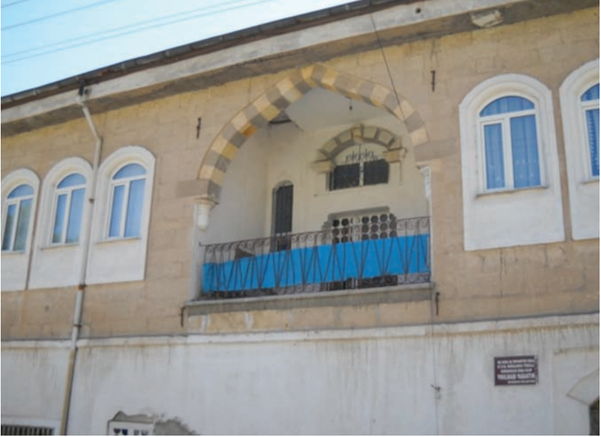
Fotoğraf 21- Dere Mah. Hafız İncekara Caddesi'ndeki 65 numaraya kayıtlı konut