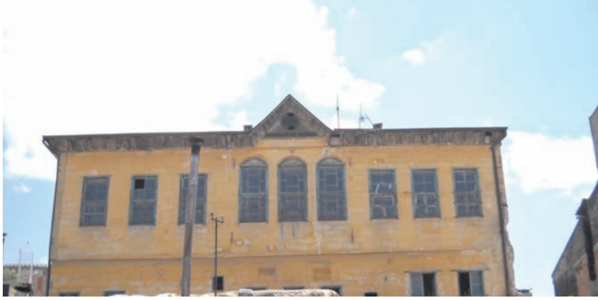
Fotoğraf 23- Kapucubaşı Mahallesi, Atabey Sokak 'taki Atabey Konağı

Kale'nin 350 m kuzeybatısındaki Atabey Konağı , Kapucubaşı Mahallesi Atabey Sokak 'a kayıtlıdır. Doğu-batı doğrultulu ve iki katlı anıtsal konağın ön cephesinde dokuz pencereye yer verilmiştir. Ahşap çatı, ortada üçgen bir alınlık oluşturacak şekilde inşa edilmiştir (foto 23). Konak bugün kullanılmamaktadır ve kısmen harapdır.