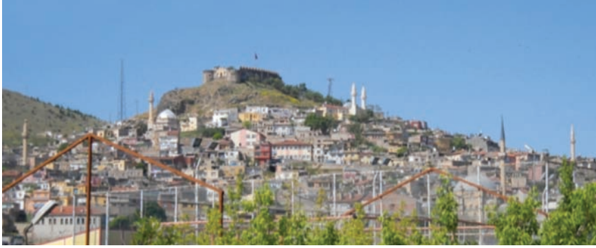
Fotoğraf 2- Nevşehir Kalesi ve çevresinin kuzeydoğudan genel görünüşü

Nitekim, batı girişinin yuvarlak kemeri, Selçuklu dönemine ait olmayacağını göstermektedir. 1.50 m açıklığa sahip doğu girişi ise dikdörtgen şekillidir ve üst kesimindeki kazıma kartuşun içi yazısızdır. Girişlerin bulunduğu cephelerde, her iki uçta da daire planlı birer burç yer alır. Maalesef kalenin iç kesimine, birbirinden bağımsız iki betonarme oturma platformu yapılarak, inşai ve fiziki müdahalede bulunulmuştur.