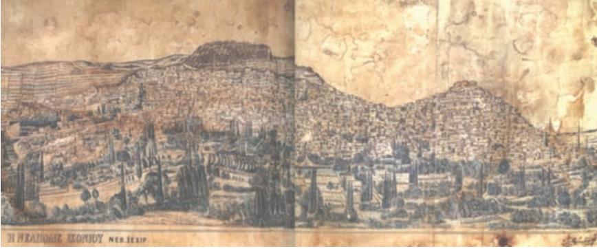
Fotoğraf 1- Nevşehir'in XIX. yüzyılın sonunu tasvir eden taş baskı resmi (Sözen, 2000: 434-435'ten değiştirilerek)

Kale ve eteklerinin gösterildiği, XIX. yüzyılın sonlarına ait taş baskı bir resimde, eski Nevşehir'in yoğun imar hareketlerine sahne olduğunu görmekteyiz (foto 1). Söz konusu resim, şehrin, Damat İbrahim Paşa zamanından beri artan nüfus ve yapılaşmanın hızını da gösteren önemli bir belge niteliği taşımaktadır. Şehrin güneybatısındaki sarp kayalıklar üzerine inşa edilen ve Selçukluların da kullanıldığı (Mülayim 1996: 124; Sözen 2000: 433) Kale 'de (foto 2, şek. 1) önemli yenileme çalışmaları yapılmıştır. Giriş cepheleri ile dendanların tamamen yenilediği ilk bakışta dikkati çeker. Batı (foto 3) ve doğudaki (foto 4) girişler, sivri kemerli birer niş arasına alınmışlardır. 2.03 m açıklığındaki batı girişinin üst kesimindeki dikdörtgen çökertme, bugün mevcut olmayan kitabe levhasının oturduğu alana işaret eder. 3 Giriş cepheleri, farklı renkte kesme taşlardan da anlaşılacağı üzere yenilenmiştir.