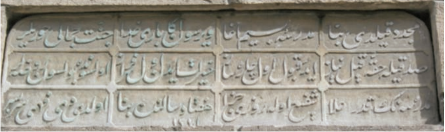
Fotoğraf 19- Orduoğlu Camii'nin kuzey duvarındaki medrese kitabesi

Diğer camilere oranla kaleye uzak sayılabilecek alanda, Herikli Mahallesi'ndeki Hacı Nasuh Ağa Camii , 1856 yılında Herikli aşireti tarafından yaptırılmışken, 1951 yılında yıkılarak bugünkü cami yaptırılmıştır. Cami, kalenin 900 m kadar kuzeyine düşmektedir.