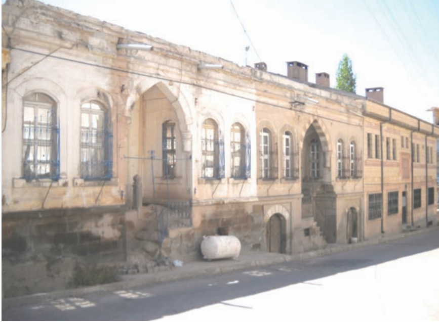
Fotoğraf 20- Dere Mahallesi Hafız İncekara Caddesi'ndeki 55 ve 57 numaralara kayıtlı konutlar

edilerek koruma altına alınmıştır. XIX. yüzyıl sonu-XX. yüzyıl başlarına ait bu maddi kültür varlıklarının sayısı 40 civarındadır. Dere Mahallesi Hafız İncekara Caddesi'ndeki dört konuttan birbirine bitişik olarak inşa edilmiş 55 ve 57 kapı numarasına kayıtlı taşınmazların cephelerinde ortak özellikler dikkati çekmektedir (foto 20): Simetrik yerleştirilmiş iki pencere arasına gemi teknesi sivri kemerli birer eyvan yerleştirilmiştir. Pencereleer erken Cumhuriyet yapılarında olduğu gibi büyük boyutludur. Eyvanın sokağa bakan cephesindeki merdivenlerle yüksek koddaki girişe ulaşılır. Cepheye hareket kazandıran silmeler ihmal edilmemiştir. Avrupa sanatının mimariye yansımalarını kabul etmeyen eden bu eserlerde, Osmanlı'nın klasik dönemine geri dönüş anlamındaki Neo Klasik üslup, bu dönem yapılarında da kendini bulmuştur. Taşın kolay elde edilmesi ve bolca bulunması nedeniyle, Nevşehir'deki taşınmazların neredeyse tümü bu malzemedendir (özellikle Nevşehir taşı olarak bilinen sarı taş).