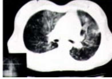
Resim 4: YDİVMP tedavisinin 3. gününde toraks tomografisindeki iyileşme hali