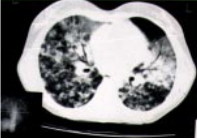
Resim 2: Toraks tomografisinde yama tarzı görünüm