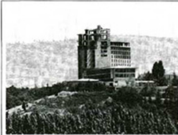
Resim 3. Marmara Oteli, 2006.

Satılan ve kiraya verilen arazilerin toplamına bakıldığında, Çiftlik arazilerinin 21.983.218 m 2 'sinin (%39,6) satış/devir, 6.888.496 m 2 'sinin (%12,4) ise kiralama yoluyla toplam 28.871.714 m 2 'sinin (%52) kamu kurumları ile özel kişilerin kullanımına bırakıldığı görülür 3 (DDK Raporu, 2003).