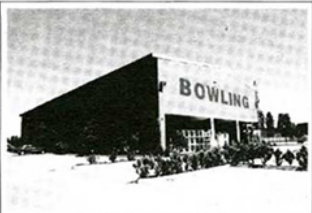
Resim 4. Bowling Salonu, 2006.