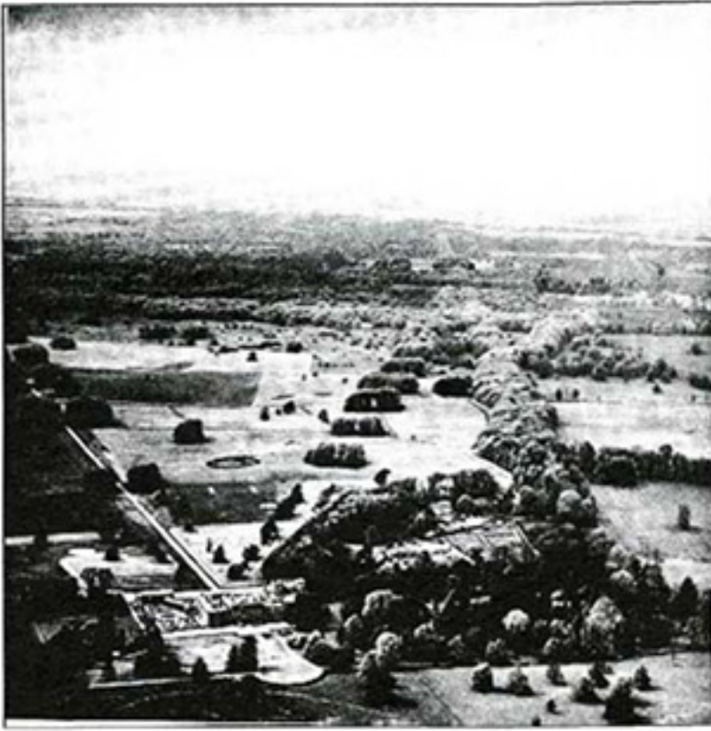
Resim 1. Çiftliğin ilk dönemi

Kuruluş amaçları doğrultusunda, Çiftlikte ilk aşamada ziraat ve hayvancılık organize edilir. Bunun uzantısı olarak endüstriyel tesisler oluşturulur. Üretimin değerlendirilmesi ve piyasalarla ilişkiyi sağlamak için ticari işletmeler kurulur. Bunun için satış mağazaları, lokanta ve gazinolar açılır. Çiftlik satış mağazalarında, çiftliklerin bütün mahsulleri satılır. 1