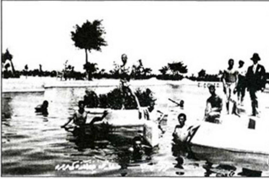
Resim 2. Marmara Havuzu

Kuruluşun yapısı incelendiğinde; meyveden sebzeğe, çiçekçilikten park-bahçe düzenlemelerine; meralardan ormana; küçükbaş hayvancılıktan mandıralara; bira fabrikasından malt'a; buz, soda, deri fabrikasına, ziraat aletleri ve demir fabrikasına, yoğurt imalathanesine kadar tarım ve hayvancılıkla ilgili her konuda üretim, değerlendirme ve pazarlama ünitelerinin olduğu görülür. Bu ünitelerin her biri, konusu ile ilgili olarak araştırma ve geliştirme çalışmalarında ülke düzeyinde örnek olur, zamanla bu çağdaş anlayış ülke üretimine yansır.