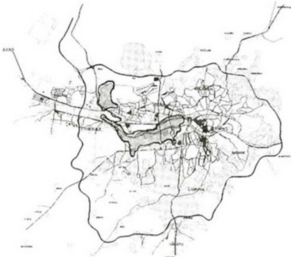
Şekil 2. Ankara kent bütününde AOÇ'nin yeri

Diğer yandan AOÇ, yeşil alan gereksinimi açısından Ankara kenti ve kent planlaması açısından yüksek bir potansiyel barındırmaktadır. AOÇ, -her ne kadar yarısı amacı dışındaki kullanımlara tahsis edilmiş olsa da- pek çok kenti kıskandıracak büyüklükte ve tam da kentin ortasında kalmış bir yeşil omurga durumundadır. Bu değer, eğer farkına varılabilirse Ankara'nın planlanmasında olağanüstü bir gizil güçtür. AOÇ, bu yönüyle doğal bir kentsel yeşil durumundadır.