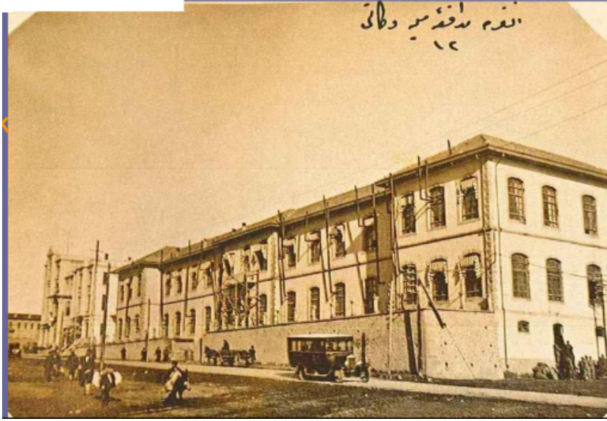
Görsel 5. Ankara Mekteb-i Sanayisi

Cumhuriyet’e geçişte medreseler kapatılmış ve İmam-Hatip Okulları açılmıştır. Cumhuriyet’e geçildikten sonra 1925 tarihli istatistiklerde İmam-Hatip Okullarında toplam 43 öğrencinin öğrenim gördüğü ve bu öğrencilerin 41’inin dönem sonu sınavlara girerek başarılı olduğu kaydedilmiştir 84 .