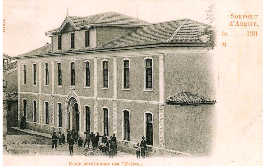
Görsel 2: Ulus'ta Kardeşler Sokak'ta bulunan Aziz Clement Fransız Koleji (1916 yangını öncesi)

Kaynak: Maarif Vekâleti İhsaiyat Mecmuası, R. 1329-1330, Maarif-i Umumiye Nezareti İhsaiyat Mecmuası, R. 1333-1334 tarihli istatistiklerden derlenmiştir.