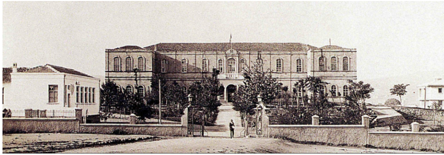
Görsel 4 Ankara Erkek Lisesi (Kaynak: Melek-yildizturan-arkeolog-anadolu-medenyetleri-muzesi.html "Başkent'in doğuşu Ankara sunusundan alınmıştır).

Ankara Sultani 'sinde 8 idari kadroda çalışan olmak üzere 17 öğretmen 3 yardımcı personel ve 13 hizmetli bulunmaktadır. Öğretmenlerin 4'ü 20-25 yaş, 6'sı 25-30, 3'ü 30-40, 4'ü de 40-50 yaş aralığındadır. Öğretmenlerin 2'si Darülfünun Ulum'u Şeriye, 1 ise edebiyete, 1'i riyaziye mezunu, 1 öğretmen Mekteb-i Harbiye, 1'i ise Halkalı Ziraat Mektebi mezunudur. 6 Öğretmen Dar'ül-muallim'i ibtidaiye mezunu, 4'ü sultani ve idadilerden, 1'i özel öğretim kurumlarını bitirmişlerdir. Öğretmen yetiştirme ve istihdamı açısından imparatorlukta genel durumla benzerlik göstermektedir.