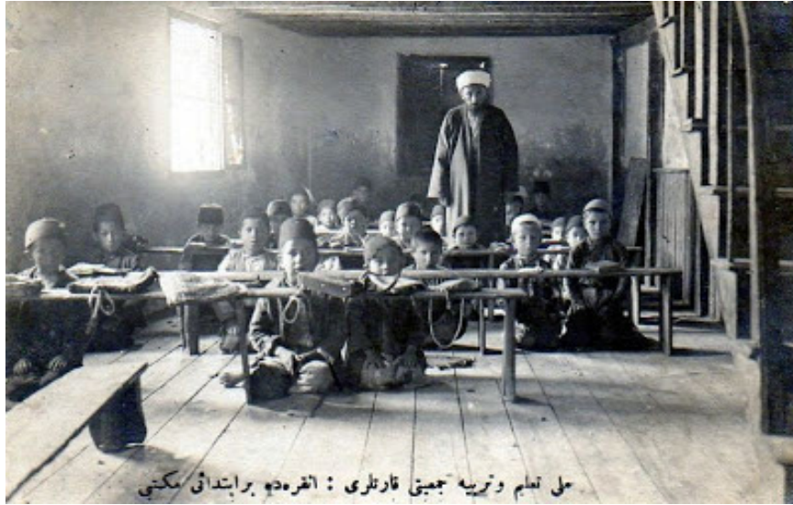
Görsel 1. Ankara'da bir ibtidai mektebi 26

1911-12 (1329-30) öğretim yılında ülke çapında bütün ibtidailerde devlet okullarında 260, özel okullarda 18, gayrimüslim okullarında da 80 olmak üzere toplam 358 öğretmen görev yapmaktadır. Ankara için aynı yıl ayrılan bütçe 319536 kuruştur 25 .