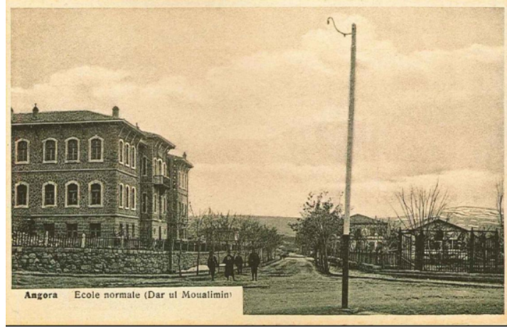
Görsel 3. Ankara Dar'ül-muallimin (Erkek Öğretmen Okulu binası 1947 yılında yanmıştır)

Ermeni olmak üzere toplam 109 kişidir. Öğretmenlerin mezuniyet durumlarına ilişkin veriler incelenmiş, 3 öğretmenin Darülfünun, 3 öğretmenin Halkalı Ziraat Mektebi mezunu, 3 öğretmenin Dar'ül-muallimin-i Aliye, 2 öğretmenin Dar'ül-muallimin-i Rüşdi ve 5 öğretmenin de İbtidai mezunu olduğu belirlenmiştir 64 . II. Meşrutiyet sonrasında öğretmen yetiştiren okulların niteliğinde gelişmeler olmuş ve bu gelişmeler taşradaki okullara da ulaşmıştır. Bununla birlikte I.Dünya Savaşı yıllarında özellikle Dar'ül-muallimin-i ibtidailerde öğretmenlerin savaşa gitmesi nedeniyle sayıları azalmış öğretmenlerin niteliğinde de düşüş olmuştur. Bunun üzerine Ankara, Konya gibi merkezlerde açılan Dar'ül-muallimin-i Rüşdilerden mezun olanlar vilayet Dar'ül-muallimin-i ibtidailere atanmışlardır 65 .