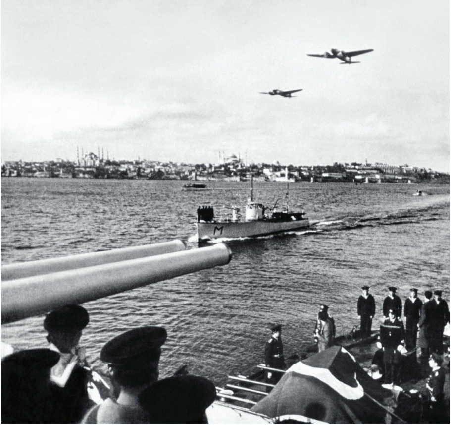
Ek 2: Ulu Önder ATATÜRK'ün Naaşının Donanma Tarafından 19 Kasım 1938 tarihinde İstanbul'dan İzmit'e Götürülmesine Ait Fotoğraf